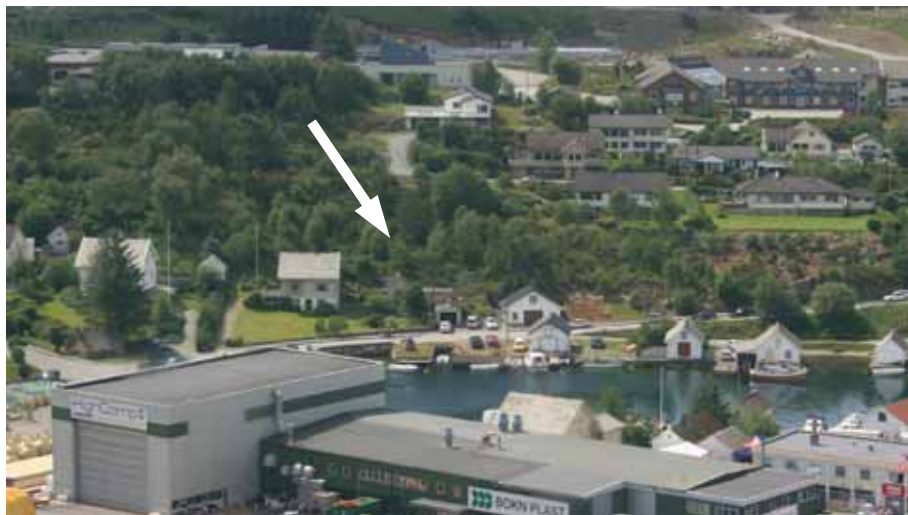
Pila viser kor huset kjem.