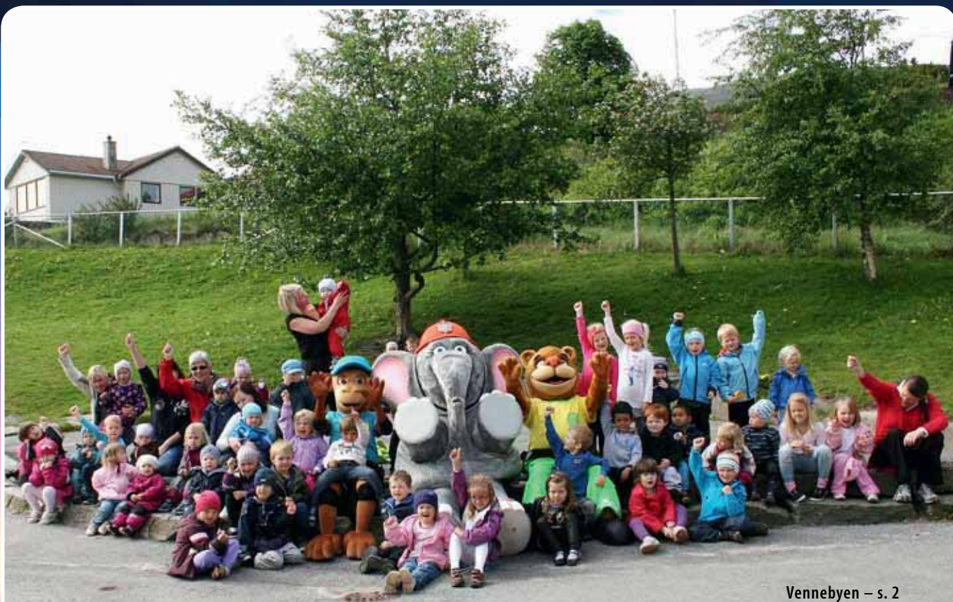
Vennebyen – s. 2