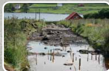
Steinalderbuplass – s. 17