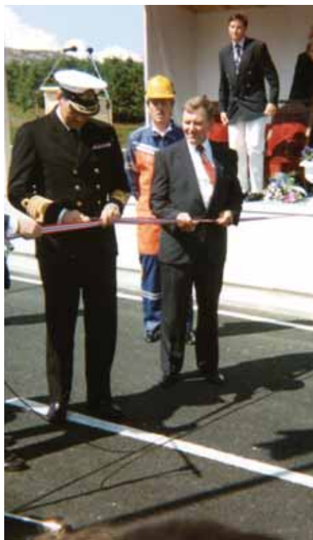
Kongen opna Kyststamvegen med snorklipping.