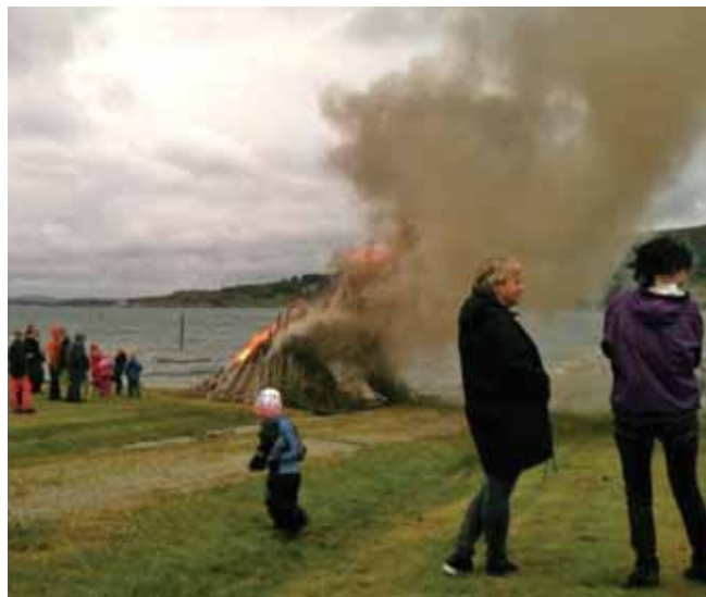
Ut på kveldinga blei eit flott bål fyrst opp ved strandkanten og ga varme til småkalde St. Hansingar.

Ut på kveldinga blei eit flott bål fyrst opp ved strandkanten og ga varme til småkalde St. Hansingar. Den kalde vestlandskvelden var ei påminning om at "sola har snudd" og at det sakte går mot mørkare kveldar.