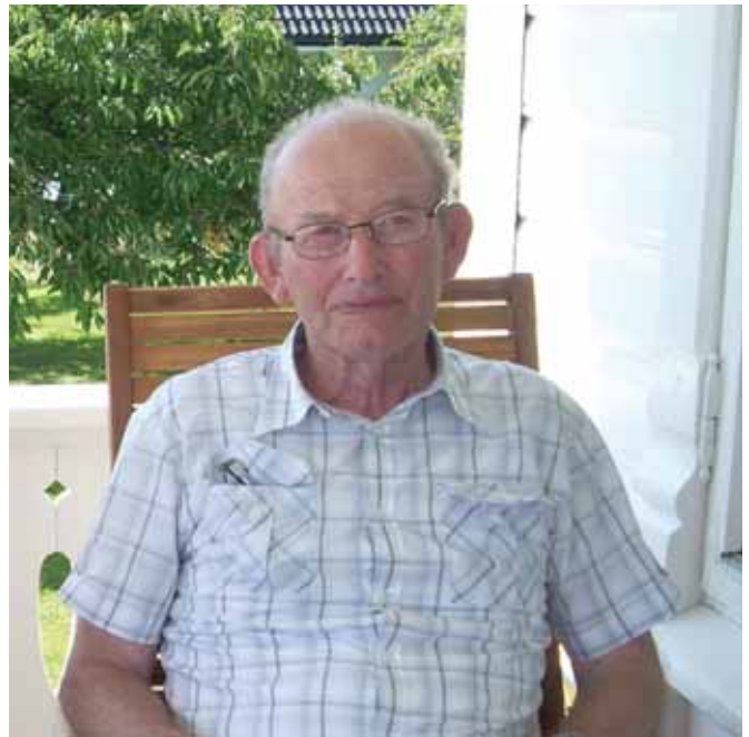
Han etterlet seg kone, to barn, svigerson og to barne- barn.