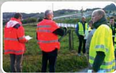
Rogfast-synfaring – s. 16