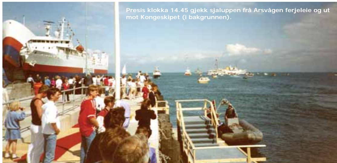
Presis klokka 14.45 gjekk sjaluppen frå Arsvågen ferjeleie og ut mot Kongeskipet (i bakgrunnen).