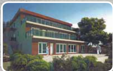
Føresvik Terrasse – s. 4