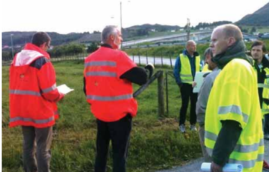
Statens vegvesen stilte mannssterke i samband med synfaringa på Austre Bokn 20. juni.

Reguleringsplanen skal etter planen vera ferdig om eit år. I tillegg kjem ein del arbeid i samband med høyring og offentleg handsaming av planen.