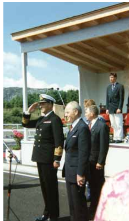
Etter snorklippinga spelte korpsa "Ja, vi elsker".

Ei ny tid var begynt for Bokn då bilane kørde om bord i storferja "Stamveien".