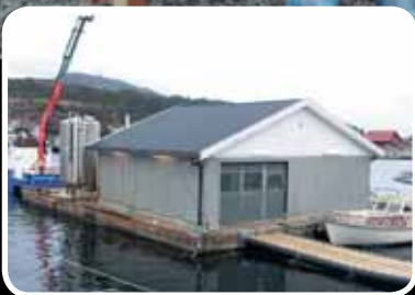
Bokn Sjøservice A/S har meir enn femdobla antal tilsette. Les meir s. 4