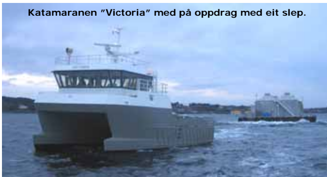
Katamaranen "Victoria" med på oppdrag med eit slep.