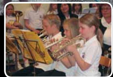
Bokn musikkorps sin tradisjonelle vårkonsert gjekk føre seg 20. april. Les meir s. 6