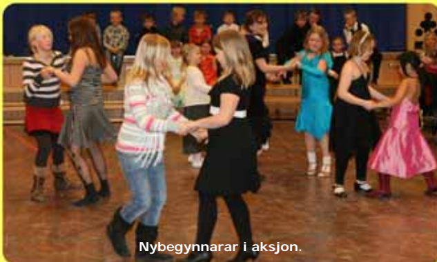
Nybegynnara i aksjon.

Underholdninga opna med "pakkeleiken" for store og små, og den var populær, som alltid. Etterpå var det dansefram-syning av små og store par, og det er kjekt å sjå kor flinke dei er. Til og med dei som begynte etter jul, har alt både rytme og trinn inne.