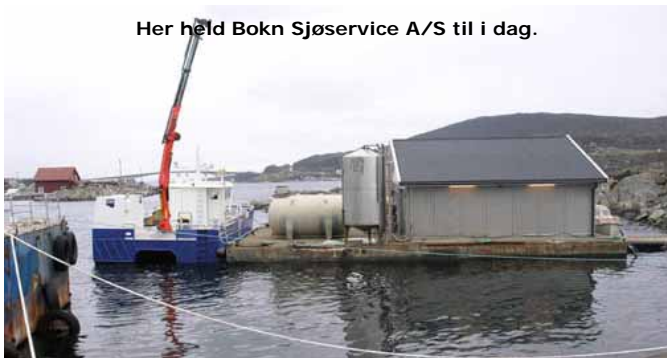
Her held Bokn Sjøservice A/S til i dag.

Dei utfører også oppdrag for forsikringselskap som berging av båtar og liknande. Vidare driv dei med utleige av generatorar, og har 3 i beredskap. Dei har også ein kranbil. For å avlasta båtane sine, kan dei kjøra utstyr med kranbilen til kai frå leverandøren, slik at båtane kan lasta dei om bord og gå til oppdrettet.