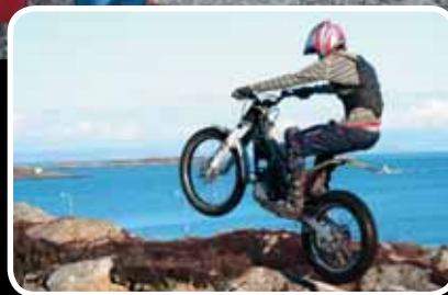
Pluggen hoppar opp ein klasse og skal gjennomføra ein av fem rundar i NorgesCupen. Les meir s. 5