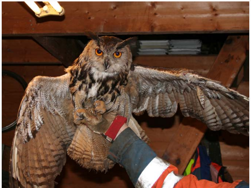
Hubroen er ein kraftig fugl med stort vengespenn. Norges største uglefugl er nå i tydeleg betre form etter godt stell i 1/2 år.

Ottar vil nå flytta fuglen til eit noko større rom, slik at han må flyga ned av vaglet for å henta maten.