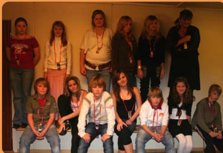
7. klasse med premie for klassen med mest leste boksider.

Sjølv om dei likte å lese om kjærleik var det ikkje mykje romantikk på skulen, meinte elevane knisete, så litt hvisking i korridorane om gutar og jenter er det nok! I den digitaliserte verda lurte eg på om dei heller ville velge film framfor bok, og alle var enige om at å sjå film etter å ha lese boka kunne vera