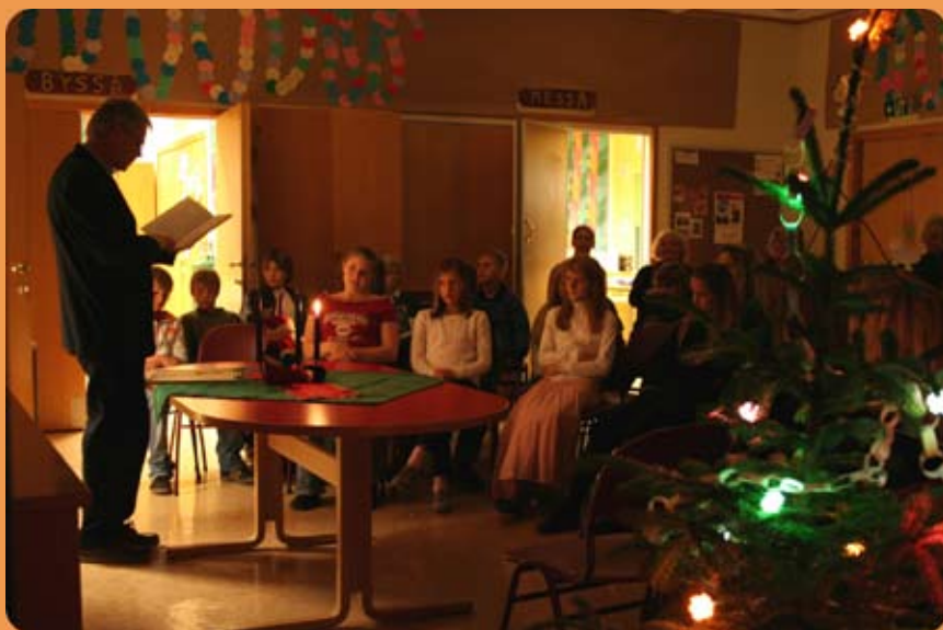
Passe skummelt om Roald Dahl.

Det var eit svært velukka arrangement og ei verdig avslutning på eit prosjekt eg håpar både skule og bibliotek tek opp til neste år!