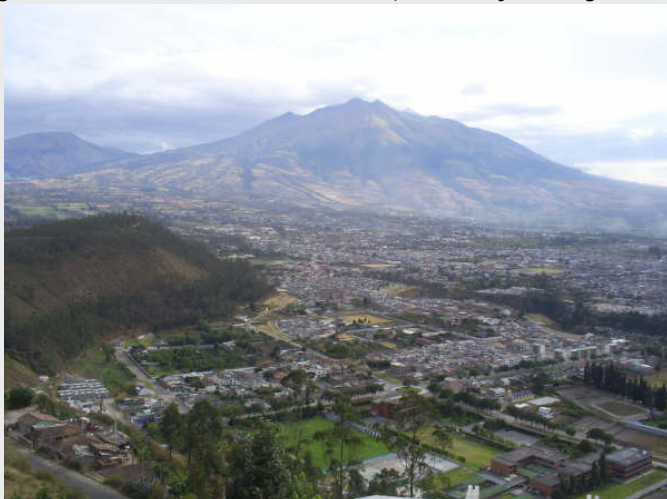
Oversikt over Ibarra, 2.200 m.o.h.

er nøkkelordet for dei som ynskjer å reise som utvekslings-elev. Me har eit visst ansvar - ikkje berre for oss sjølv, men og for organisasjonen og dei heime. Dessverre er det ein del som gløymer dette ansvaret, og slik har det seg at utvekslingslevar og europearar generelt har eit dårlig rykte her. Mellom anna at dei er kjende for å vere nokre festløver... Yfu sine reglar er klare på dette punktet, og det er faktisk ein elev som allereie er heimsendt pga. brot på ordensreglar.