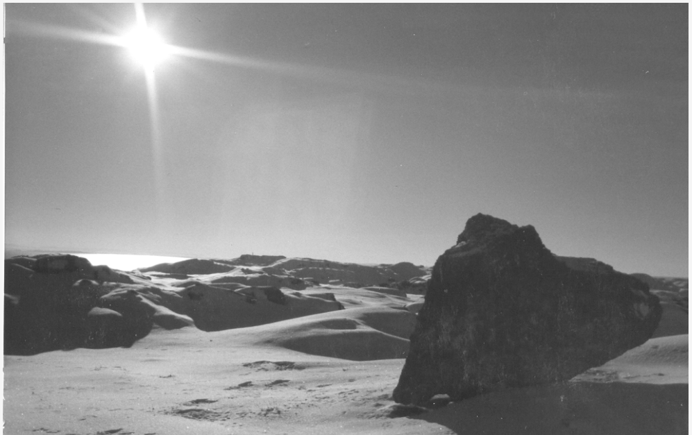
På dette flotte bildet frå boka er det langt frå snøstorm. I vinterlandskapet frå Loten heiter steinen til høgre i biletet Kjerringa. Den kan ein sjå både frå vestsida og austsida av Lodalandet. Den vart mykje bruka til mé under fiske. Elles så ser me marka sørover mot festninga og Boknafjorden.

Ikkje så lenge etter var me på plass under dyna. Oppvarma strykejern gav varme i kalde føter. Det knasa litt i madrassen før rompa glei ned i den vesle gropa som allereie hadde danna seg i halmen som var skifta like før jul. Han Jon Blund kom snikande før kveldsbøna var bedd til ende, og snart var me i draumeland.