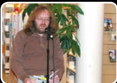
Fin stund på biblioteket Les meir s. 4