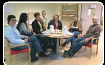
Utviding og oppussing av helsestasjonen Les meir s. 15