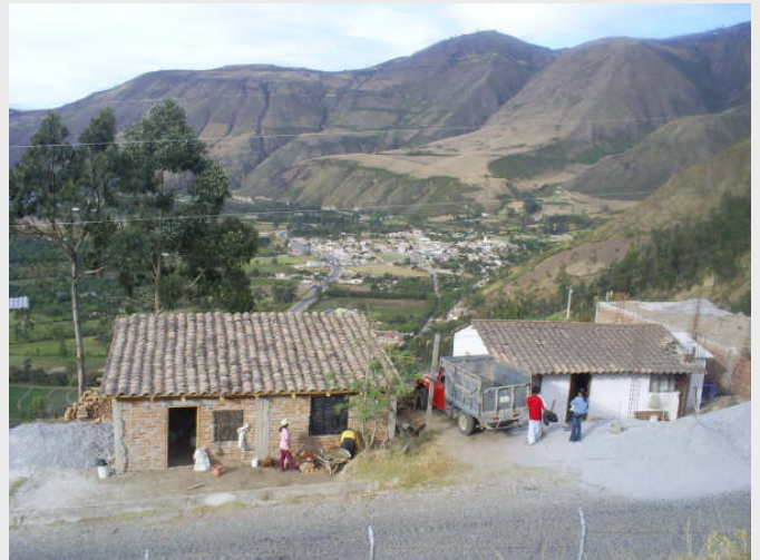
Hos ein inkafamilie lenger oppe i fjella.