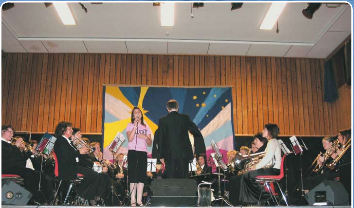
Luciafest s. 6