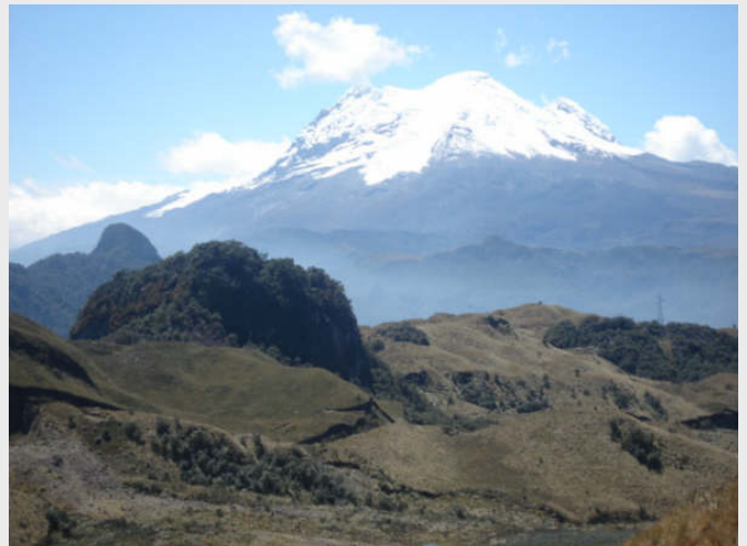
Ecuador har til og med snø.