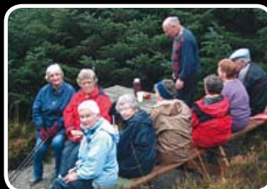
Spreke pensjonistar Les meir s. 9