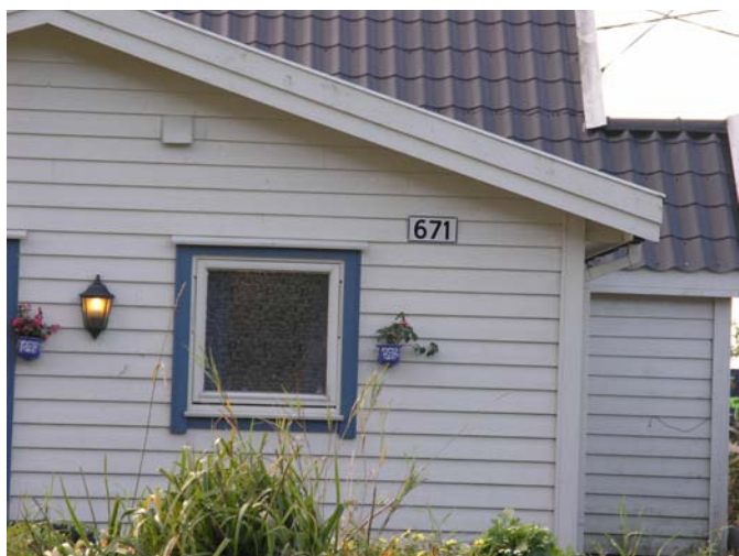
Grønnestadvegen 671 på Grønnestad har fått nummerskiltet på veggen.

sett blir folk flest oppmuntra til å halda stadnamna i hevd. Vidar seier han har snakka med mange som er opprørte over endringa av det nye adressesystemet.