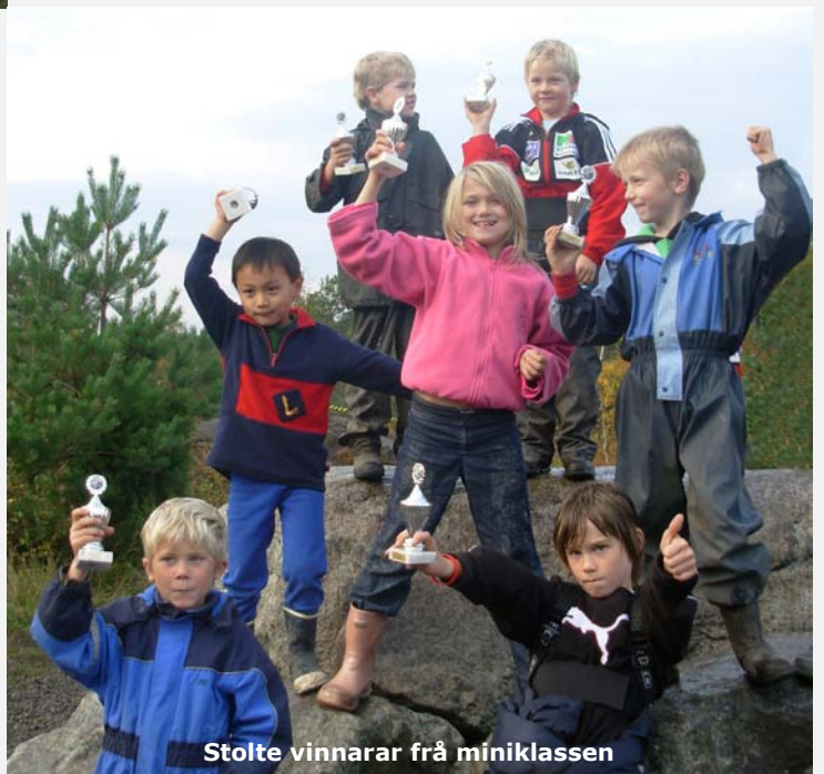
Stolte vinnarar frå miniklassen

Pluggen MK ynskjer alle køyrarar lykke til vidare.