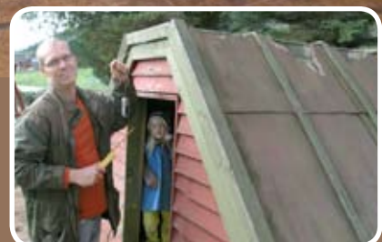
Stor variasjon i leikeplasstandard Les meir s. 14