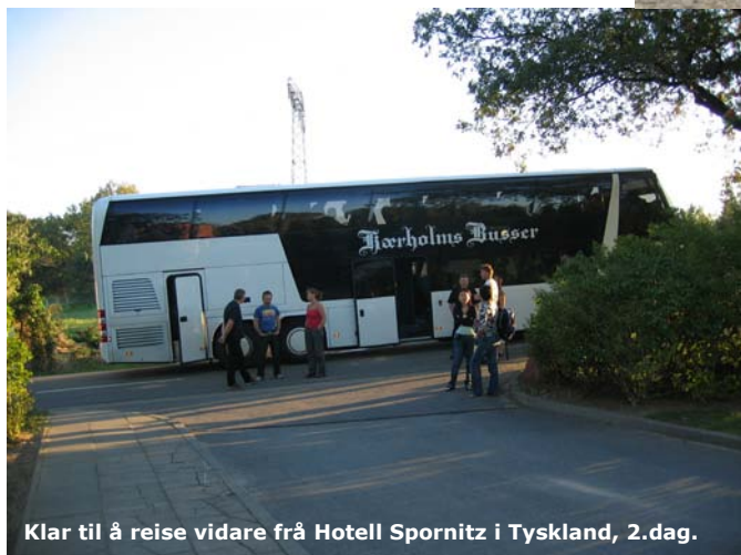
Klar til å reise vidare frå Hotell Spornitz i Tyskland, 2.dag.

Me overnatta på hotell Spornitz rett over grensa til Tyskland. Tidleg start neste dag - og me køyrde heile dagen, og kom til hotellet vårt rett utanfor Auschwitz, om kvelden.