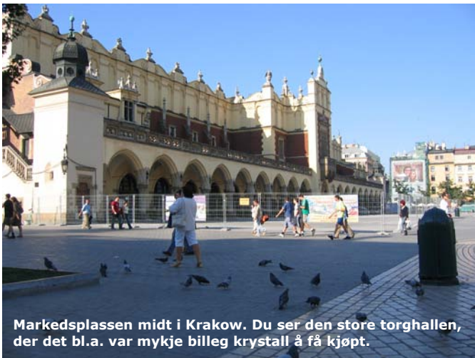
Markeds plassen midt i Krakow. Du ser den store torghallen, der det bl.a. var mykje billeg krystall å få kjøpt.

Etter dette reiste me vidare inn til Krakow - no var det slutt på den "alvorlege" delen av turen for ei stund. Krakow er ein fin, gammal by med ein stor markeds plass i sentrum - og denne ettermiddagen fekk elevane gå i grupper og sjå seg om (les:shoppe). Nokon var innom den vakre Mariakyrkja, som mellom anna er kjend for si flotte altartavle og fine glas-maleri. I markeds hallen var det mykje billeg krystall, og her var det nok ein del foreldre som var interesserte.