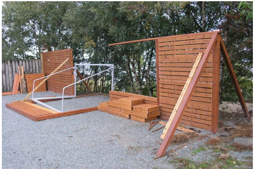
TO DAGAR ETTER: Vandalane har sannsynlegvis klart å brekka ned deler av veggen med spark og muskelkraft. Her har Bokn IL rydda og sikra restene for skuleungar.