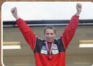
Kretsmeister i Trial 2006 Les meir s. 13