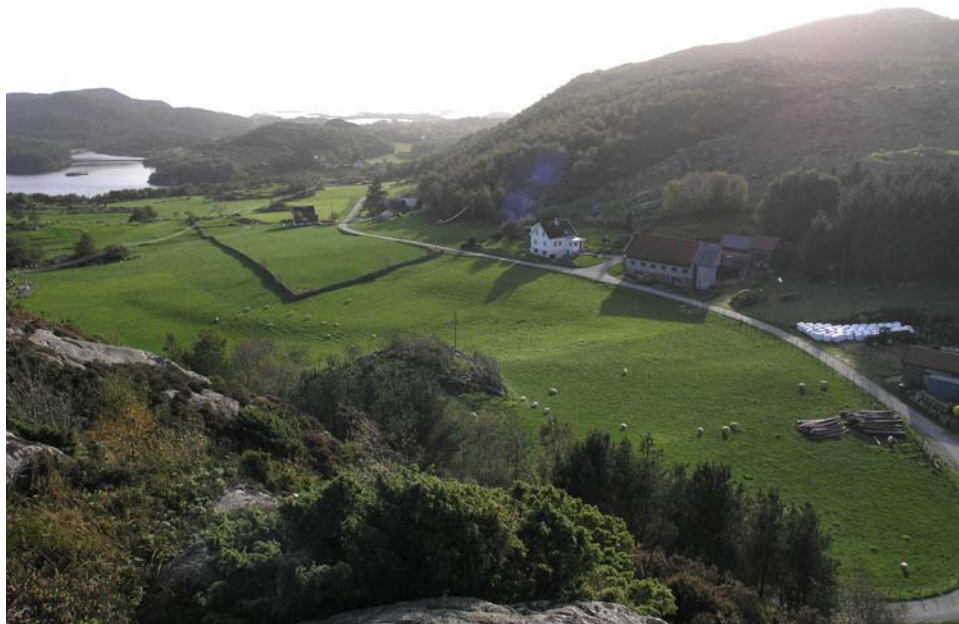
Dagsland. Litt av Vatnalandsvatnet i sør.

Vidar Grønnestad synest det er synd at mange stadnamn med det nye adressesystemet blir tatt ut av bruk. Generelt