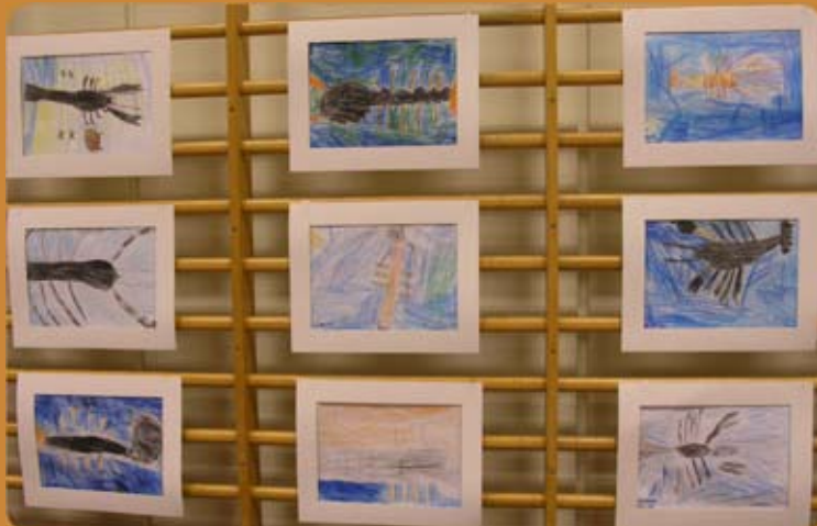
Fargerike hummarteikningar og hummarfigurar i plastelina frå småskulen.