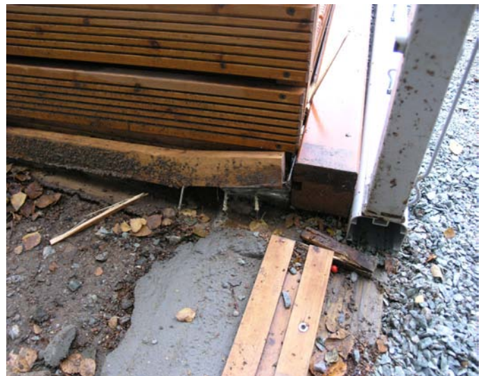
KREFTER: Store skruar blei opprivne og jern bøyde då ballveggen gjekk i bakken.