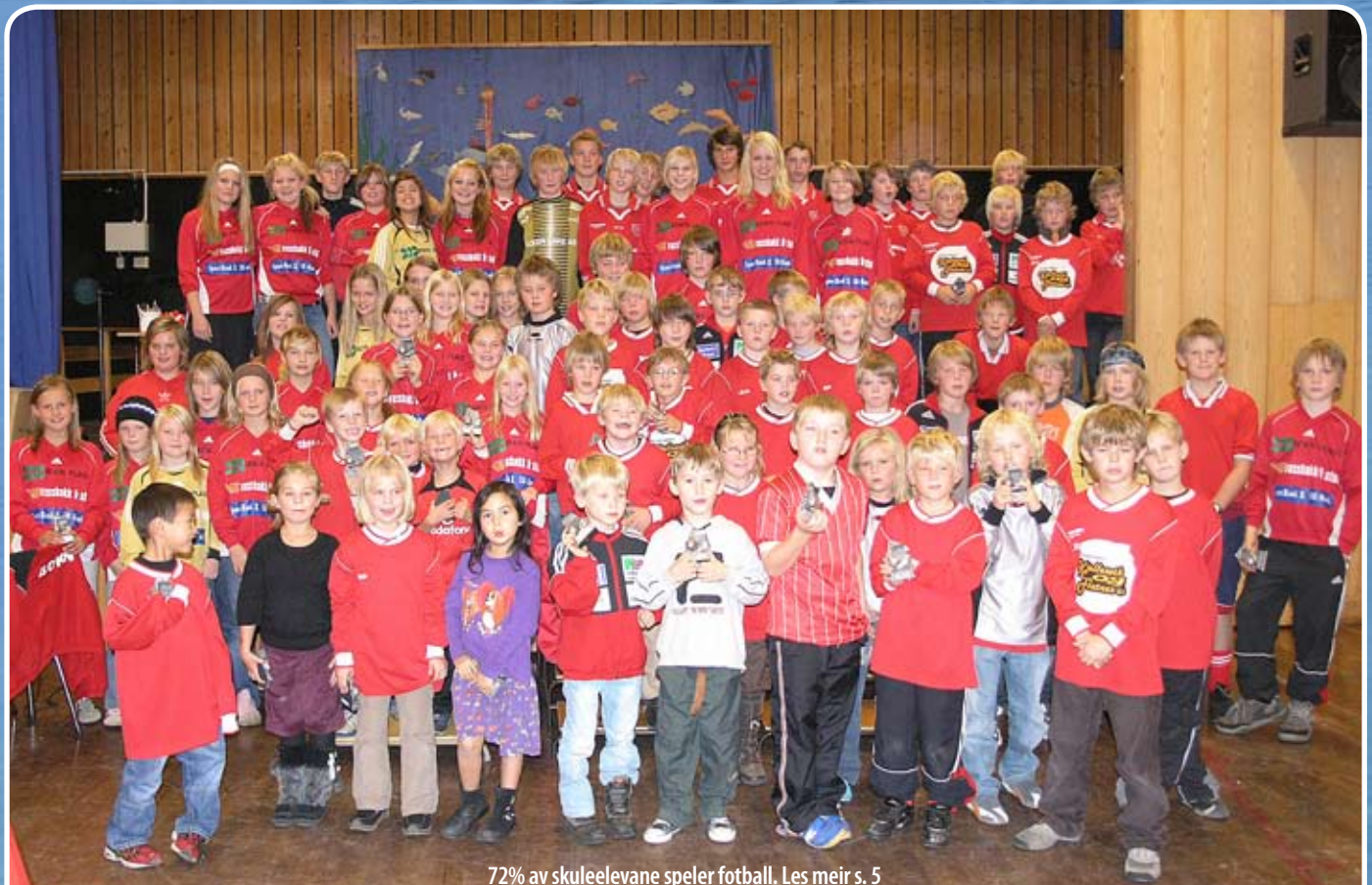
72% av skuleelevane spelar fotball. Les meir s. 5