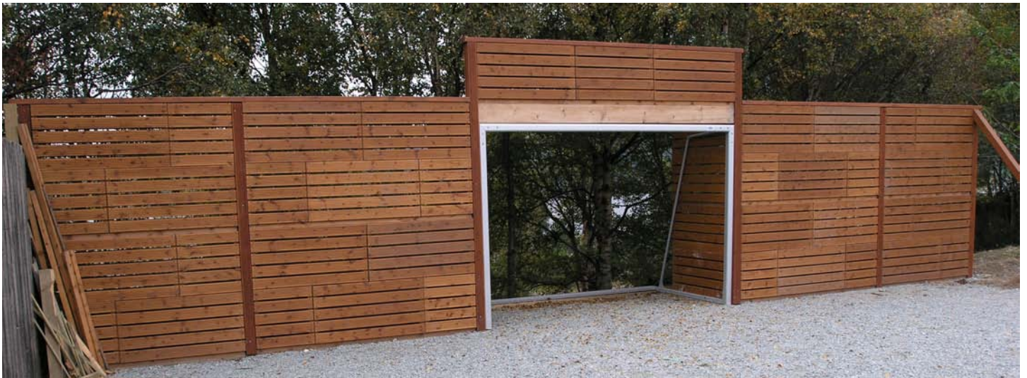
Veggen kom opp igjen ei veke etter dansen.