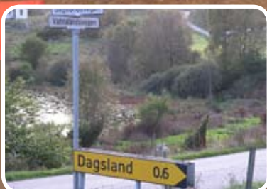
Ikkje nøgde med nye vegnamn Les meir s. 6