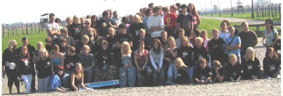
Alle elevane frå Bokn og Tysvær som var med på turen. Tatt i Birkenau.

Me hadde ein fin og interessant tur, elevane oppførte seg eksemplarisk - og eg trur det var veldig godt for oss alle at me hadde fri på mandagen etter.