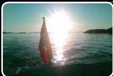
Månadens MMS-bilde Les meir s. 2