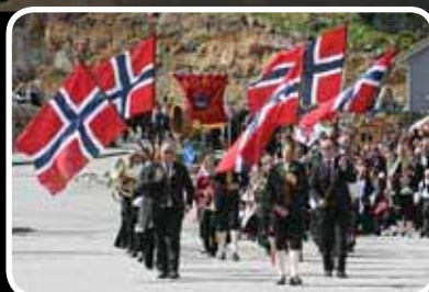
Flott nasjonaldagfeiring. Les meir s. 3