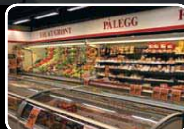
God utvikling Les meir s. 4