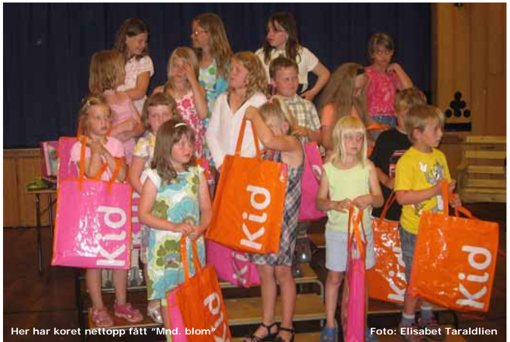
Her har koret nettopp fått "Mnd. blom"

Denne endringa gjer me for lettare å halde på dei eldre barna, og ha større utval av songar barna kan klare å læra. For å støtta leiarane, vil me prøva å vera fleire vaksne på samlingane.