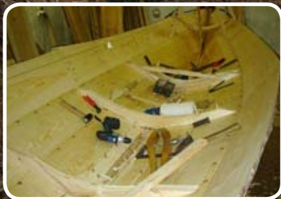
Boknabåten blir klar til kapproinga 17. mõi. Les meir s. 3