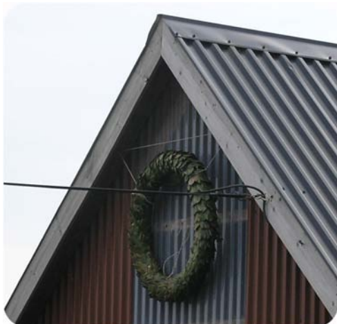
Høgt i mønet i stallen på Ognøy heng laurbærkransen frå Bjørgvin-løpet den 20.april i år.

Siste løp han var med på, var V75-løpet på Forus lørdag den 29.april. Her var han også ein av favorittane, men på grunn av hovne kjertlar i halsen, fekk han ikkje tilstrekkeleg