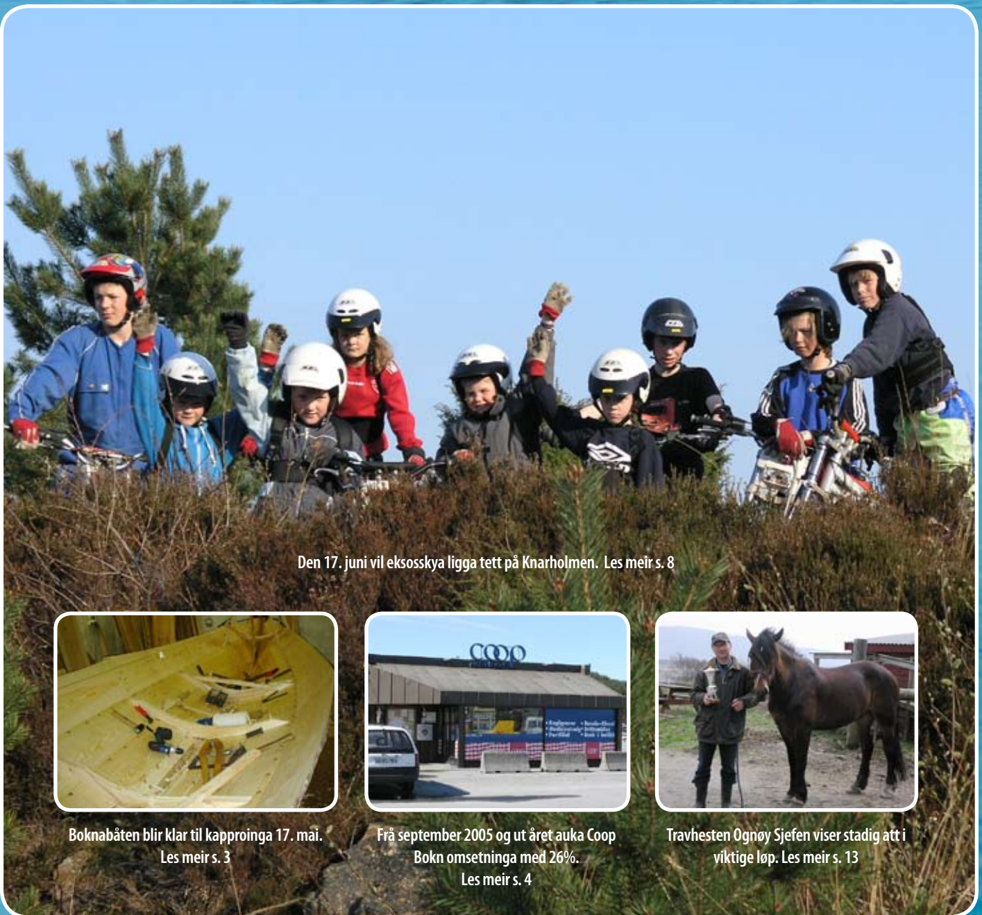
Den 17. juni vil eksoskya ligga tett på Knarholmen. Les meir s. 8