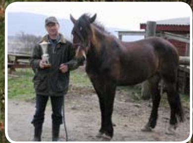
Travhesten Ognøy Sjefen viser stadig att i viktige løp. Les meir s. 13