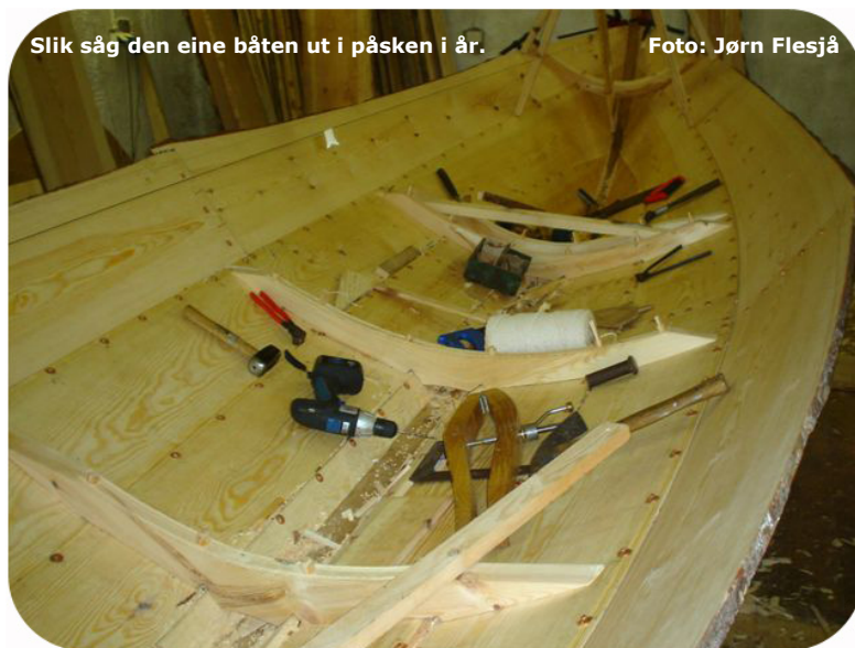
Slik såg den eine båten ut i påsken i år.

Pengane til dette har nærmast strøymd inn til formålet.