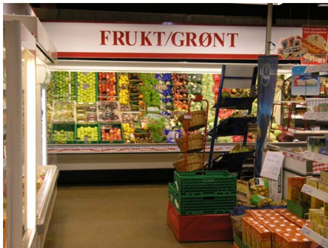
Auka konkurranse kan gi betre vareutval for kundene. Her frå frukt og grønnsaksdisken.