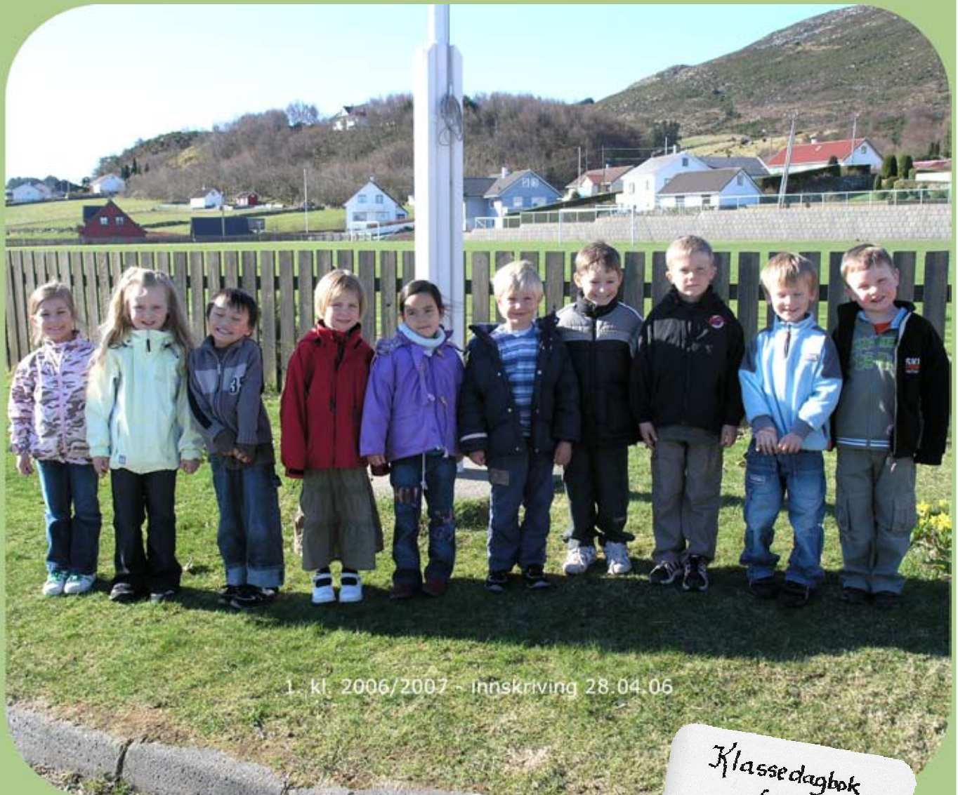
1. kl. 2006/2007 - innskriving 28.04.06

Desse blei innskrivne 28. april og skal byrja i 1. klasse 21. august: