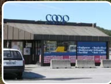
Frå september 2005 og ut året auka Coop Bokn omsetninga med 26%. Les meir s. 4