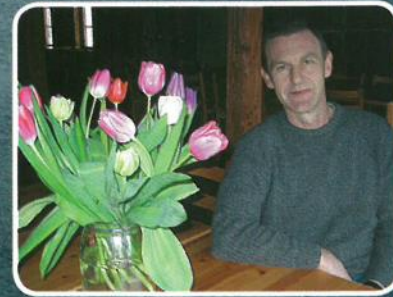
Et jubileum kan ofte gi tanker til å se tilbake på tiden som er gått. Les meir s. 7