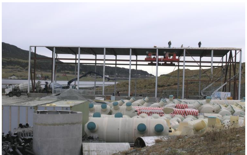
22. februar var det berre rammeverket som var oppe på den nye hallen.

Med produksjon både innafør tankar/reanseanlegg og vindmølleproduksjon, er Bokn Plast ein relativt stor aktør innafør miljøsegmentet i komposittindustrien.