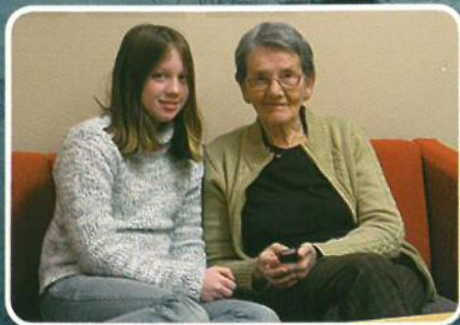
Vanlegvis er det den yngre garde som er elevar, og dei litt eldre som underviser. Les meir s. 5