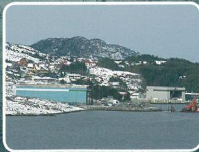
Bokn Plast er i full gang med å bygga konstruksjonar til vindmøllehus i den store hallen i Føresvik. Les meir s. 6