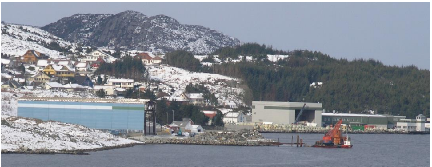
Den nye hallen pr. 9. mars nærmar seg ferdigstilling. Denne er på 1.000 m2. Den gamle hallen midt i bildet er på 612 m2.

Vindmøllehusa er på storleik som ein einbustad, men er høgare. Dei blir bygde i modular, og skal fraktast ut til kaien og lastast i båtar når dei er ferdige.