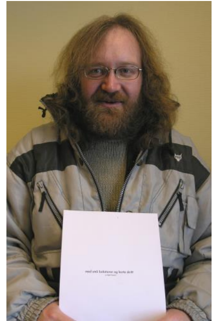
Bygdabladet gratulerer og håpar dikta blir gitt ut på forlag.

Diktsamlinga kan du lasta ned i nettutgåva eller låna ho på biblioteket.