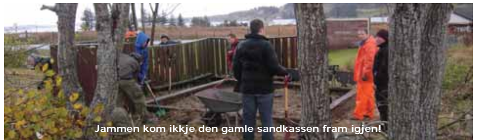
Jammen kom ikkje den gamle sandkassen fram igjen!