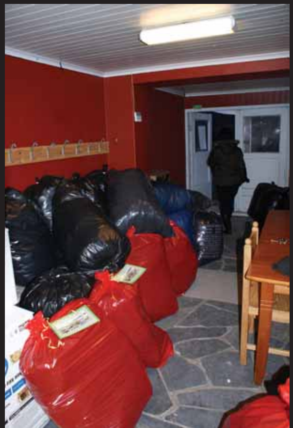
90 sekkar og esker i alt. Julegavesekkene er raude og er pynta med julekort.