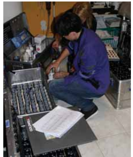
Bruk av fargekart og mykje drøfting av hårfargar samt fargeblanding på vaskerommet, var det mykje av på kursdagen.

mange ulike fargar i modellane i løpet av dagen.