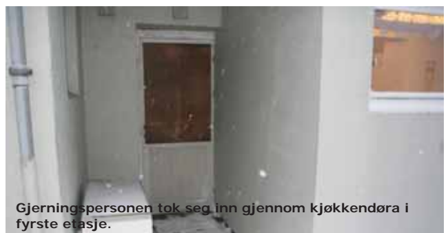
Gjerningspersonen tok seg inn gjennom kjøkkendøra i fyrste etasje.

Natt til 16. desember blei det gjort innbrot på Austre Bokn bedehus. Gjerningspersonen har truleg tatt seg inn i fyrste etasje ved å kasta ein stein gjennom vindaug i døra inn til kjøkkenet. Det var rota rundt inne i bedehuslokala, og skuffer og skap stod på vidt gap då innbrotet blei oppdaga tidleg på morgonkvisten. Det var forbipasserande som melde frå om innbrotet. Det blei stole eit par høgtalarar og eit TV-apparat frå staden. Saka er meldt til politiet. Same natta blei det også meldt om innbrot i lokala til Pedersen Logistikk i Slättevik. Politiet veit ikkje førebels om det er nokon samanheng mellom desse hendingane.