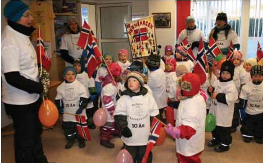
"Hurra for deg" ljomar i Servicetorg-veggane.