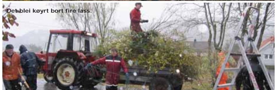
Det blei køyrt bort fire lass.