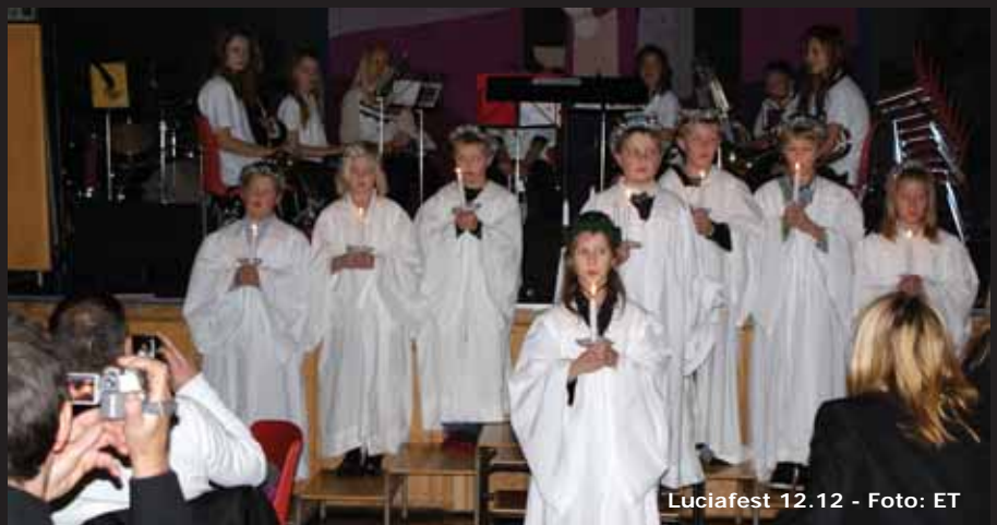
Luciafest 12.12 - Foto: ET