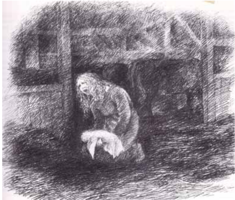
Etterpå trega Åse.

Garden var vid, og dei laut ha arbeids-hjelp til å makta med han. Difor festa dei bra med tenestefolk – både tri og fire visst. Tenestefolka låg i ei bu for seg. Fyrst på 1620-talet festa dei også syskenborna Einar og Åse som dreng og tenestejente. Vinteren 1626 skjedde det at dei to syskenborna i kalde netter heldt varmen under same fellen.