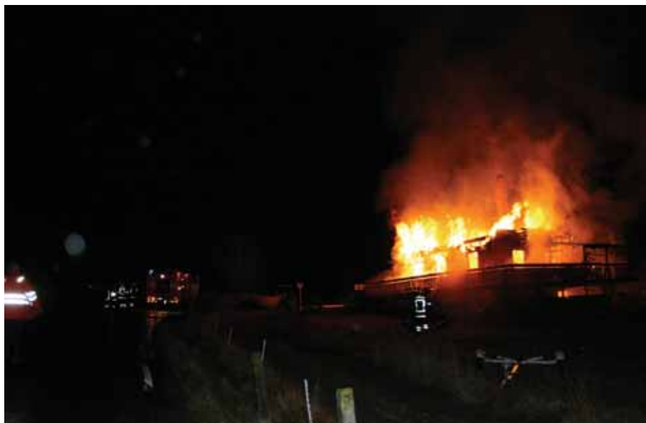
Huset brann ned til grunnen.