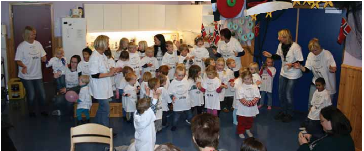
Snakkesongen "Hei, eg heiter Joe" var eit populært innslag.