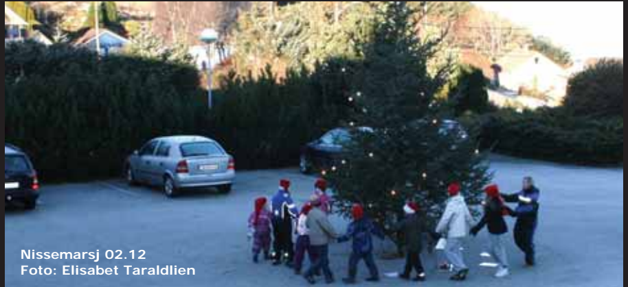
Nissemarsj 02.12