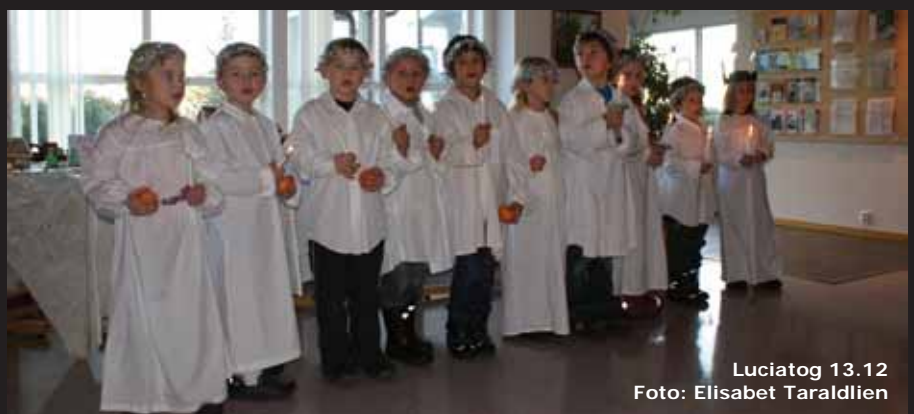
Luciatog 13.12