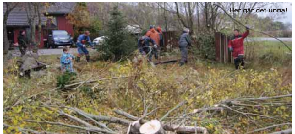
Her går det unna!

Kong-vinter har forseinka prosessen litt, men apparata kjem opp så snart tela i jorda forsvinn og det blir tilfredsstillande monteringsvær.