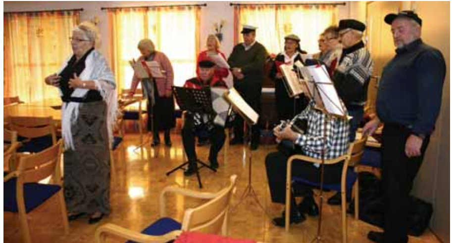
"MARI, DU BEDÅRE": God underholdning av "Tysvær-Higrane".

Mange av songane blei også visualiserte, slik at publikum fekk leva seg inn i handlinga. Det slo bra an, og ofte er det veldig lite som skal til for å gjera suksess. Dei aktive pensjonistane frå Tysvær spreidde glede, noko dei sa før opptinet at dei håpa dei ville gjera.