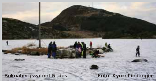
Boknabergsvatnet 5. des.