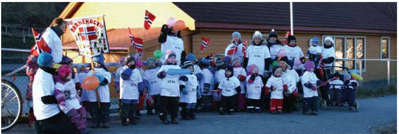
Her er heile gjengen samla utafør huset sitt.