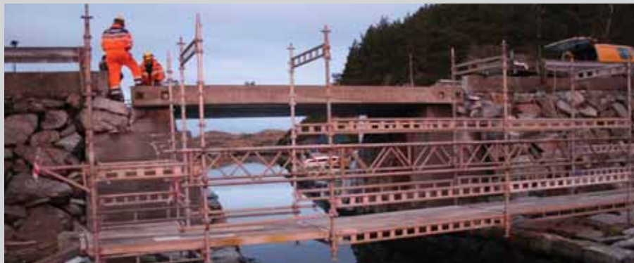
14.12.: "Mesta" utførte arbeidet. I forgrunnen ser ein den midlertidige gangbrua.