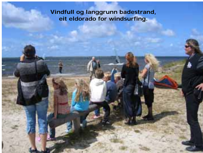
Vindfull og langgrunn badestrand, eit eldorado for windsurfing.

Med omlag 12 timar i bussen blir ein slik ferjetur eit viktig avbrekk, spesielt i forhold til reisa gjennom det paddeflate