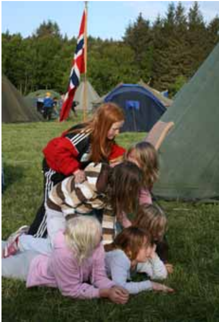
Frå Blikshavn 08

Nødvendige kvalifikasjonar er at du er glad i ungar og uteliv, og at du møter trufast opp. Dei fleste av oss som er leiarar hadde ingen speidarbakgrunn. På krinsleiren på Fitjar nyleg var tre av leiarane besteforeldre langt over seksti, og dei klarte seg bra. Velkomen som leiar i speidaren!