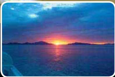
Solnedgang s. 2