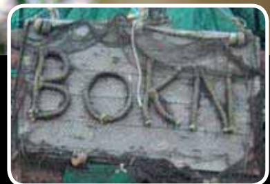
Speidartur s. 16