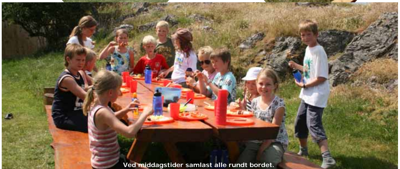
Ved middagstider samlast alle rundt bordet.