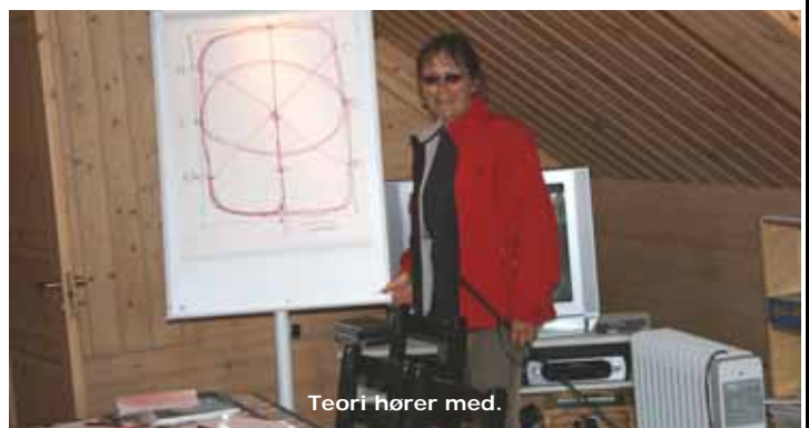
Teori hører med.