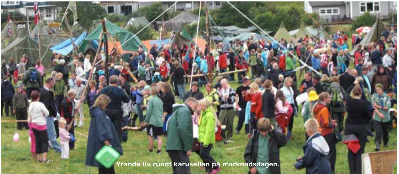
Yrande liv rundt karusellen på marknadsdagen.

Sundag kveld fekk me torever. Har du opplevd 50 mm (5 cm) regn på 10 minuttar? Det gjorde me. Og storm mens byga stod på. Nå legg han heile leiren flat, tenkte dei fleste av oss. Men alle telt og byggverk stod. Ein våt sovepose i jenteteltet var heile skaden. Me hadde visst gjort godt sjøklart, og så låg leirstaden vår på ein morenerygg, så vatnet forsvant like fort som det kom. Ikkje alle var like heldige. Noke av leirområdet var myr, og der var nokre grupper som fekk sorpe.