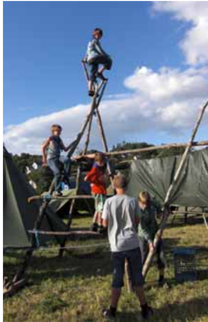
Frå Fitjar 08