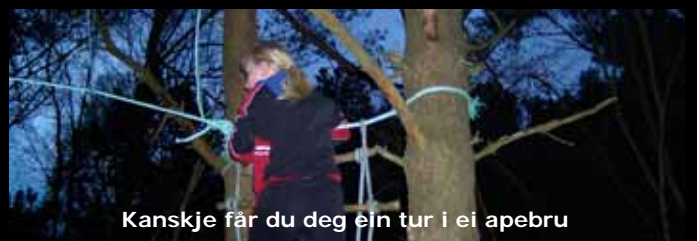
Kanskje får du deg ein tur i ei apebru

Helsing Bokn Idrettslag/Bokn KFUK-KFUM-Speidarar