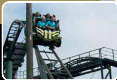
Korpstur s. 8