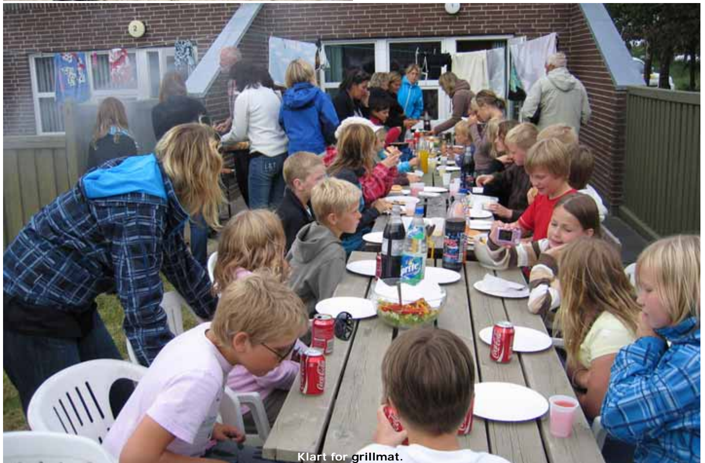
Klart for grillmat.

Paraplyar blei innkjøpte (ikkje laga av Lego!), og etter ein