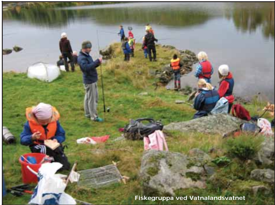
Fiskegruppa ved Vatnalandsvatnet

På kjøkken var det lokal trdisjonsmat som var hovudfokuset, men noko blei også laga med moderne vri. På menyen stod: potetkaker, flatbrød, lappar, pannekaker, lefser, tortilla og pitabrød. I tillegg så nytta med fisken som andre grupper fiska. Me hadde også vårt eige lite røykeri der me røyka aure frå Vatnalandsvatnet. Elevane jobba saman store og små, og dei eldste var veldig flinke til å ta ansvar og til å hjelpa dei små. Me såg også i løpet av desse dagane mange flinke små hender som blei ekspertar