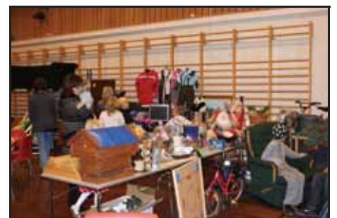
Lopper og atter lopper...