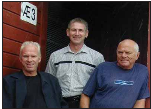
"Duett - 66"