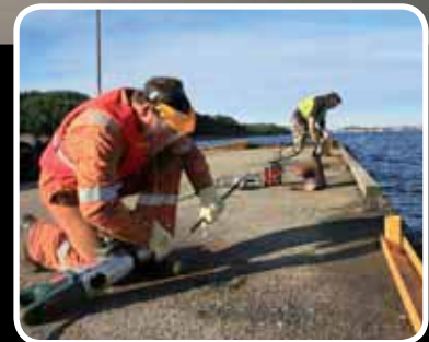
Vedlikehold – s. 11