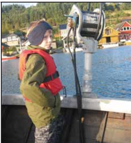
Lurar på om me får noko fisk...

heldt til ved Vatnalandsvatnet. Her blei det sett garn frå dag til dag. Nokre av elevane fikk lov til å bli med på dette. Alle som ville fikk bli med på å reinse garna og sløye fisken. For nokre blei dette første møtet med sløyging. Nokre fikk og bli med på klargjøring av garna til neste garnsetting under instruksjon frå Inge eller grunneigar som og hjalp til. Det blei også sett åleteiner, så den eine dagen fekk elevane oppleve å få sjå levande ål. Elevane hadde med egne fiskestenger og fekk prøve fiskelukka frå land. Elles blei det lagt pinnebrød og glasserte eple på bål, i tillegg til at litt av fisken vi fekk i garnet blei grilla der. Resten av fisken blei sendt til kjøkkenet på skolen for vidare bearbeiding. Området vi var på egna seg godt til leik og ulike aktiviteter, i tillegg var det også ein stor mengde hasseltre i nærleiken så det var populært blant mange å sanke nøtter. Ein annan populær aktivitet var å spikke småbåtar med segl på og prøve desse i vatnet. Vi hadde og satt opp ein lavo på området som fungerte både som ly for regnet, og også som kose/lekeplass for elevane.