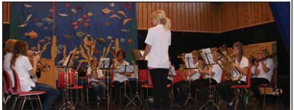
Bokn skulekorps opnar auksjonen 2009