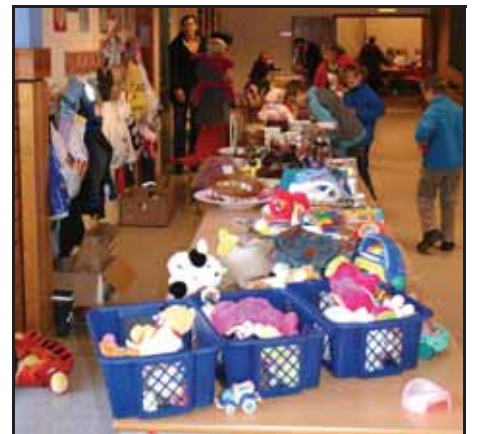
Mange freistande lopper