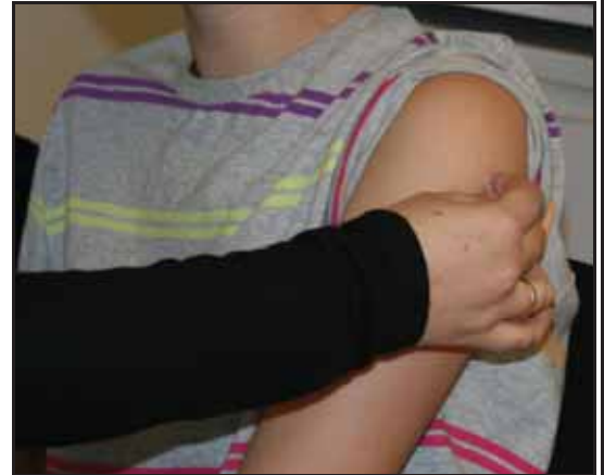
Litt vask før sprøyta skal settas

Han seier vidare at helsetenesta forhold seg til dei sentrale helse-