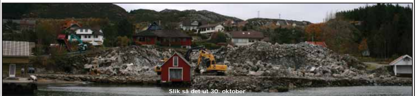
Slik så det ut 30. oktober

Prisane varierer frå kr. 800.000 - 950.000 + tilknytingsavgift, og tildeling vil skje etter "fyrst til mølla"-prinsippet, avsluttar Ole Johnny Hauge.