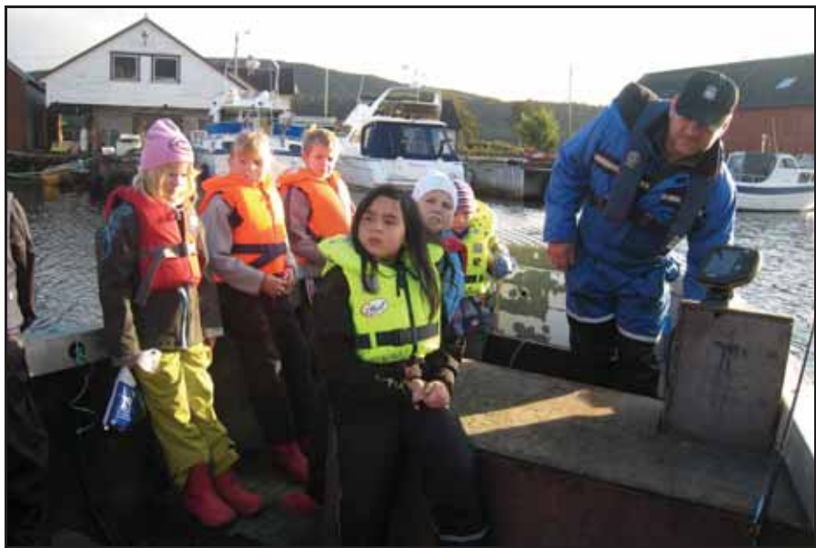
Spente ungar ut på fisketur

De kan også bruke denne nettadressa: http://boknskule.no/index.php?pageID=175&page=kystkultur_2009