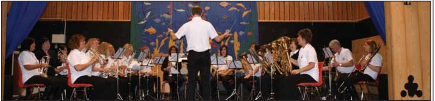
Bokn Brass / Rustne Horn gav full trøkk

Loppesalet starta kl. 11.00, og allereie då var det bra med folk som hadde møtt opp.