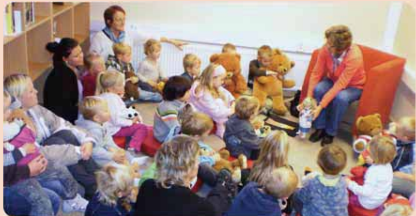
"Gullhår og dei tre bjørnane".