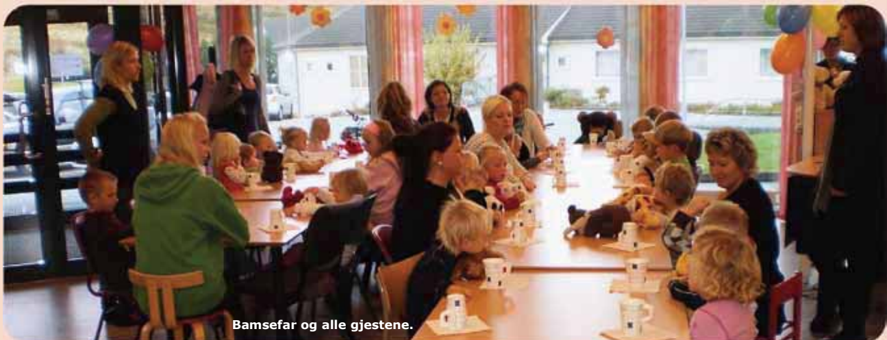
Bamsefar og alle gjestene.

Bamse var særns nøgd med feiringa, brum, brum!