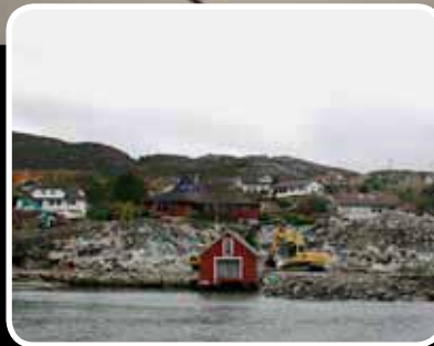
Full fart – s. 10