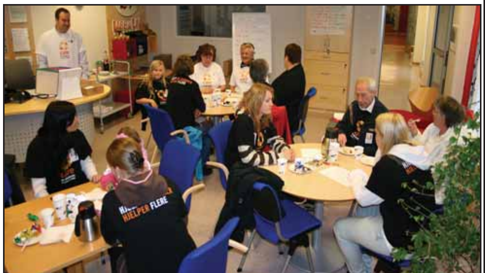
Mykje folk og god stemning utover ettermiddagen.