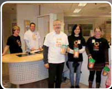
Rekord – s. 4