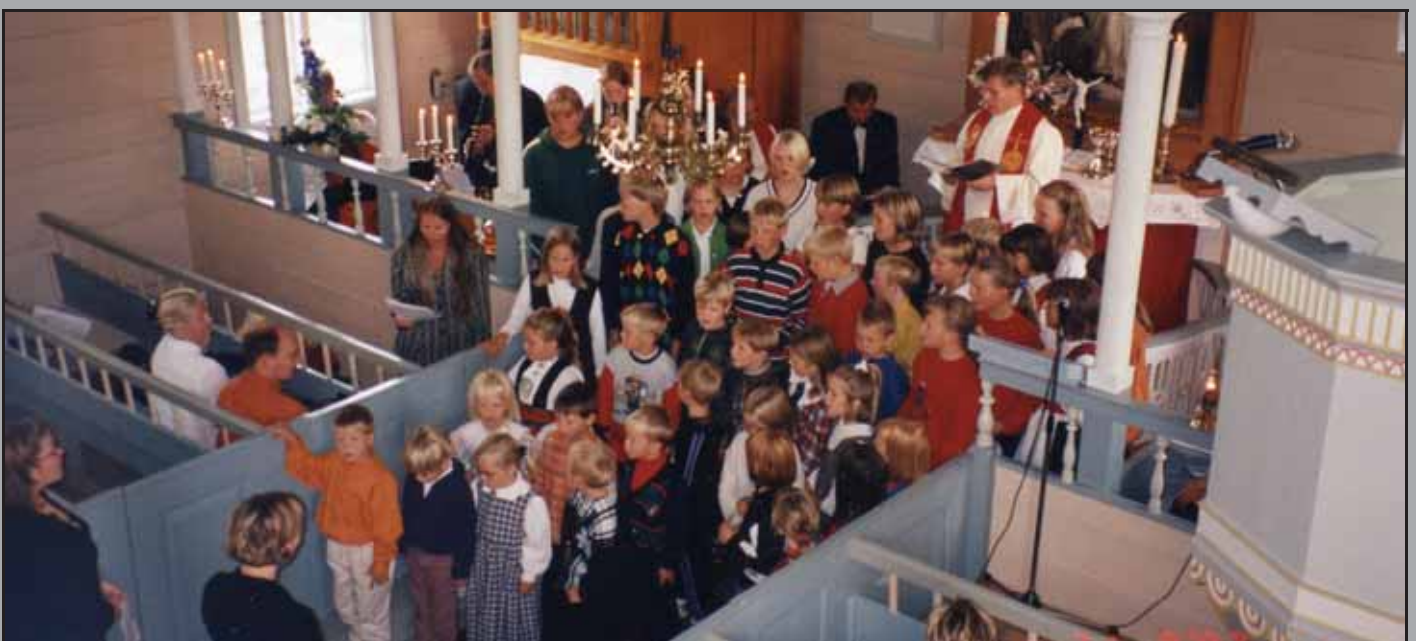
Her blir jubileumssalmen ledsaga av skulekor, Fylkesmusikarane, blokkfløyter og kyrkjeorgel under jubileumsgudstenesta 21. sept. 1997.