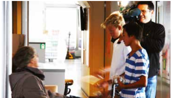
- Hei! Kjekt å sjå deg!

Ungdommane sine eigne refleksjonar rundt arrangementet var at det var noko som gjorde noko med dei. Mange grudde seg litt i forkant, men vart positivt overraska over både eige mot og over måten dei vart tatt imot på, av ferjepassasjerane. Samtlege trailesjåførar fløyta med bilhornet då dei køyrde av ferja i Arsvågen; det var livleg både om bord og på kaien den aktuelle dagen.