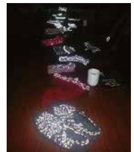
Ungdommane sine unike refleksprodukt.

I forkant av arrangementet om bord på ferjene hadde ungdommane frå 7. klasse – 10. klasse hatt moglegheit til å delta i ein reflekskonkurranse der ein vart invitert til å lage sitt