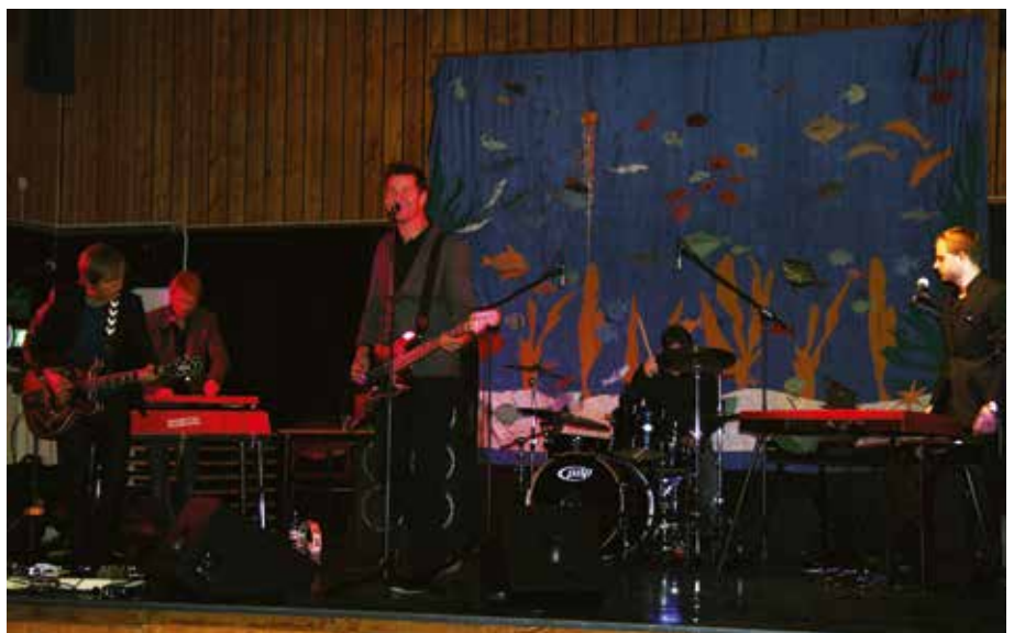
FordRekord fekk fyr i boknapublikummet med sin Kaizers-prega musikk.