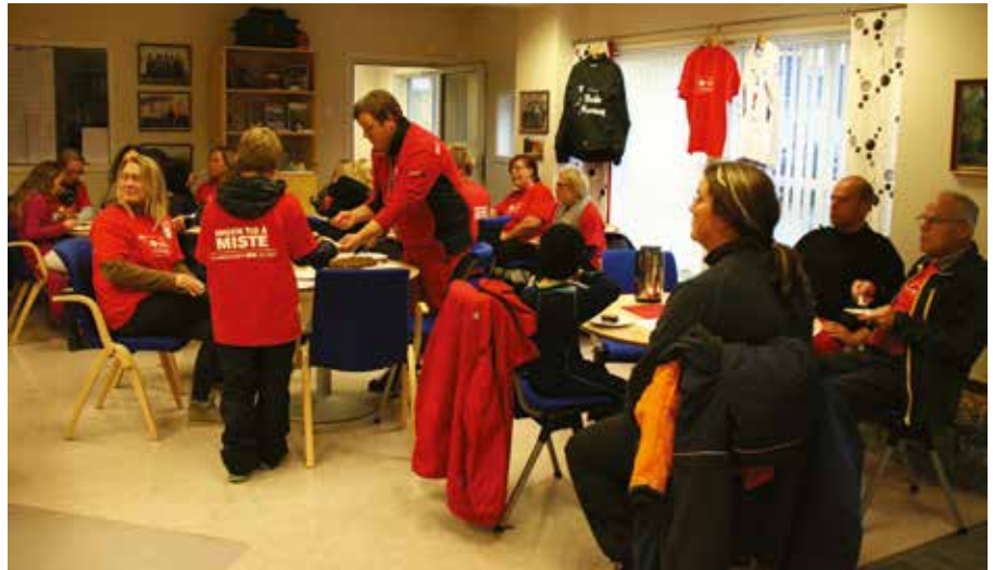
GOD OG SPENT STEMNING: Mellom 30 og 40 store og små bøsseberarar var innom banken/servicetorget på aksjonskvelden.