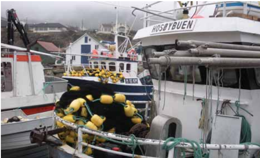
Nota klar for kveldens og nattens fangst.

- Bokn ligger midt i leia og er sentrum for alt sildafisket akkurat nå, kunne Jarle Onarheim, eier av Floni fra Bømlo fortelle.