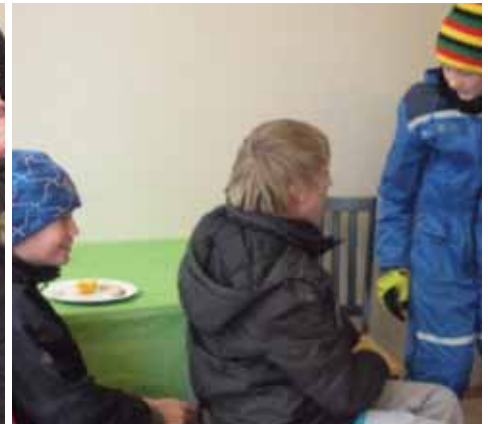
Noen av kundene på åpningsdagen 24. mars.