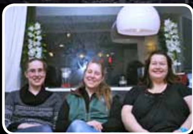
Internasjonalt – s. 12