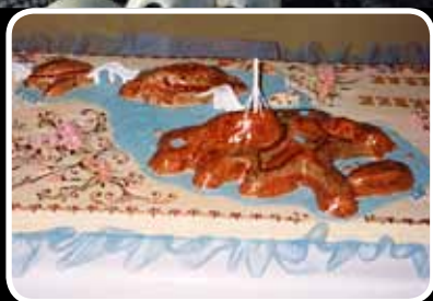
Jubileum – s. 9