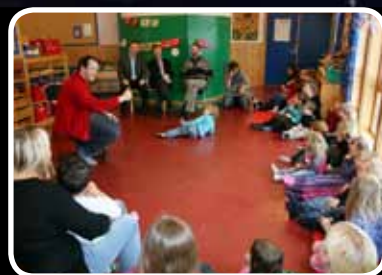
Språkbesøk – s. 18