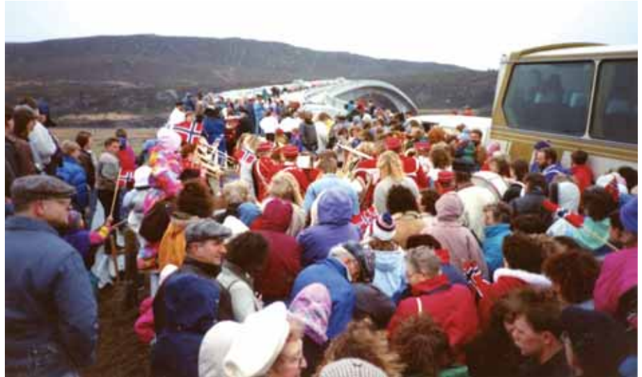
Mange hundre menneske hadde stilt opp då Boknasundbrua blei opna 22. februar 1991.