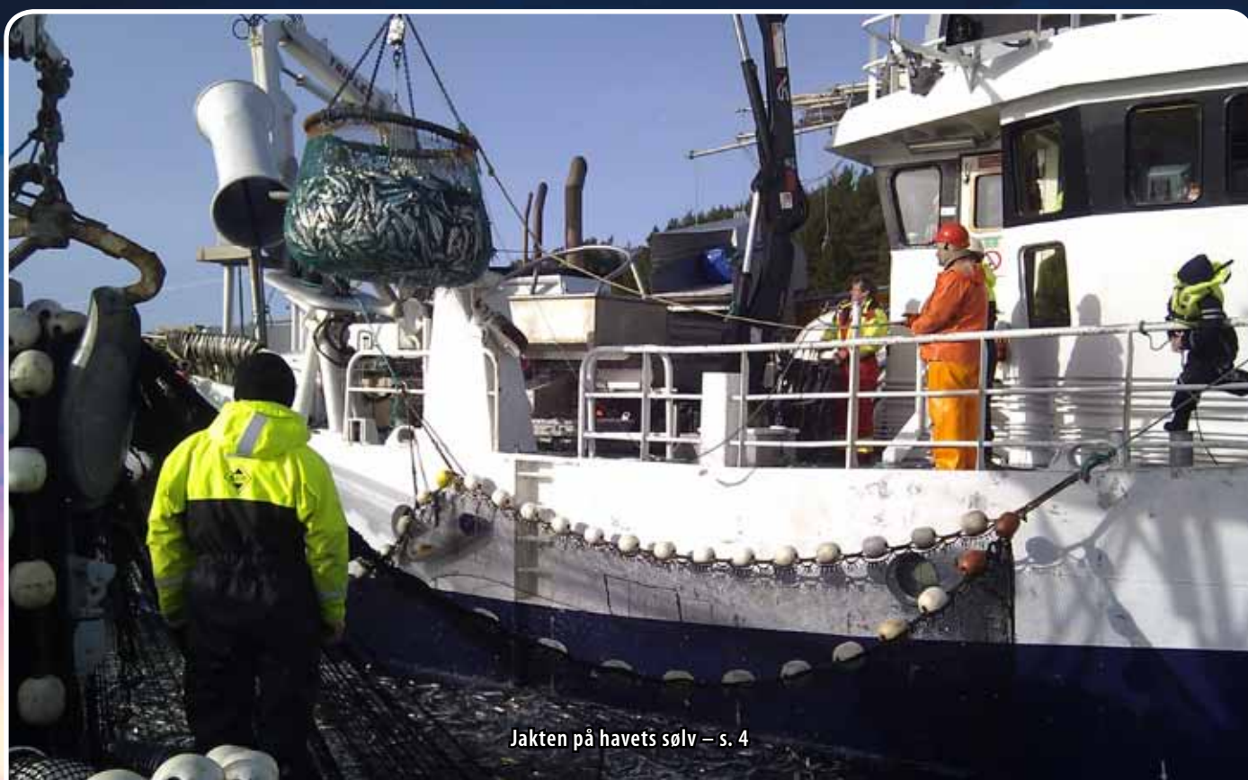
Jakten på havets sølv – s. 4