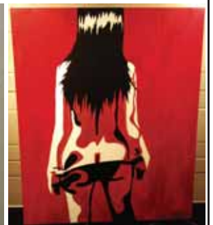
Watch me tease