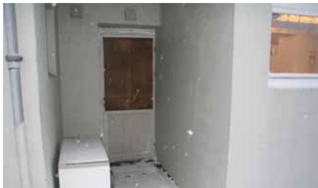
Gjerningspersonen tok seg inn gjennom kjøkkendøra i første etasje.

Bokn bedehus har fått nytt utstyr på plass.