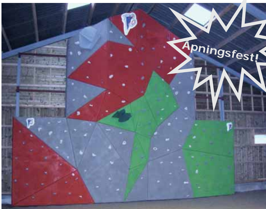
Klatreveggen inne i aktivitetshallen.

Fri adgang - begrenset mulighet for parkering - kom gjerne på sykkel!