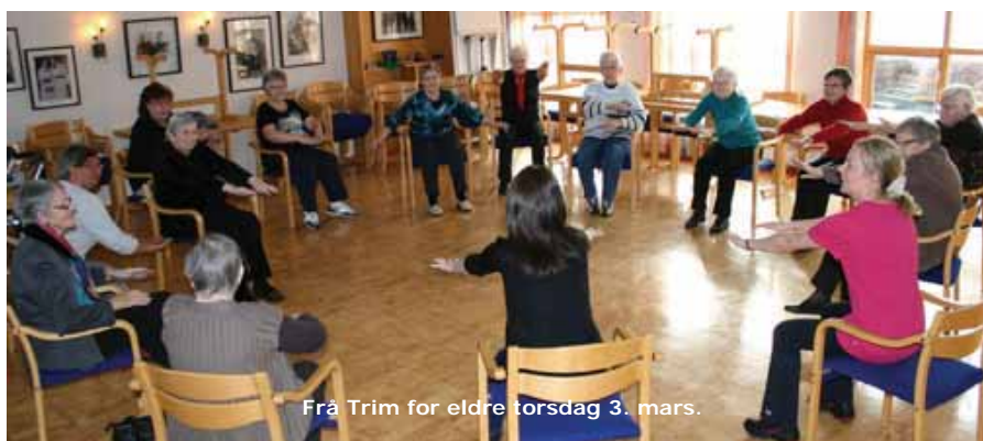
Frå Trim for eldre torsdag 3. mars.

På veg ut av lokalet kommenterte fleire av dei fram-møtte at eit trimtilbod som dette,