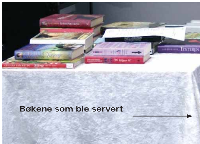
Bøkene som ble servert