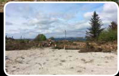
Kunstgrasbane – s. 12