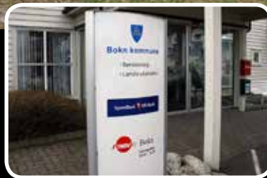
SR-Bank legg ned – s. 5