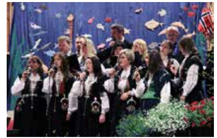
Boknakoret skal synga på jubileumsfesten om kvelden.

Om ikkje dette var nok så blir det altså show med "Han Innante" og dans (15 år) til slutt. Det blir lokale "The Kvednabekkjers" som spelar opp til dans. Komiteen prøvde også å få til innslag med medlemmar frå dei tidlegare banda "Felix" og "Rapido",