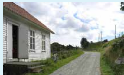
Bokn bygdemuseum vil ha sommarope 29. juni - 10. august.

Det vil seinare også koma oppslag om turen, pluss oppslag om ope bygdamuseum.