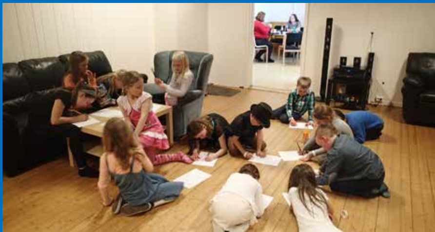
Teiknekonkurranse med tema påskekylling.

Invitasjonar vart sende ut til dei ulike klassane ei veke før på måndagen. Foreldre kunne komme gratis om dei ville følgje med borna 😊 På fredagen for 1. - 4. klasse vart det stort oppmøte! Totalt 28 born kom denne kvelden.