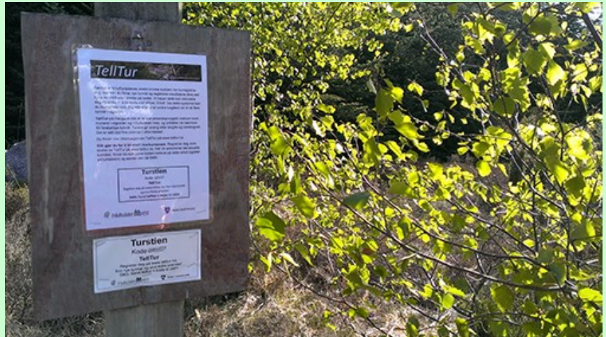
På bildet er koden utstroken, men du finn han på Turstien - ved krysset med traktorvegen.

Forutan å finna turmål og registrera resultatane dine på www.telltur.no , kan du konkurrera med deg sjølv eller med andre turgåarar om å nå fleire mål. Klikk «Velg turmål»/«Finn turmål» og klikk deg fram til ditt område for å sjå kva for nokre turmål som finst og bli med på tur!