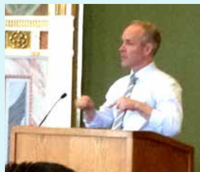
Statsråd Jan Tore Sanner hadde invitertert formannskapa på Haugalandet til rådhuset i Haugesund den 7. april.

Bokn kommune har gjennom fleire år fått tilskot frå staten til kommunalt næringsfond. Sidan 2008 har kommunen fått kr. 2.125.000 til næringsfondet. Frå 2014 var det slutt på desse