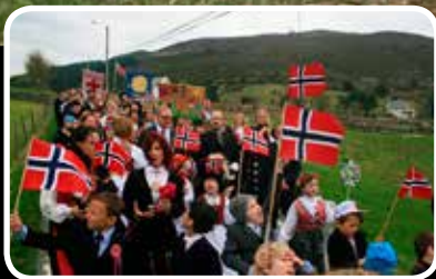
Storstilt feiring – s. 3