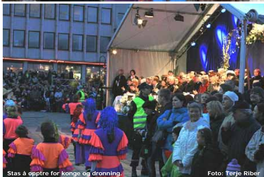
Stas å opptre for konge og dronning.