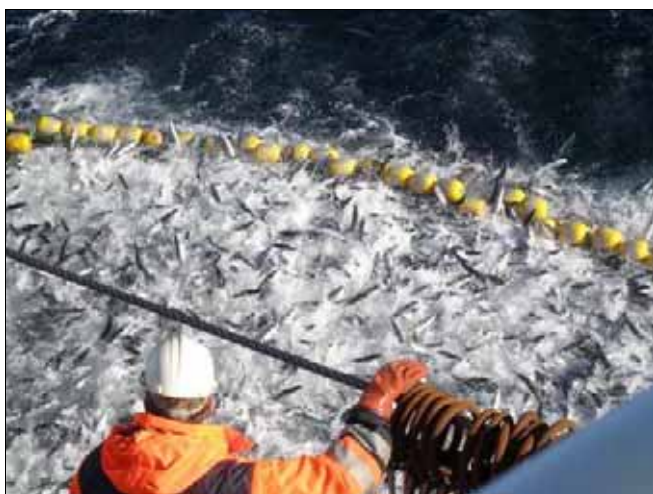
380 tonn makrell den 28. september.

Me fekk oss 220 tonn før kulingen kom og då var det berre å leggja seg å bakka på og håpa på spakning snart. Spakning blei det, men barre kortvarig, og det blei ikkje meir fangst på oss denne gongen. Me sette kursen på Eigersund for levering og heller ikkje brislingen blei ein "sukcess" i år, men papen kom seg nå heim te jul litt ut i desember.