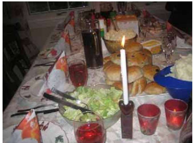
Klart til pølsestesting med tilbehør.

Vågshaug i Føresvik. Han har god erfaring i å røyke fisk, og var velvillig til å hjelpe med disse mengdene som ble større enn planlagt. Røykingen tok sin tid, men resultatet ble veldig bra etter tilbakemelding vi har fått like fra Tromsø.