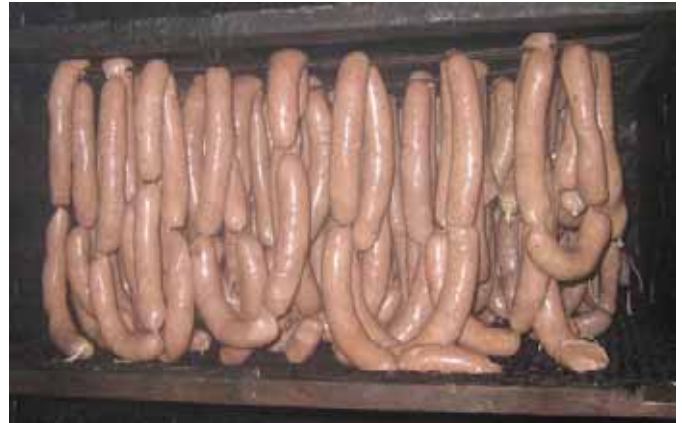
Pølser klar til røyking hos Jacob Vågshaug 22.11.07

Resultatet ble fire kasser levert til røykeriet hos Jacob