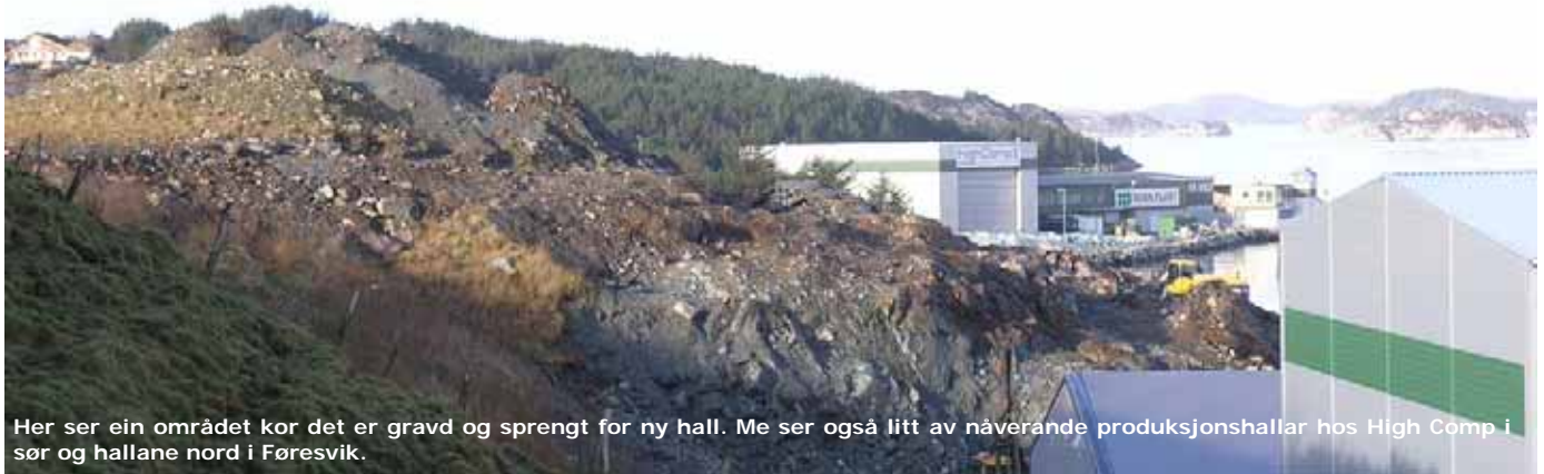
Her ser ein området kor det er gravd og sprengt for ny hall. Me ser også litt av nåverande produksjonshallar hos High Comp i sør og hallane nord i Føresvik.

Bedriftene har for tida ein god posisjon både når det gjeld tankproduksjon og produkt til offshoremarknaden. Det er gode oljeprisar som gir høg aktivitet. Fornybar energi-