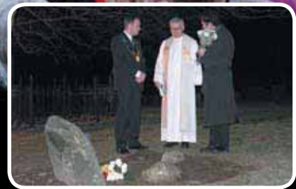
Minnestein for bortkomne på havet Les meir s. 15