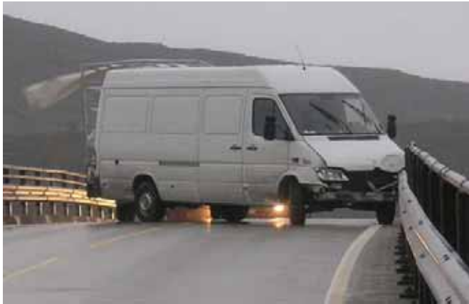
Bil og hengar kilte seg fast.

Uhellet skjedde kl. 9.15. Varebilten fekk sleng og tilhengaren velta og kilte seg fast. Det vanskelege redningsarbeidet med å få alt fjerna pågjekk til kl. 11.30.