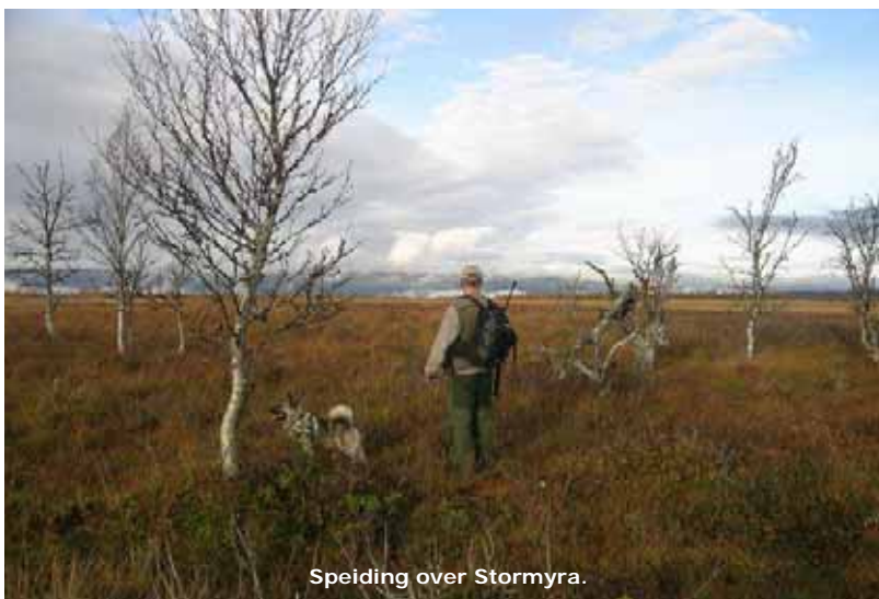
Speiding over Stormyra.

Etter en liten time meldte hundefører over jaktradioen om ferske spor og spenningen steg på postene når meldingen gikk ut på at det kanskje var storelgen de hadde foran seg. Likevel gikk det timer gikk uten at elgen eksponerte seg på noen av postene, men hundene hadde fortsatt ferske spor