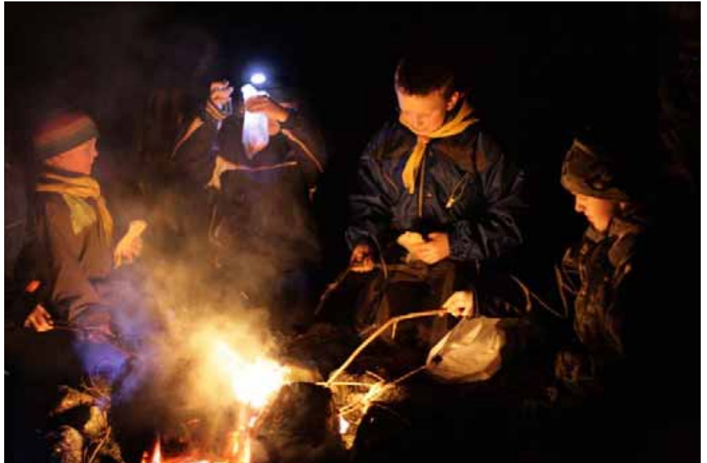
Speidarguttar koser seg rundt bålet.

I skogen var det hengt opp ulike ting som ikke hørte til der. Tolv ting skulle huskes og i tillegg tre forskjellige dyrelåter som en hørte. To av lederne skulle så høre de forskjellige