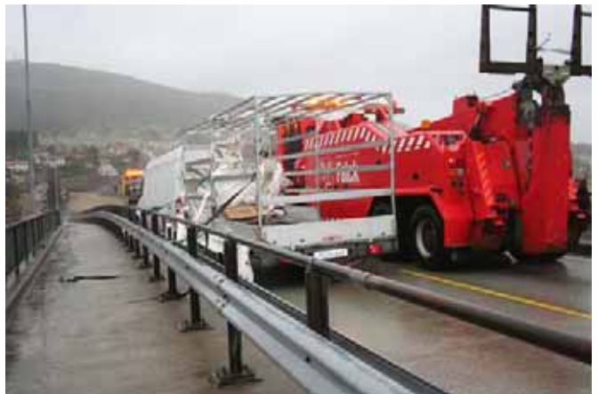
Redningsfolka frakta bilen og hengaren til Vestre Bokn med Falken sin redningsbil som vindskjul, slik at hengaren ikkje bles på sjøen.