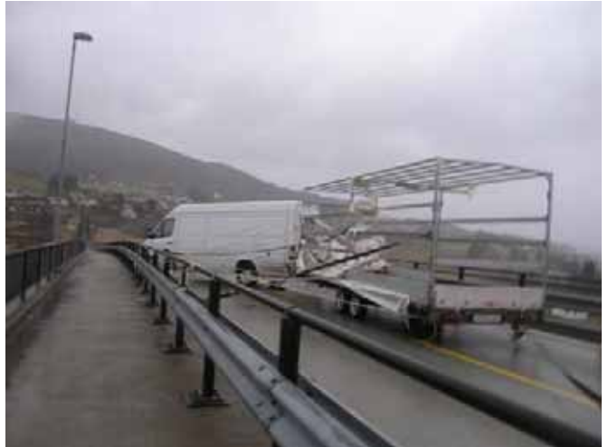
Kapellhengaren var skikkeleg "mat" for stormen. Her er hengaren sikra med reimar og tau.