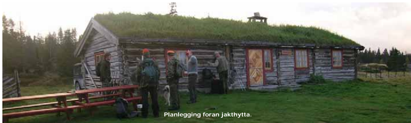
Planlegging foran jakthytta.

melder over radioen at drevet er i gang. Det meldes snart over jaktradioen om ferske spor, kanskje 4-5 elger i flokk. Alle sanser skjerpes hos vestlandsjegerne. Sporene følges i flere timer, men fjellelgen lurte både jegere og hunder denne dagen.