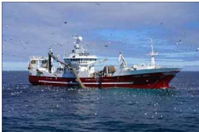
Her pompar me nordsjøsild utanfor Peterhead.

Det blir lange dagar på feltet når ein ikkje finn noko å kaste på, og då har me god tid til å sjå på fjernsyn eller som meg å lesa ei god bok eller to. Den siste eg las var ei bok av Jan Guillou som heiter "Madam terror", der hans berømte superagent Carl Hammlton og palestinske Mouna Hussein (Madam terror) var på oppdrag med den palestinske flåten sin første båt, u- båten "U- 1 Jerusalem". Denne boka var så spanande at eg anbefalar den sterkt.