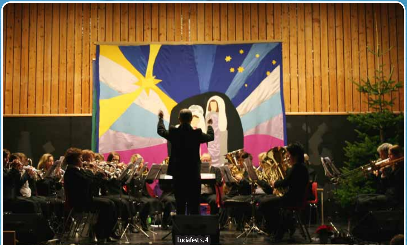
Luciafest s. 4