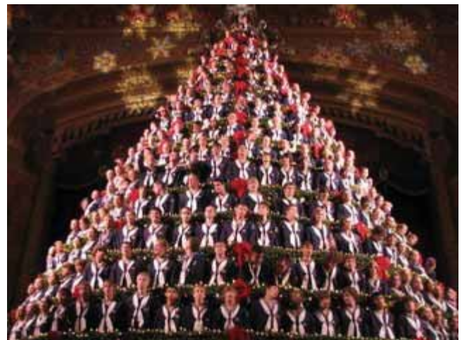
Singing christmas tree.

er desidert ikke bare en myte. En mulig grunn til det her i Michigan kan være at bakken har vært dekket med snø siden november og alt ser ut til at det blir en hvit jul i år, noe som i alle fall får meg i julestemning.