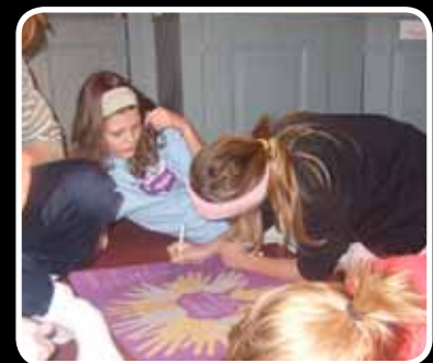
LysVåken s. 14