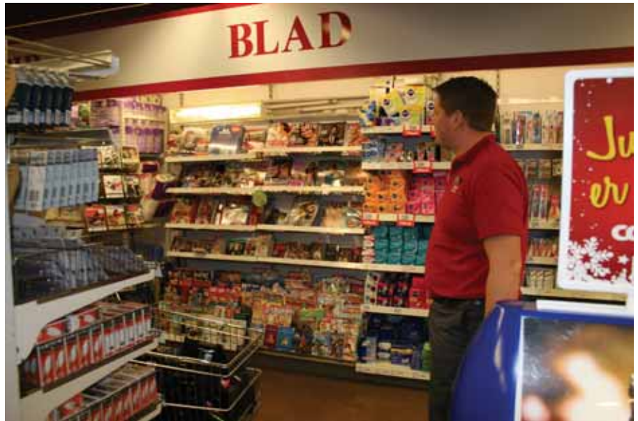
Her kjem kald drikke i nye kjølereolar.

Det første som møter ein i ny butikk er starten av handlerunden i motsatt ende. Her har ein kaffikrok og tipping.