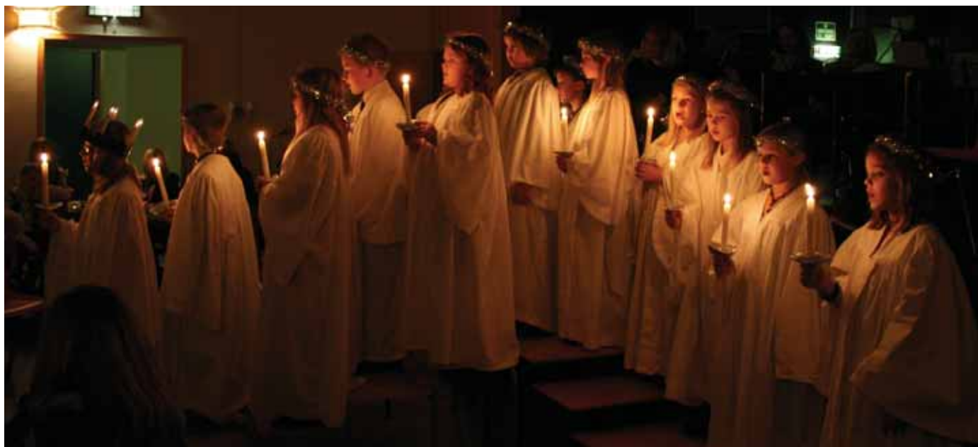
Stemningsfullt og vakker klang.

Det summa i salen før det heile kom i gong, og som vanleg var det 4. klasse i luciatog som leia an i festen. Ei vakker rekke, stor som klassa er, lyste opp den mørklagte gymsalen. Til korpstonar og barnestemmer kom godfrysningane fram på armar og rygg.