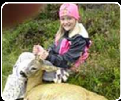
Haustjakt s. 2