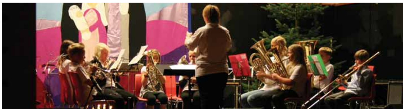
Unge håpefull blæs jula inn.