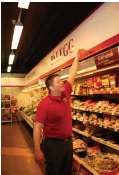
Høgde gir betre plass.