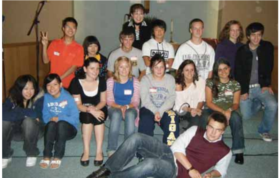
Gruppen av utvekslingselever.

Jeg liker den amerikanske skolen veldig godt, og alt er virkelig som man ser på film med amerikansk fotball, cheerleadere, kantinen og miljøet generelt, men jeg har i tillegg hatt opple-