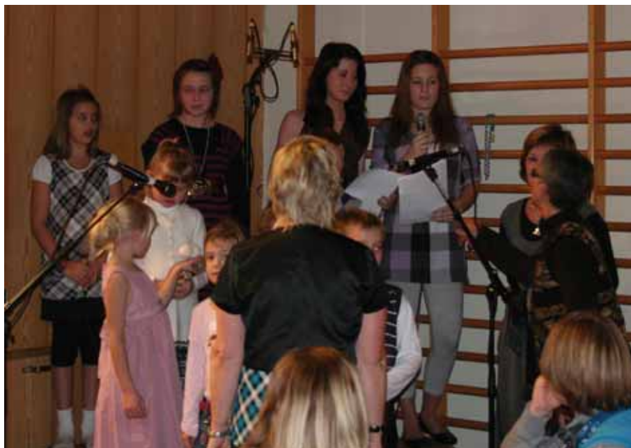
Korsong til 5.000 kr.

Venevil kom med fløyta og historiar før ein fekk servert lett mat og drikke. Her