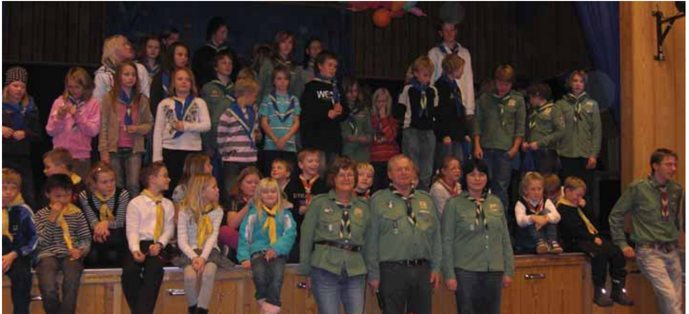
Med nye skjerf på, var det å stille opp til fotografering.