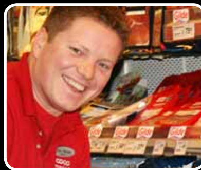
Ansiktsløfting s. 6