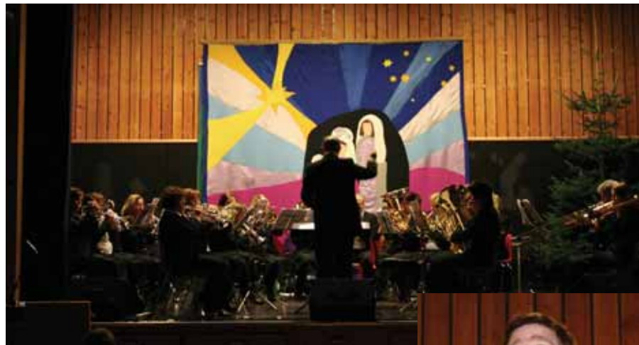
Bokn brass og Rustne horn hadde brukt pussekluten flittig.