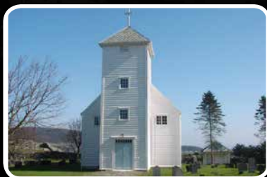
Universell utforming – s. 10