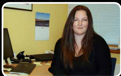
Ny seksjonssjef – s. 3