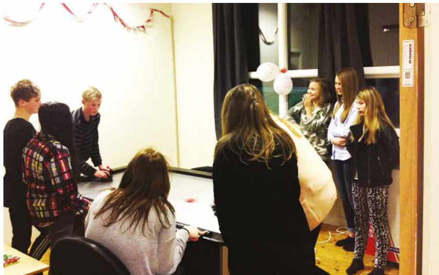
Air Hockey-turnering med mange ungdommar rundt.