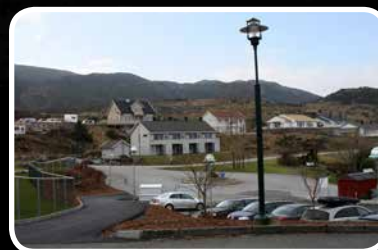
God byggeaktivitet – s. 12