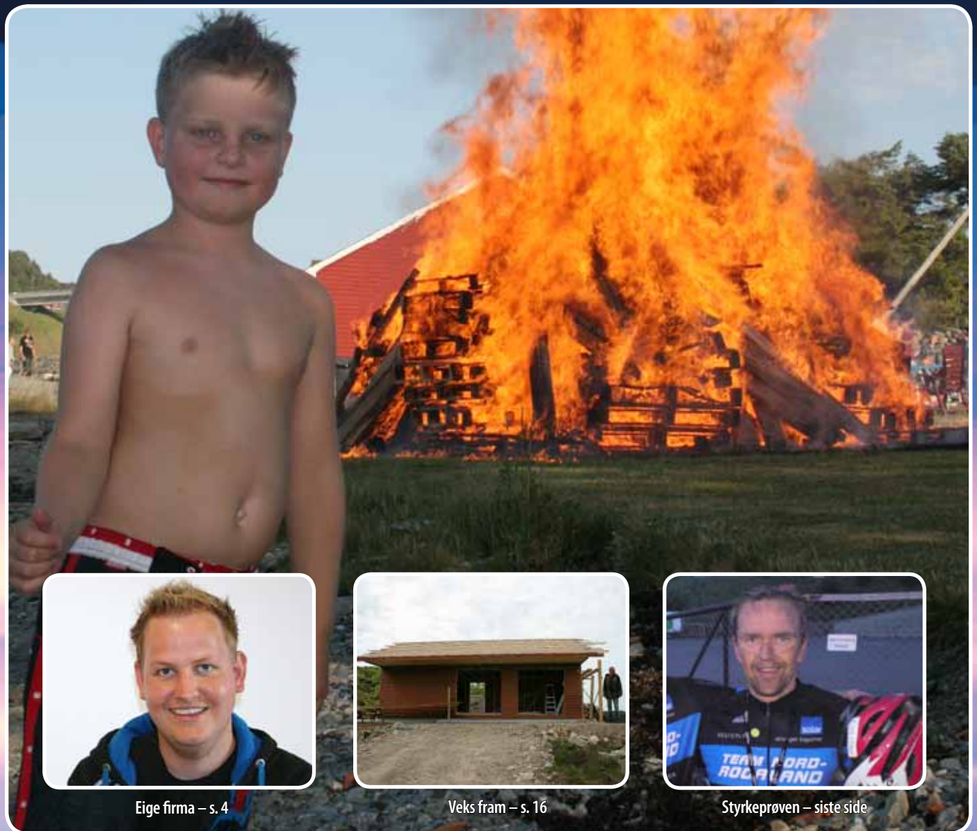
Eige firma – s. 4