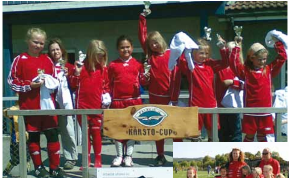
Laget får velfortent pokal og T-skjorte.