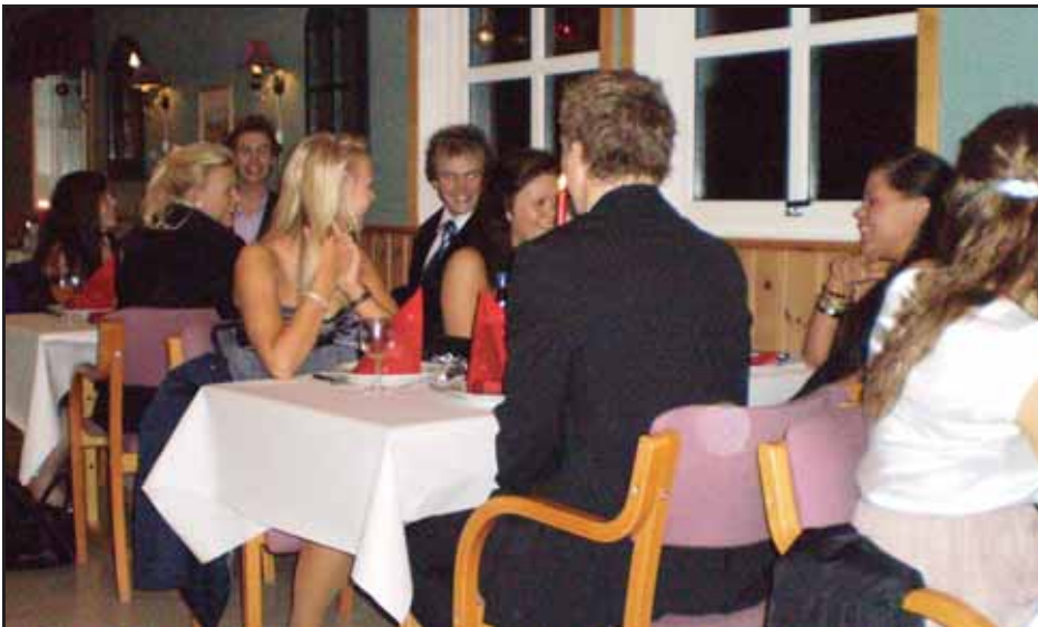
Nokre av dei "eldste" gjestane

Eg hadde mange planar med julemiddagen til ungdommane i år, men ikkje alt blei slik eg hadde tenkt, og slik er det. Men middag blei det!