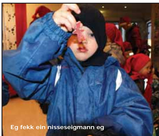
Eg fekk ein nisseseigmann eg

I år var det noko surt ute, så det var nok kjekt å få komme inn å ete litt snop.