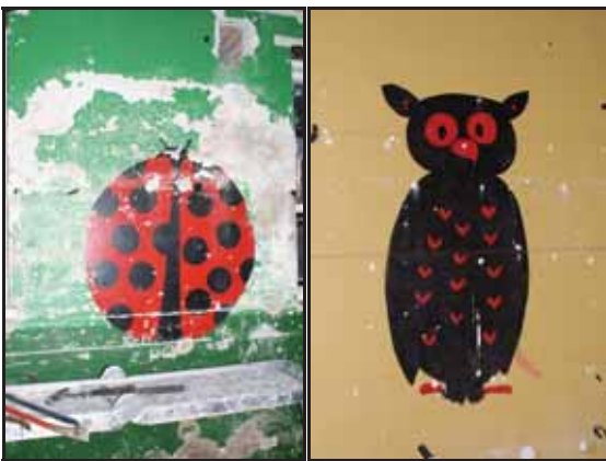
Gamle minner kom og fram. Det hadde vore kjekt å fått visst kven som har malt desse

Det er ikkje godt å seie kva tid det står ferdig, men den som ventar på noko kjekt, ventar ikkje forgjeves.