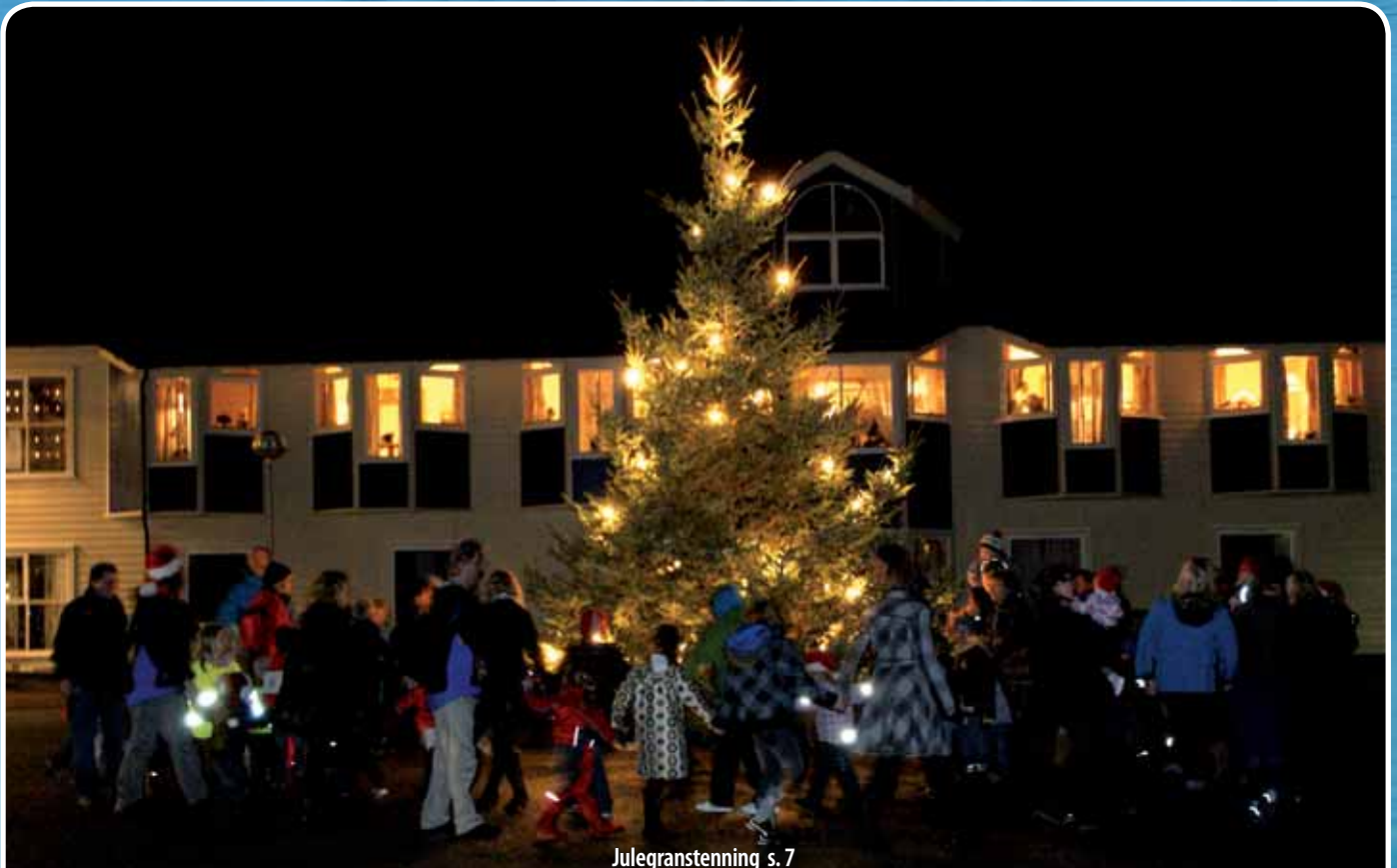
Julegranstening s. 7