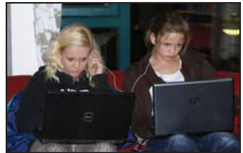
Musikk til arbeidet...

Me håpar det likevel kan la seg gjere, om det blir aktuelt å arrangere ein spelekveld til.