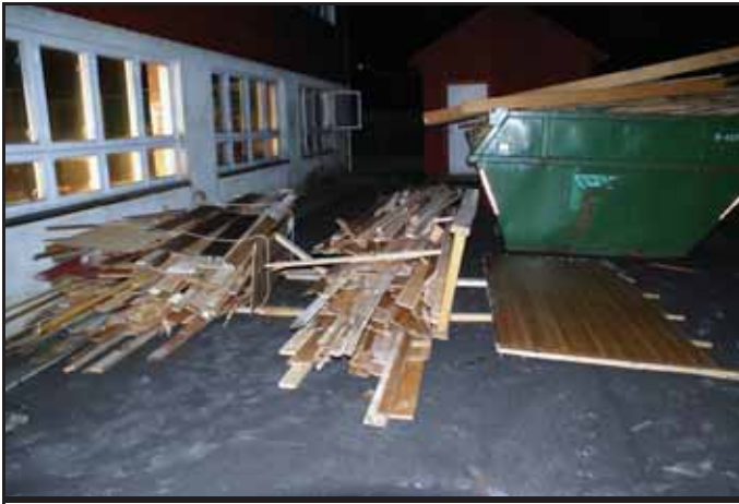
Containerane blei godt fylt opp

26. oktober starta jobben med å rive nede i kjellaren på Kyrkjebygd, også kjend som Petralokala eller Diskoteket.