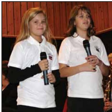
To spente jenter!

pausen, og brus og kaffi med. I pausen var det og ein konkurranse, og premien var ein pose twist.