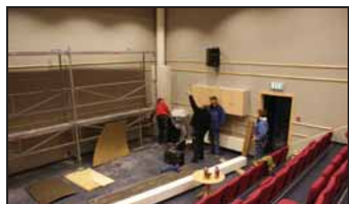
Mykje planlegging på førehand

Fredag 11. desember er det kino, og då vil det være fyste gong det blir vist film på det nye lerretet. Med von om ei flott framsyning!