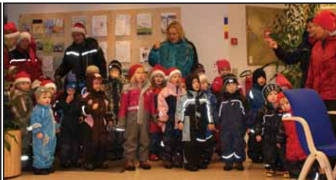
Bilde til venstre: "Så går vi rundt om ein..." Midten: Julenisseservicetorg Gro Bilde til høgre: "På loven sitter nissen..."

Dette er ein koseleg tradisjon som Bokn barnehage har kvar jul. Ungane og dei vaksne går frå barnehagen og ned til juletreet som står i tunet på Bokn. Der syng dei julesongar og går rundt treet. Syngjande høgt og flott på songen "På låven sitter