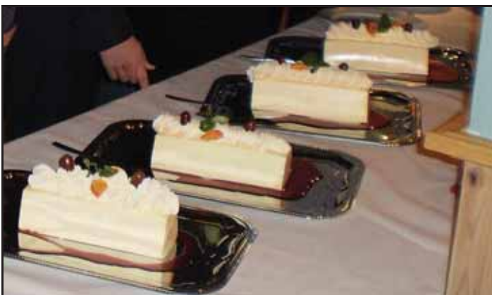
Sitronfromasj med bringebærsauss til dessert

Elisabet Taraldlien Barne- og ungdomsarbeidar