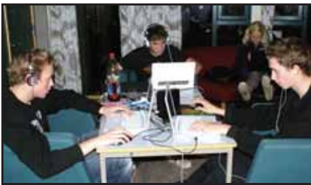
Høyretelefonar er eit "must"

Ungdommane skulle ta med seg, viss dei hadde, sin eigen pc. Eg tok med