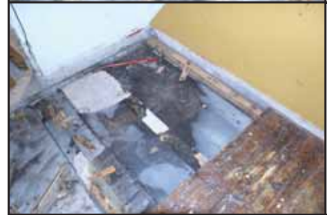
Det gjorde godt å få dette vekk

skvatt opp som stikker, og eg hadde nok med å bere dei ut og opp i containeren.