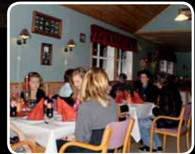
Julemiddag – s. 16