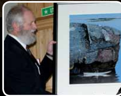
Kulturpris – s. 14