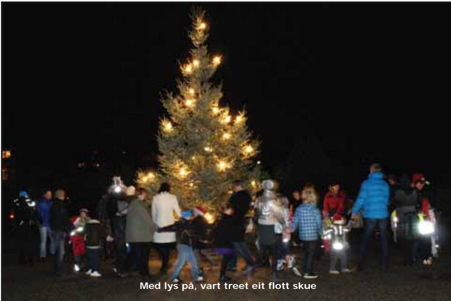
Med lys på, vart treet eit flott skue

Det er ein kjekk tradisjon å starte desembermånaden med julegrantenning på tunet framfor Boknatun, kommunehuset vårt.