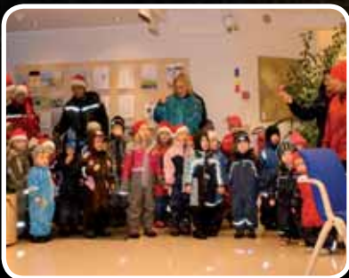
Nissemarsj – s. 6