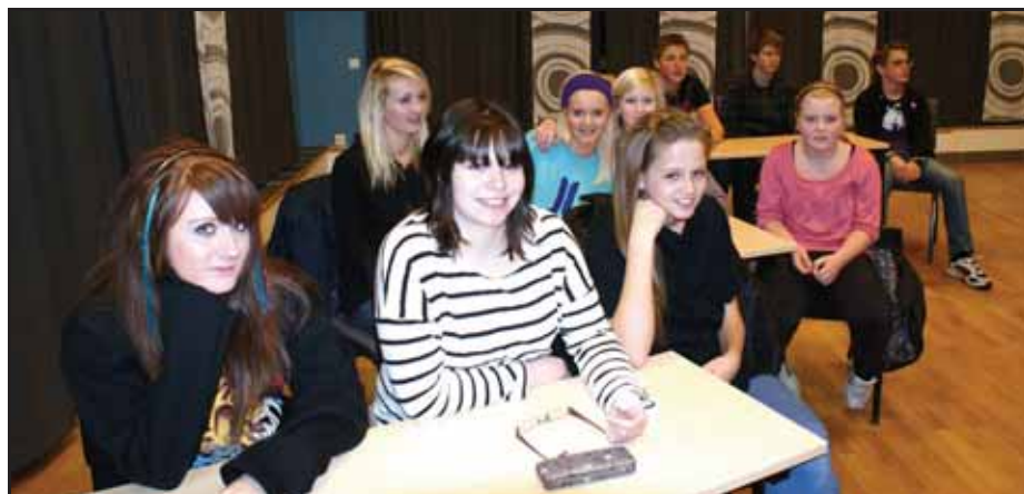
Frå fyste kurskvelden, her på Hemningstad kulturhus

Kanskje nokon leverer filmen sin til filmkonkurransen "Filmfokus" i Haugesund? Det blir spennande å fylgje med ungdommane.