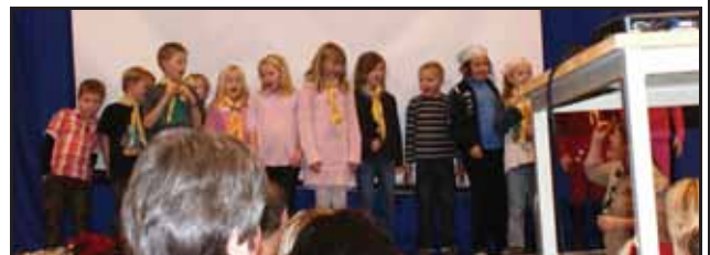
Oppdagarane på scenen