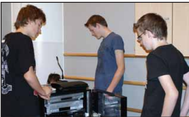
Det vart ikkje PlayStation...

Spilldag 09 er et samarbeid mellom ABM-utvikling, Stavanger bibliotek, Norges informasjonsteknologiske høyskole og Drammensbiblioteket.