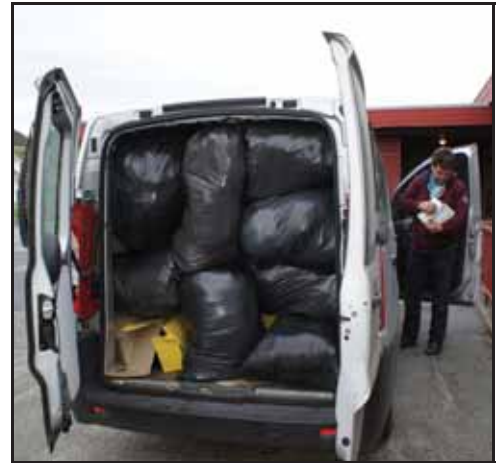
Det blei full bil!