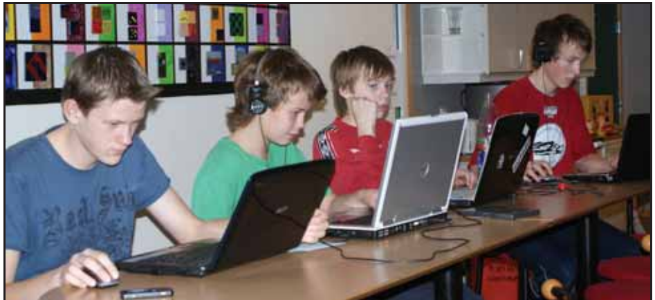
Full konsentrasjon med pc'ane

Me blei samde om ein dato som passa begge partar, og sette i gong planlegging. Plakatar vart laga nasjonalt, så me tilpassa dei vårt arrangement. Når ungane såg kva som skulle skje, vart dei i fyr og flamme!