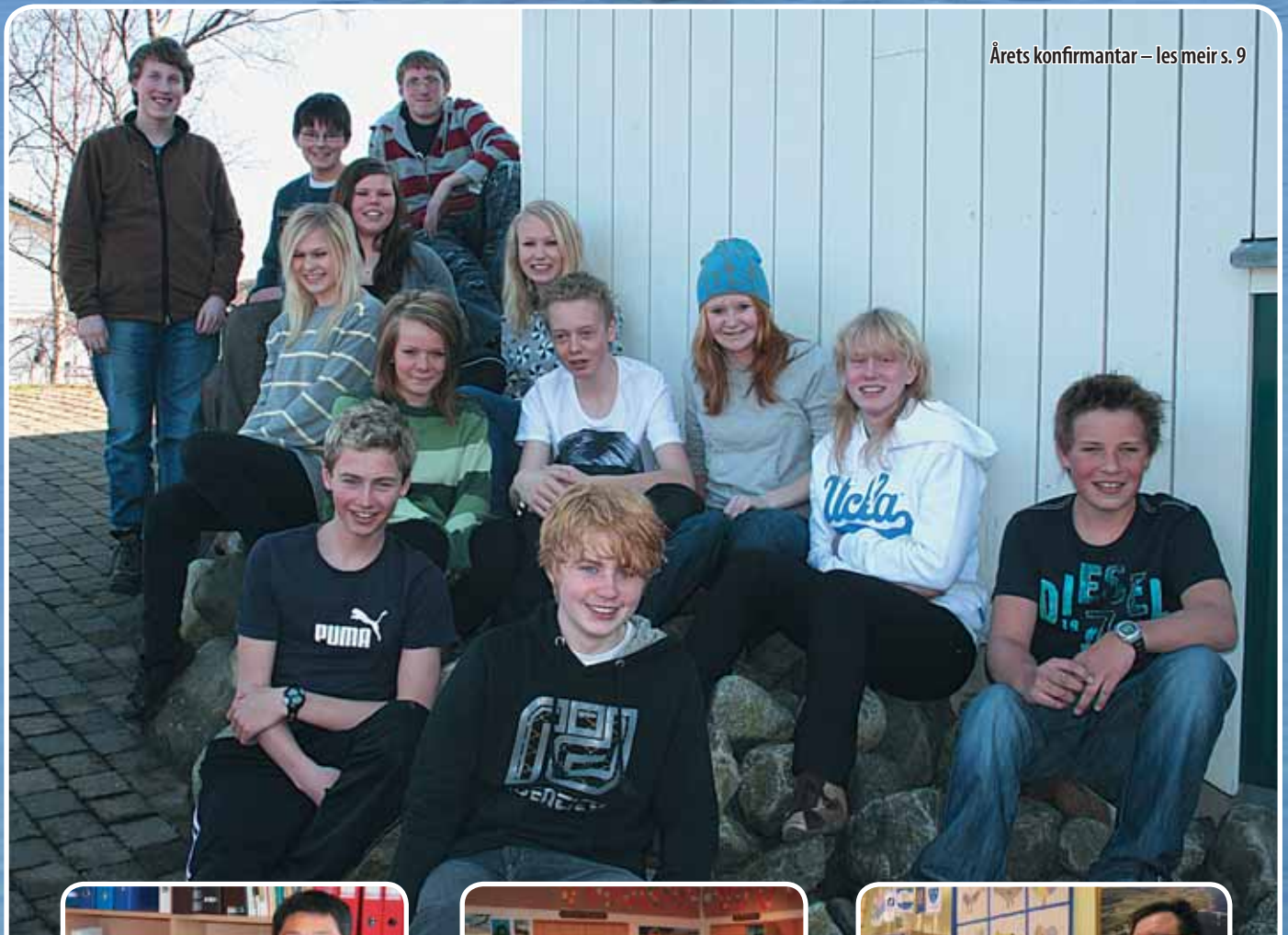
Årets konfirmanter – les meir s. 9