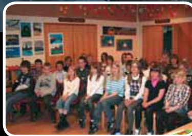
Bokormen avslutta - les meir s. 4