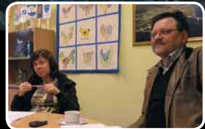
Kultursoge – les meir s. 5