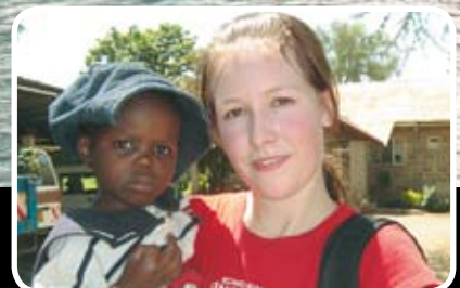
Studietur til Kenya Les meir s. 14