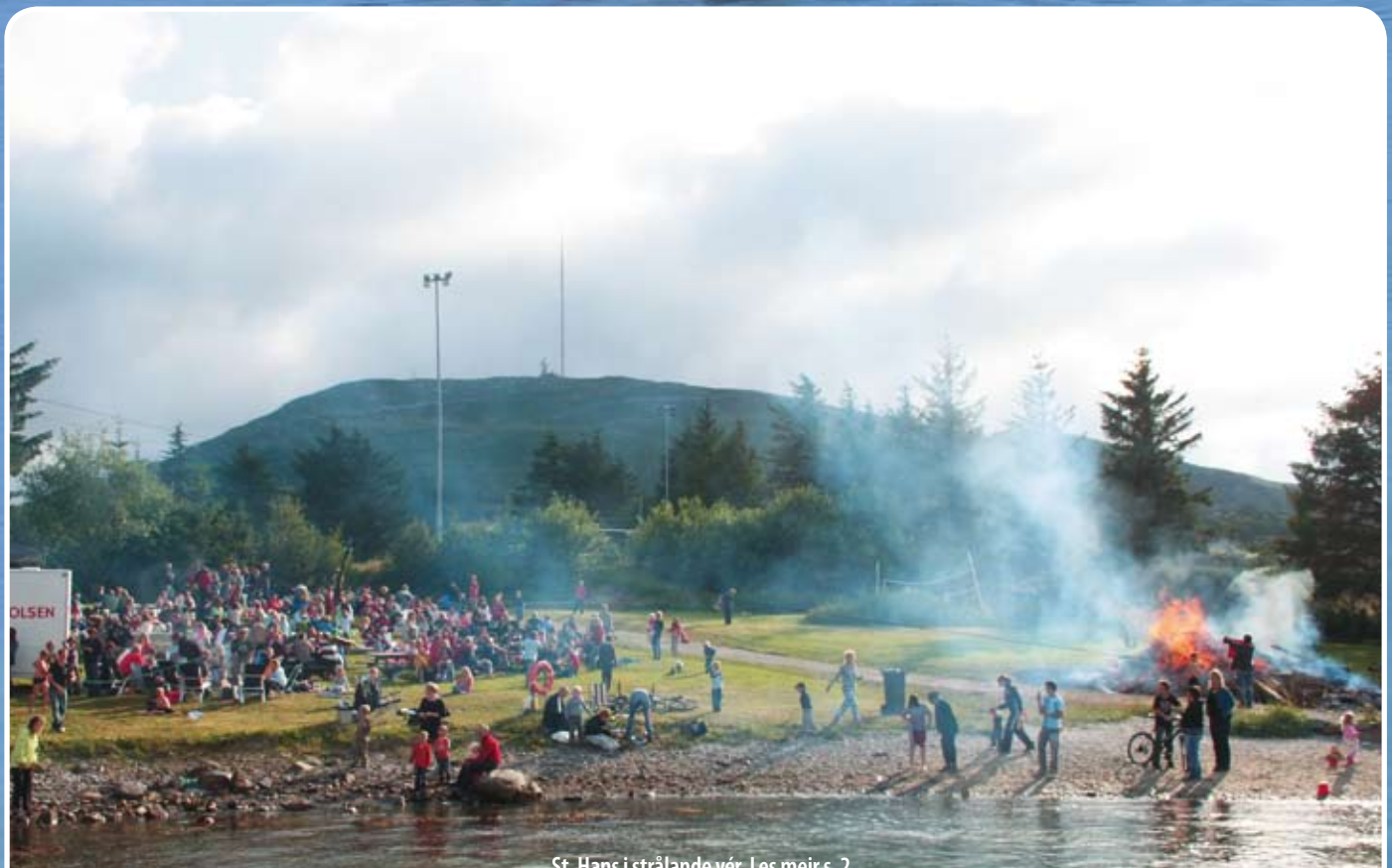
St. Hans i strålende vær. Les meir s. 2