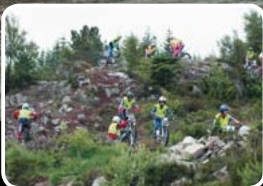
Sjelden kost, gule maur i Knarholmen under KM i triatl 23. juni Les meir s. 4