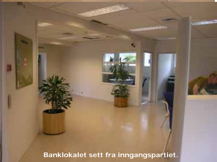
Banklokalet sett fra inngangspartiet.