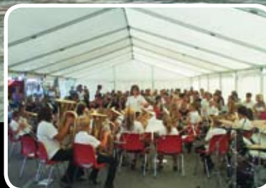
Strålende øyastemne Les meir s. 12