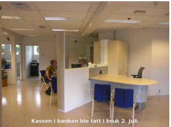
Kassen i banken ble tatt i bruk 2. juli.