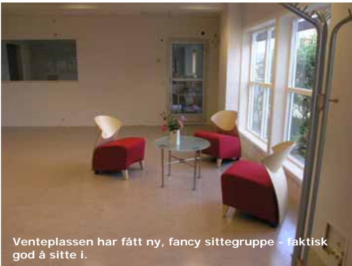
Venteplassen har fått ny, fancy sittegruppe - faktisk god å sitte i.