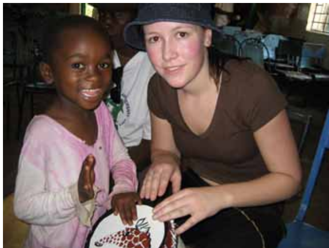
I Pokot overnattet vi hos lokalfolk som bodde nesten helt oppe på toppen av fjellet Mt Kôh.

Her fikk jeg smake det beste måltidet i løpet av hele turen. De laget en helt fantastisk mat, selv om vi måtte se at hanen ble slaktet for oss. Målet var å komme opp på toppen grytidlig neste morgen, for å se soloppgangen. De som hadde sett den før, sa at den var så utrolig flott. Skuffelsen var stor da det viste seg å være overskyet. Så der var vi, 3.200 moh, og det var kaldt. Vi sto med stillongs, shorts, fleece og luer. Så vi var vel der oppe ca. 30 min, før vi begynte på turen nedover igjen.