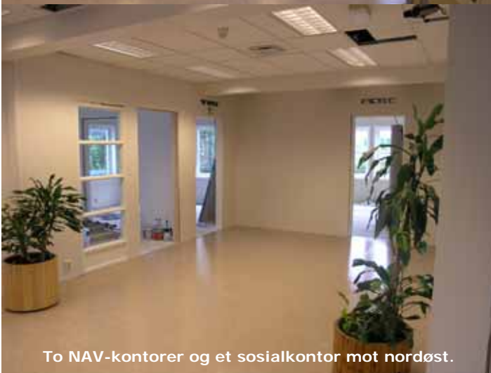
To NAV-kontorer og et sosialkontor mot nordøst.