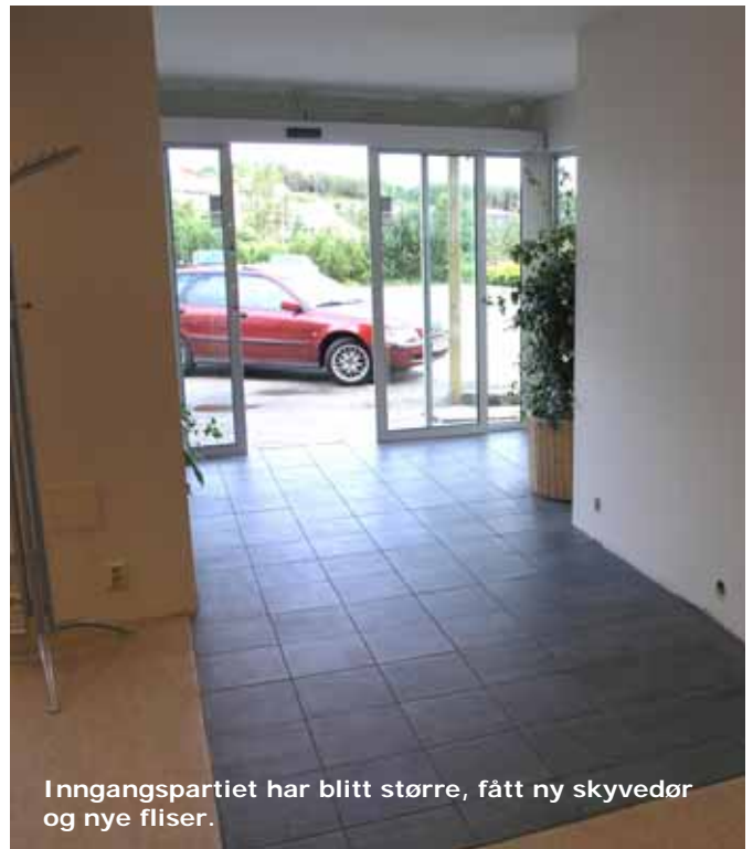
Inngangspartiet har blitt større, fått ny skyvedør og nye fliser.