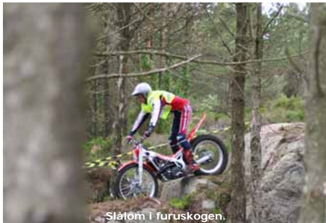
Slålom i furuskogen.

men etter en gjennomkjøring ble utfordringene tatt på strak arm og smilet kom på plass.