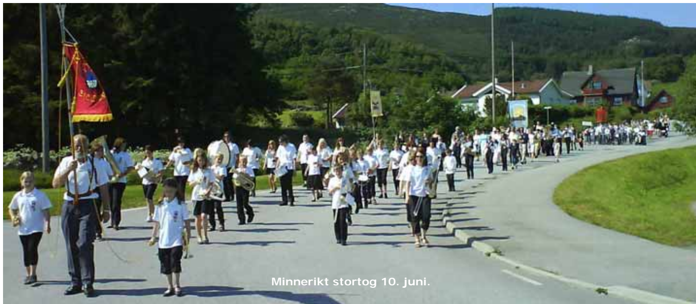
Minnerikt stortog 10. juni.

Rennesøy - og publikum til slutt. Sannsynlegvis går det sju år til neste gong boknaren igjen får oppleve ei slik musikalsk forsamling i marsjtakt.