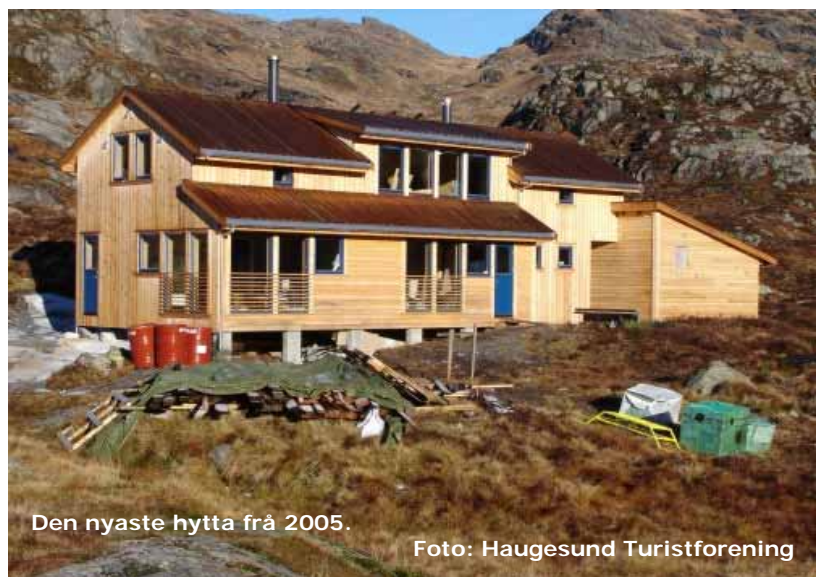
Den nyaste hytta frå 2005.

Når alle hadde pakka sakene og funne rommet sitt, sto me fritt til å gjere det me ville. Like ved hytta låg eit vatn