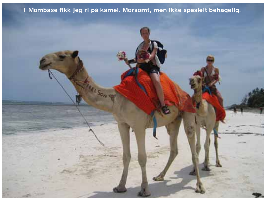
I Mombasa fikk jeg ri på kamel. Morsomt, men ikke spesielt behagelig.