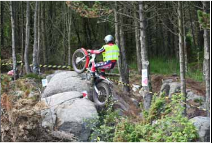
Det går ned og det går opp.....

BIL. Dette viser det gode samarbeidet i praksis.