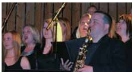
Boknakoret gjorde ein kjempeinnsats.