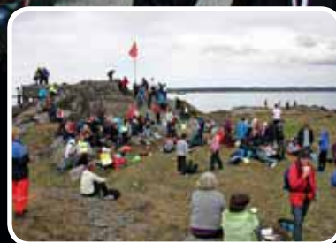
Helse & Historie – s. 14