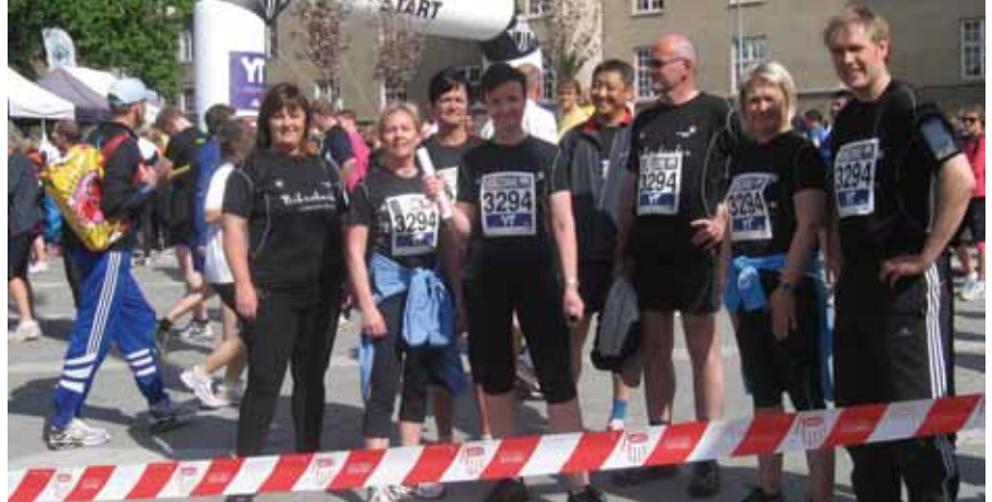
Endeleg - på startstreken

er vel noko vi ynskjer for både eigen og andre sin del!!