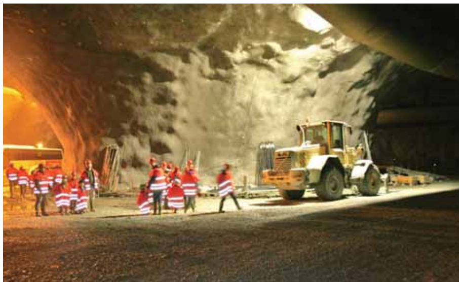
Rundkjøringa, som er plassert 60 meter under Fosen, er sprengt ut i fjell og blir Noregs største med ein diameter på 83 meter.