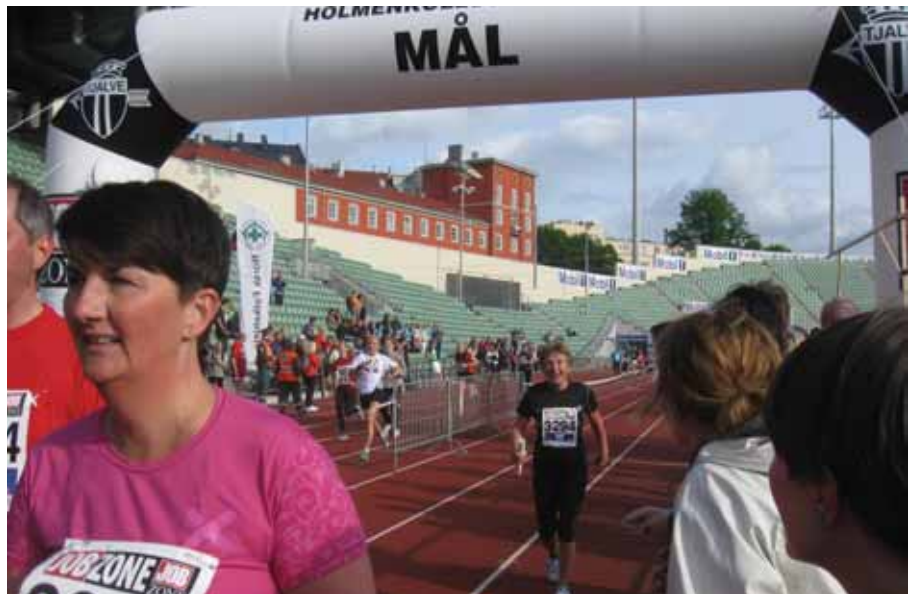
Ankerkvinn i mål