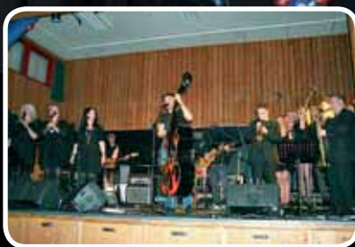
Fantastisk! – s. 8