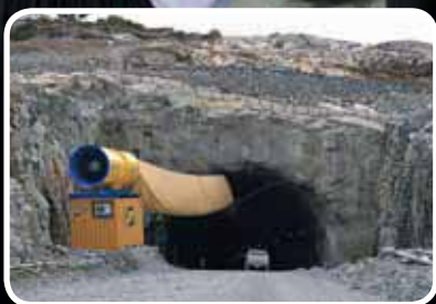
T-sambandet – s. 2