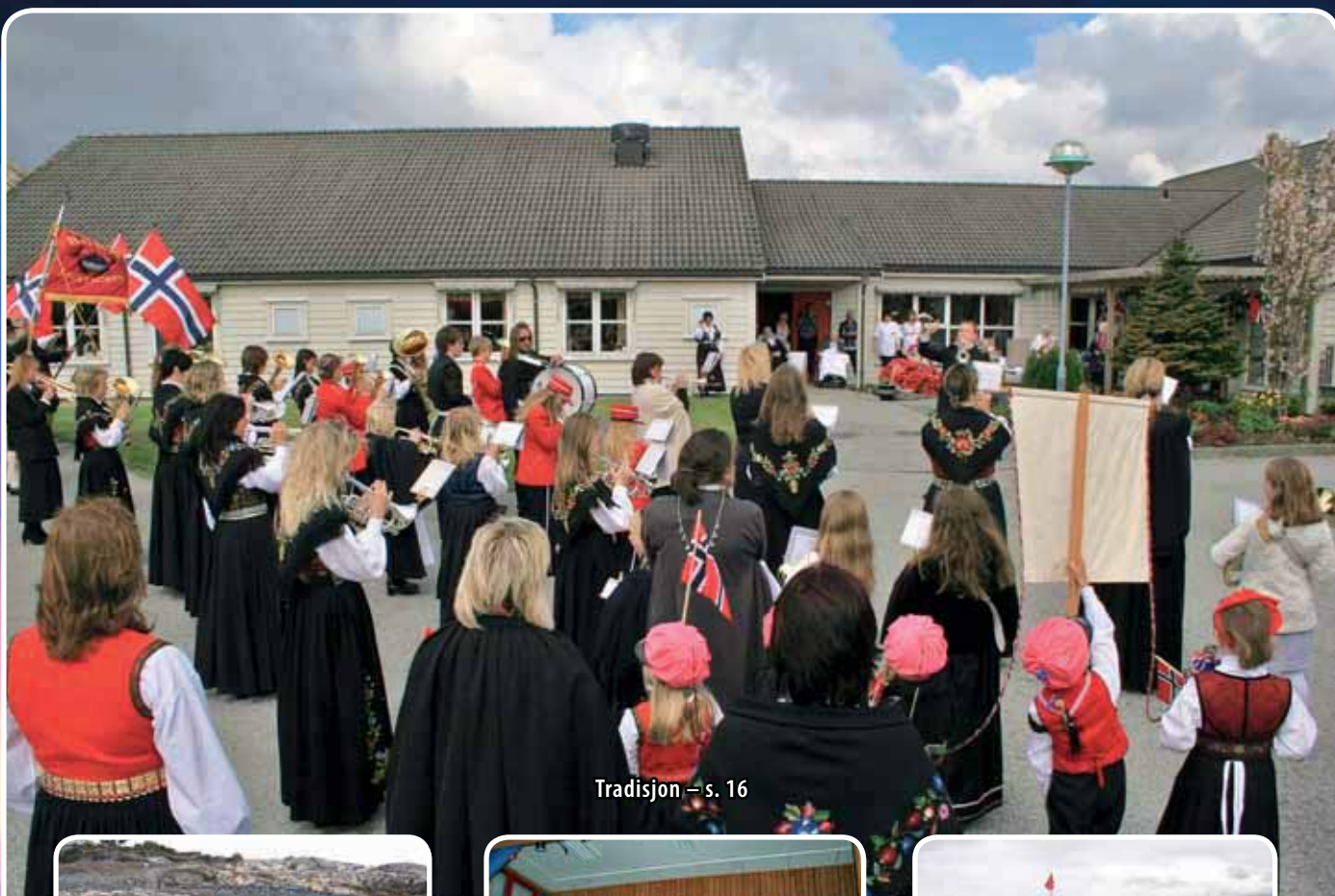
Tradisjon – s. 16