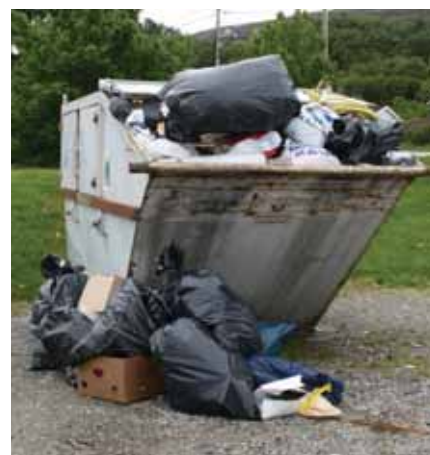
Miljøstasjonen i Føresvik har i lengre tid vore utsett for eit omfattande misbruk.

Miljøstasjonane var opphavleg tenkt som returpunkt for papiravfall og glas- og metallemballasje og som ordning for enkelte hytteabonnentar og mindre mengder restavfall frå privatpersonar. I lengre tid har desse miljøstasjonane vore utsette for eit omfattande misbruk. Miljøstasjonen i Føresvik har stort sett framstått som ryddig, men tidvis kan ein sjå at det er for mykje avfall som hamnar utføre containerane. I tillegg blir det plassert avfall som ikkje er meint for denne miljøstasjonen på utsida av containerane, til dømes vaskemaskinar, bildekk, bilbatteri osv.