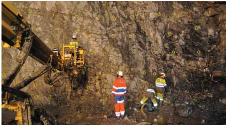
Detonasjonslunter og skyteleidning blir klargjort for nok ein salve under Karmsundet. Inndrifta er omlag 40 – 50 meter per veke.

T-sambandet har ein prislapp på 1500 millionar kroner. Staten tar 31% av finansieringa, mens 57% skal dekkast inn gjennom bompengeneinnkreving, mens 12% er tilskott/forskott frå vertskommunane. Bompengeneinnkrevinga har pågått på sambandet Arsvågen-Mortavika sidan 2001, men etter opninga av T-sambandet skal innkrevinga skje på veg i 15 år via bom nær Mjåsund. Dei førebels takstane er 22 kroner for liten bil og 44 kroner for stor bil.