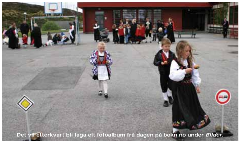
Det vil etterkvart bli laga eit fotoalbum frå dagen på bokn.no under Bilder.

Utetemperaturen kunne vore høgare, og det var ikkje smekkkfullt ved dei mest verutsette leikestasjonane. På fotballbanen var dette mest merkbart, ikkje berre pga. den kalde vinden, men også for at programoppsette Bokn Painballklubb glimra med sitt fráver.