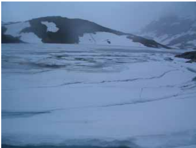
Sognefjellet sommeren 2007

Jeg fulgte E6 fra Stjørdal, over Dovrefjell og ned til Otta. Der forlot jeg E6, noe jeg syntes var helt greit. Da hadde jeg hatt