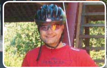
På sykkel frå Stjørdal til Bokn. Les meir s. 18