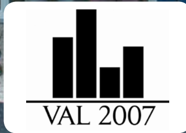
Partia svarar på spørsmål. Les meir s. 8