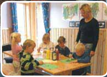
Barnehagen I ny fasong. Les meir s. 4