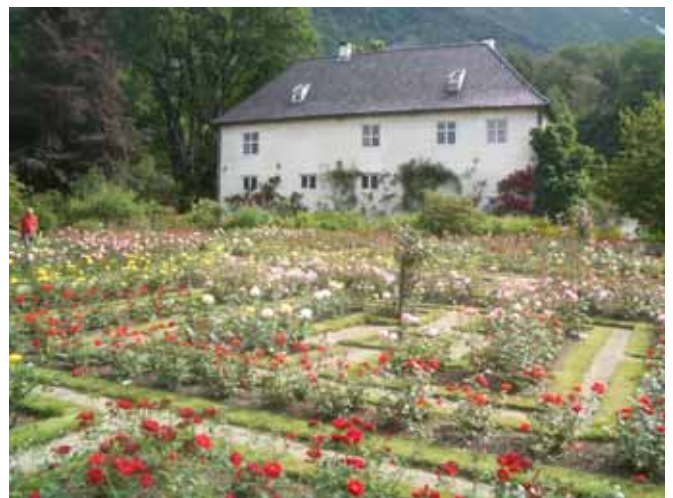
Baroniet i Rosendal

turistveg langs Hardangerfjorden ned til Kvinnherad. En liten rast i Rosendal måtte med på programmet. På andre siden av fjorden ligger Skånevik, og jeg begynte virkelig å nærme meg. Der var det full rulle med bluesfestival, sol og tusenvis av glade mennesker. Det var fristende å bli, men jeg måtte trå opp den siste lange oppoverbakken til Etne.