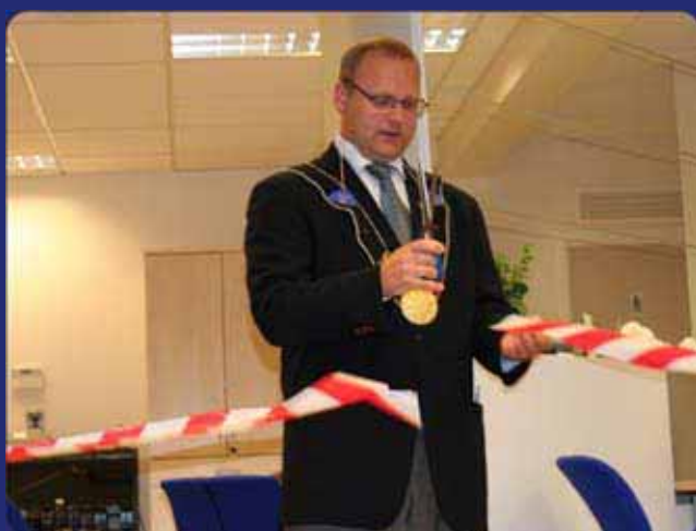
Fellestorget vart opna med fin snert frå saksa.

Måndag 20. august var det storstilt opning av felleslokala for bank, NAV og Servicetorg på Boknatun.