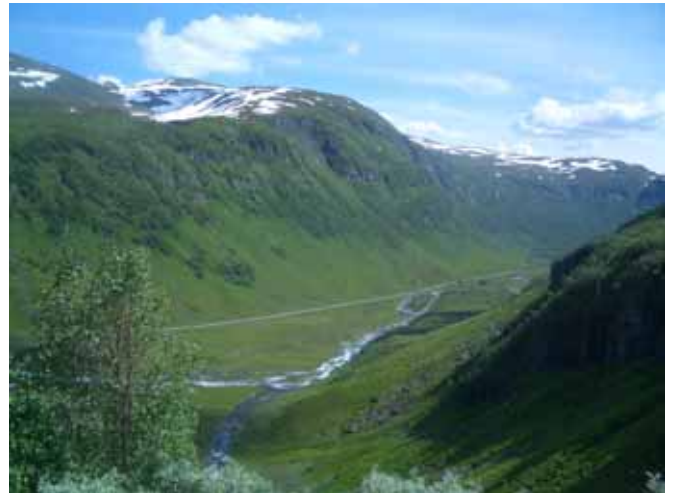
Voss i Hordaland

Sogndal unnet jeg meg overnatting på hotell, og nesten et døgn hvile. Det gjorde godt, og jeg fikk tørket telt og klær. Det var fint å sykle langs Sognefjorden i sol og med uthvilte bein. Det trengte jeg, for Vikafjellet var en hard kneik. På andre siden av Vikafjellet ligger Voss, med forbløffende flott natur. Videre gikk turen til Granvin, og jeg fulgte Nasjonal