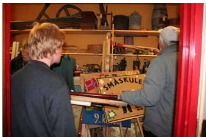
Det komplette kaos!

Turen gikk deretter til magasinet på skolen. Her ble det litt mer sukking over forholdene. Det var slett ikke ønskelig løsning å dele lager med skolen, men om det i praksis finnes løsning på muséets behov er usikkert.