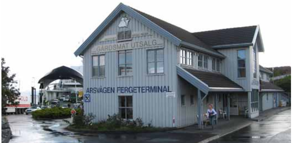
Arsvågen Kro og Gardsmat A/S er til sals.

Elles har det her som elles i distriktet vore knapt med arbeidskraft å få tak i, men dette er noko som dei fleste strevar med.