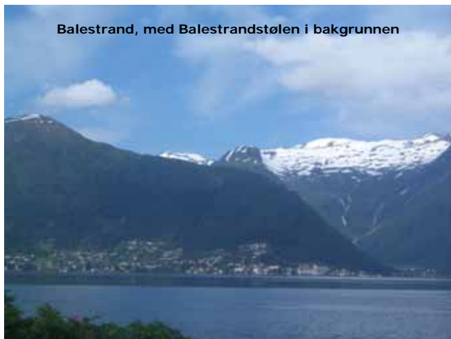
Balestrand, med Balestrandstølen i bakgrunnen

Noe av det tyngste med sykkelturen var faktisk å sykle ned på andre siden av Sognefjellet. Etter to mil nedover med konstant bremsing ble jeg øm i hendene og ganske kald. Å få se sjøen innerst i Sognefjorden var en fin opplevelse. I