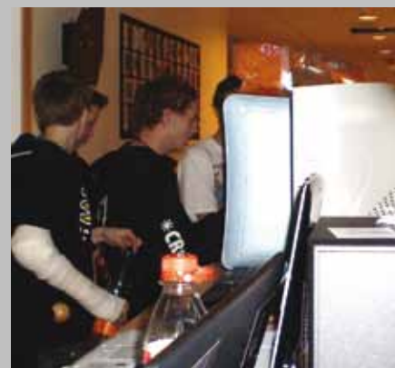
Ikkje berre barbare.

den får vi prøve å få på plass til hausten. Då har Petra fritidsklubb og biblioteket håp om å få til ein slik spelekveld til.