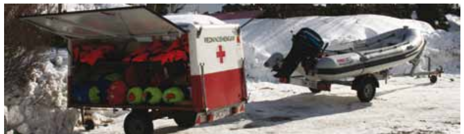
Noko av alt utstyret som er klart om noko skjer. Alt skaffa av medlemmane og god støtte lokalt.

Ikkje før var denne seansen over før pyntekomiteen gauv laus på å laga