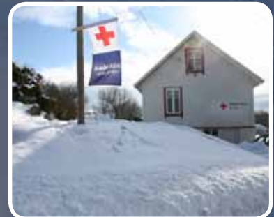
20 års jublant 2 – s. 16