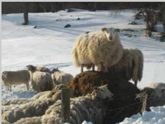
På toppen av matfatet.

For sauene blei siloballen på marken daglig kjærkommen kost. Ingenting å si på denne sauene sin iherdige evne til å få spise på toppen av matfatet. Hun er sjef, balanserer, spiser og viker ikke når fotografen nærmer seg, men kikker rett inn i kamera. Her er rangsorden. Lederne, de eldste først og de yngre venter på tur i bakgrunnen.