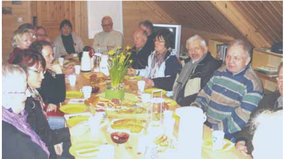
Ein del av møtedeltakarane.