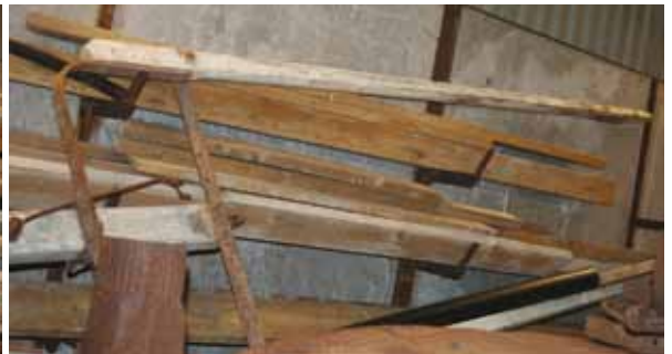
Treskeverk med hjul og "skjeger"