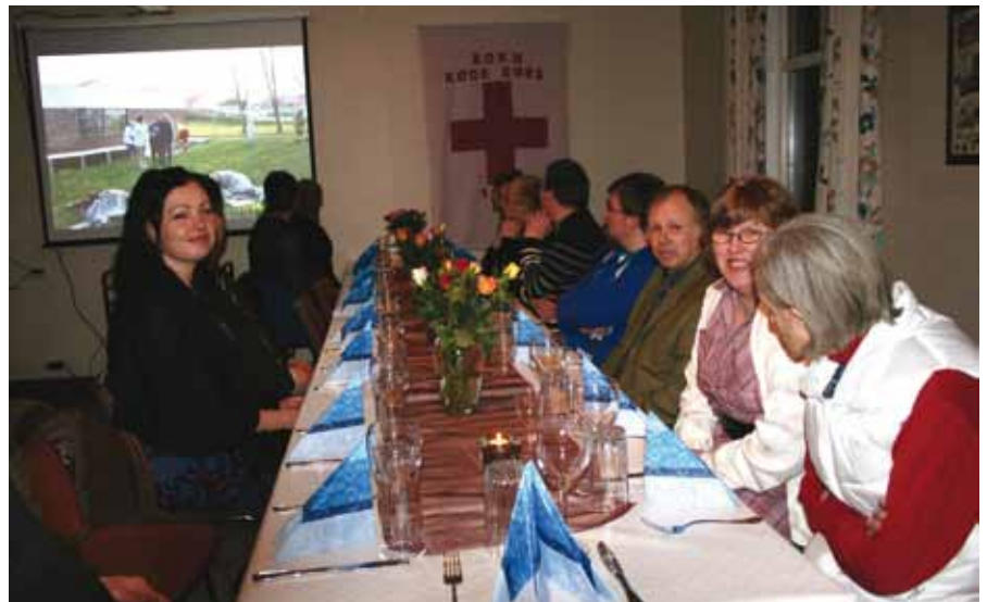
Eit av dei fint pynta langborda for kvelden.

For dei som var innom under open dag, kunne dei sjå at det gamle bedehuset som me overtok på tampen av 2002 er tilbake i full prakt. Huset var i