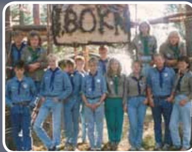
20 års jublant 1 – s. 12