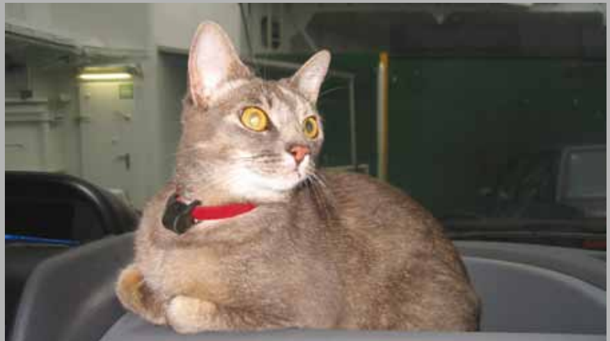
Her ligg eg på dachbordet i bilen, på ei av fergene.

De kan tru eg skremde dei fyrste sommaren på Bokn. Eg prøvde ei krabbeteine som eg ikkje kom meg ut or. Var der nokre timar, fredeleg, men det smaka godt med mat etter-