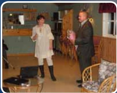
Bokn og Rogfast – s. 4