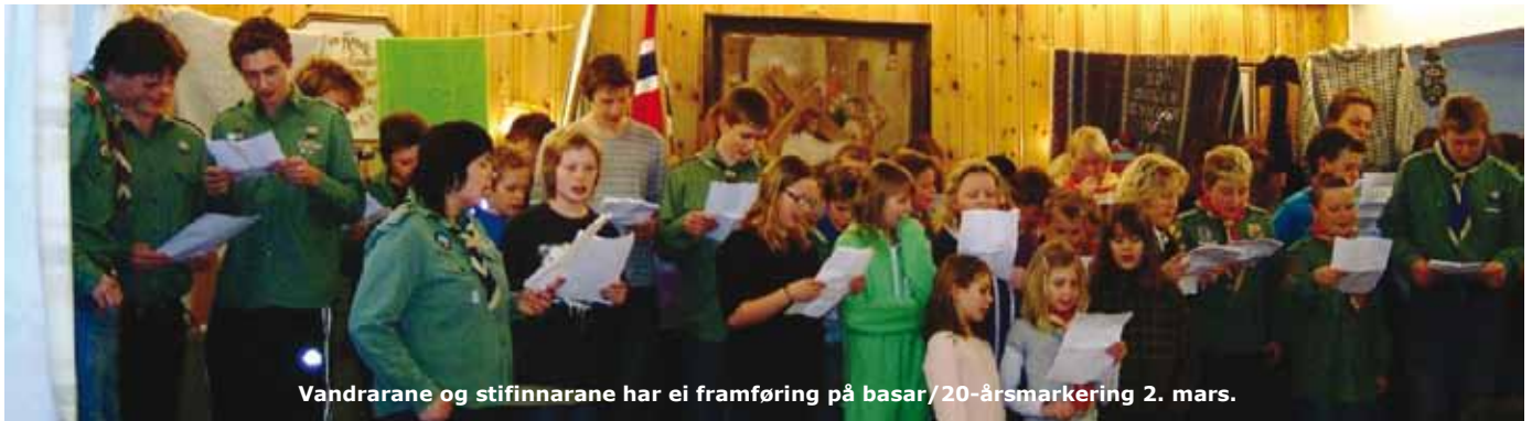
Vandrarane og stifinnarane har ei framføring på basar/20-årsmarkering 2. mars.