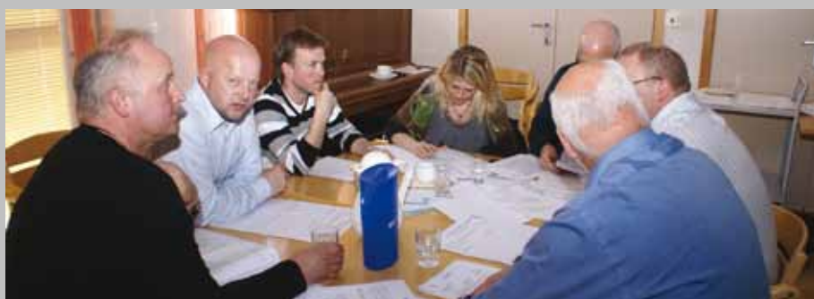
Gjennom gruppearbeid og diskusjoner kom deltakerne med innspill som tas med i det videre arbeid med næringsplanene og dermed næringspolitikken i kommunene.

Oppdaterte næringsplaner med konkrete tiltak, er viktige redskap i det videre arbeidet for kommunene og næringslivet. Planene skal gi synergieffekt både kommunalt og for regionen og vil videre påvirke prosessen knyttet til fylkeskommunal næringsplan.