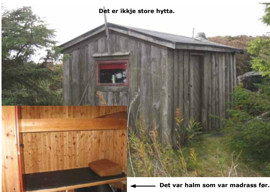
Det er ikkje store hytta.

På Kvitsøy og Tananger har det visstnok vore eit bra fiskeri i 2009, 1.000 homrar på 100 teiner i løpet av sesongen har eg høyrte om, så me får håpa fiskeriet snur seg her inne også til neste år.