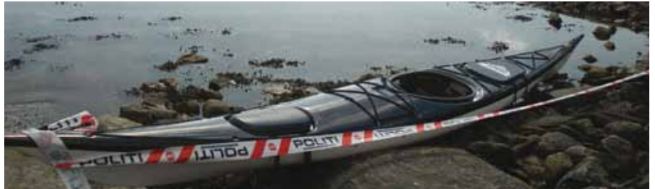
Kajakken blei funne i Kråkevågen 8. april.

Han trivst svært godt i laget og gir uttrykk for eit veldig bra samhal i