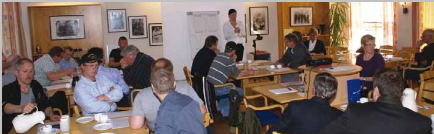
Stor interesse for arrangementet i Bokn. Hele verdikjeden i oppdretts- og fiskerinæringen i Haugaland Vekst-kommunene var representert.

22. april var det mulighetsarena innen kultur og næring i Tysværtunet. 4. mai er det innen bygg og anlegg på samme plass, kl. 12-14. Mer informasjon