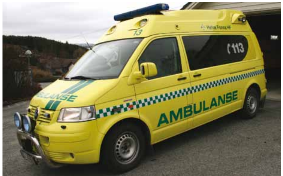
Ambulansen på Bokn blei frå 1. april førsterespondar-bil.

I hovudsak har avtalen med Helse Fonna gått ut på at Helse Fonna har