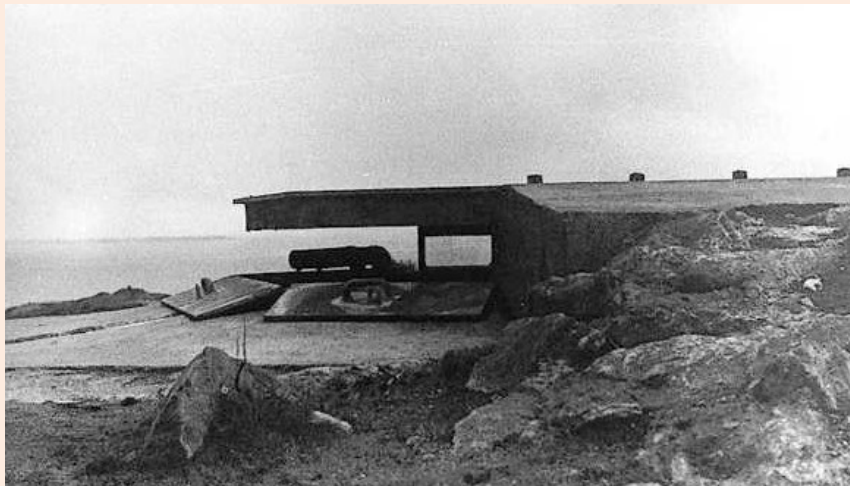
Kanonstilling i Loten.

Mest heile det kommunale fokuset – og hjå folk flest – låg i desse tider på å sikra matvaretilgangen og nødvendige utstyr til fiske og jordbruk. Mest alle saker som var oppe i dei kommunale utval dreidde seg om forsynings-situasjonen. Fyrst sist i mai tok så smått også andre saker til å koma opp til handsaming. I samband med heradsstyremøtet 25. mai dreidde fire av dei ni sakene seg om anna enn det som hadde med forsynings-situasjonen å gjera. Av desse, galdt ei sak godkjenning av rekneskapen til trygdekassen. Det dreidde seg vidare om å hjelpa ein kar som var