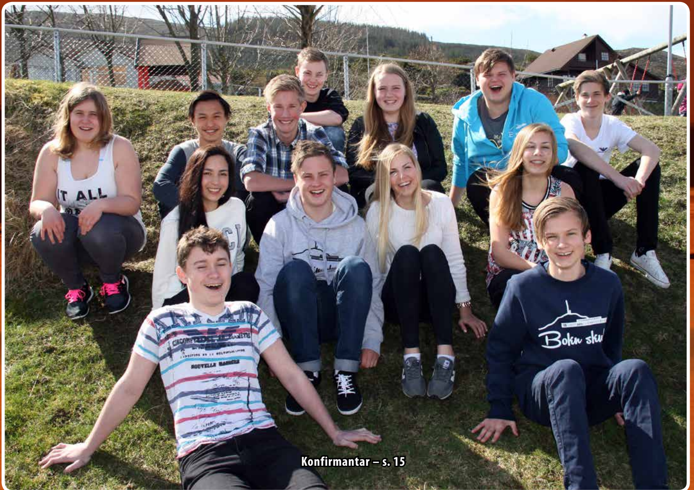
Konfirmantar – s. 15