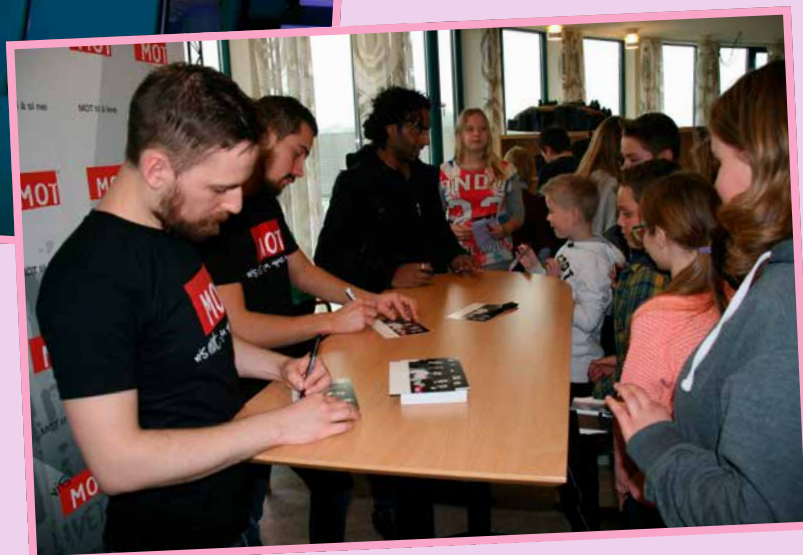
Etter konserten var det autografskriving og bildeknipsing.