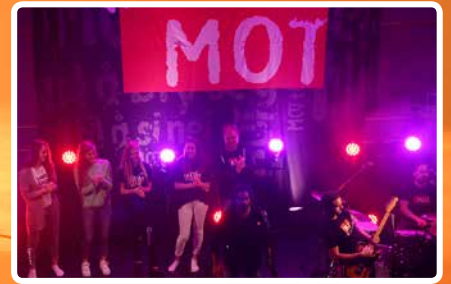
MOT-konsert – s. 6