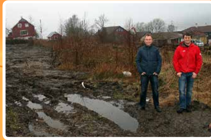
Einebustader – s. 4