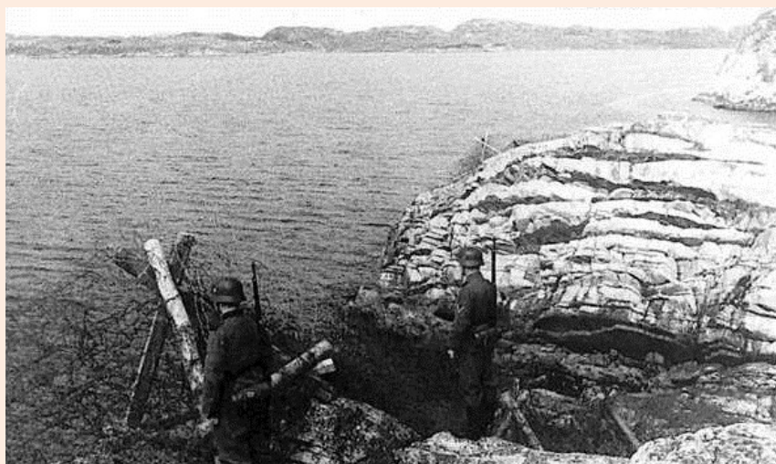
Tyske soldatar i Bokn.

Den betra kontakten med omverda og det at ein fekk ein betre oversikt over forsynings-situasjonen, gjorde at ein gradvis lempa på dei temmeleg strikse eksportrestriksjonane. Det fyrste produktet som slapp fri, var