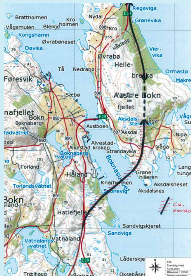
Mogleg framtidig trasé for E39 over Bokn.

Også i forhold til miljø- og trafikksikring er det gunstig å få betre vegar. I dag er det 192 avkjøringar og 50 kryss på vegstrekket mellom Bokn og Stord. Å lage færre og planfrie kryss vil minka faren for trafikkulukker. I tillegg vil to skilte kjørebantar redusere talet på møteulukker.