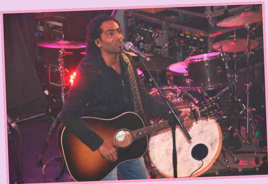
Chand er ein god ambassadør for MOT.

Artisten som vann X Factor på TV 2 i 2009, er imponert over alle dei flinke ungdommane dei møter på turneen, alle talentane som bur rundt omkring i landet.