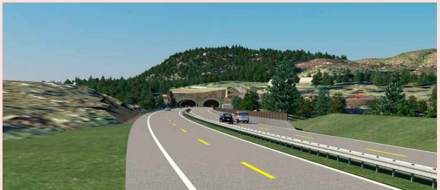
Framfor tunnelopninga på Laupland.

Prislappen på Rogfast er berekna til 14,2 milliardar 2015-kroner. Staten bidreg med 2,830 milliardar, resten må finansierast av bompengar. Det er rekna med ei rente på 5,5 prosent. Rogaland fylkeskommune blir beden om å stiller garanti for lånet i bompengeselskapet på 16 milliardar kroner.