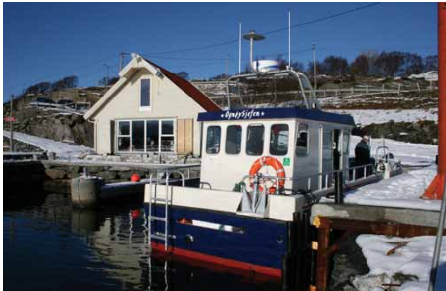
"OgnøySjefen" ligg til kai på Ognøy 50 m frå E39.

I tillegg er han utstyrt med bunn-deteksjonsutstyr som målar opp havbotnen tredimensjonalt ned til 1000 meters djup. Båten kjem til å ha base i ny hamn på vest-sida av Ognøy, der det er oppført sjøhus, heisekran og snuplass.