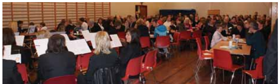
Turfolk og andre ventar i spenning.