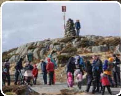
Re-start – s. 4