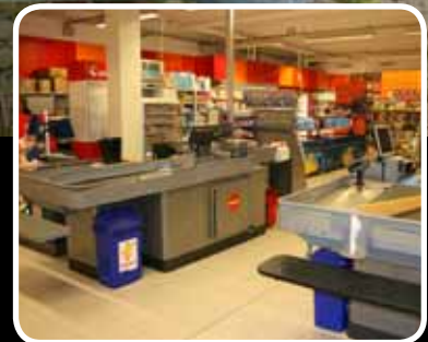
Nyopning – s. 8