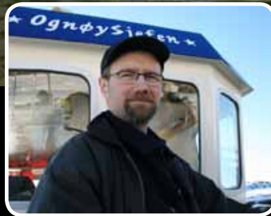
Skyssbåtteneste – s. 7