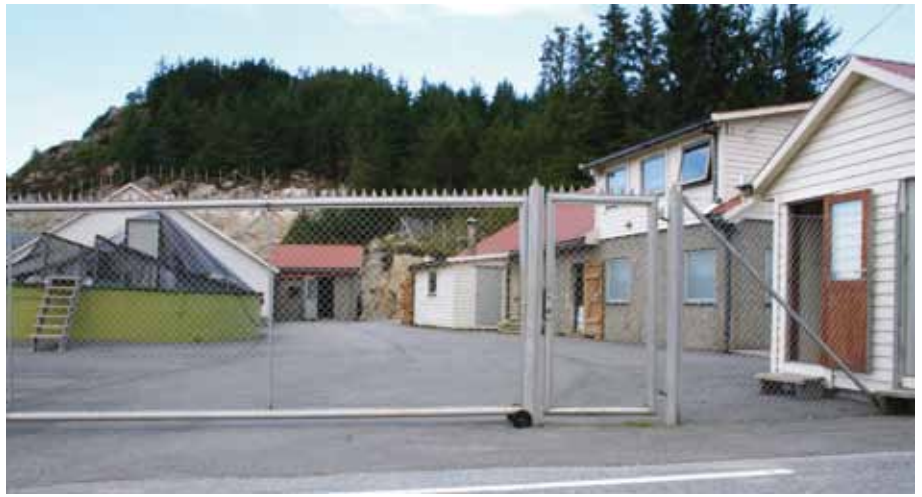
Det opprinnelige oppdrettsanlegget.

Det er 9 årsverk knytta til anlegget på fast basis. I tillegg kjem ein del vikar og sesongarbeid. Her trekk Grieg til seg ein heil del boknarar til seg. Dette gir ringveknader i boknasamfunnet. Den største utfordringa er faktisk bu-