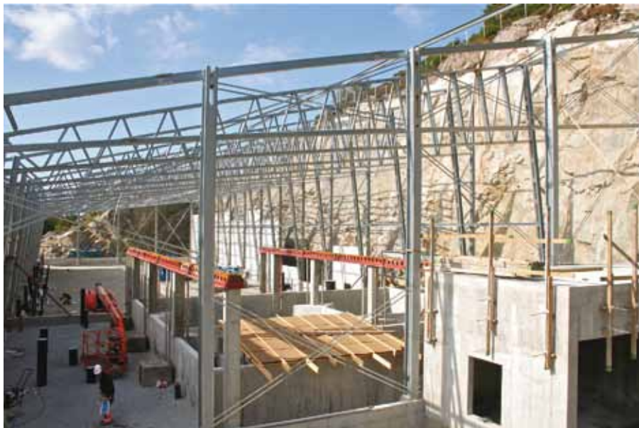
Den nye hallen med reinsingsanlegget for vatn som gir eit nytt løft for oppdrettet av smolt.

- Dette skal ikkje bare verta eit stort løft for Grieg produksjonsmessig, men og verta eit av dei finaste anlegget for