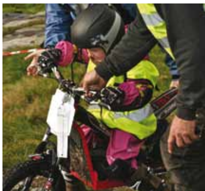
Denne ekvipasjen var miljøvennlig, gjekk på batteri og sjarmerte meg.

Sundag var det på an igjen. No var det KM som sto for tur. Her var det og kommande trialstjerner som fekk vist seg fram. Dei hadde 5 seksjonar med varierende vanskelighetsgrad å boltra seg i. Kjøyregleda var stor og