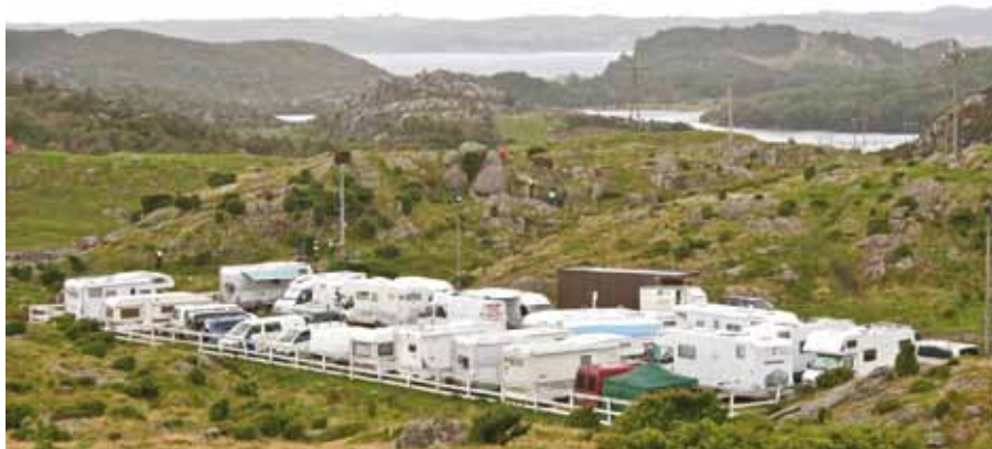
Det nye byggefeltet på Torland.

18. og 19. september møttest dei til kappestrid på to hjul og totaktbensin som spreidde seg over heile Torland med si umiskjennelege lukt. Ei god avveksling mot hevdalukt, vil vel mange meine.