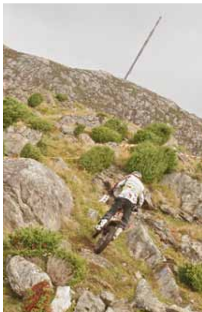
Kor høgt skal eg?

fordelte på forskjellige klassar, og 101 deltakarar var totalt i sving. På kvar seksjon var det ein dommar og ein klyppar. Deltakarane hadde eit kort som vart klypte etter kor mange prikkar/feil løparen hadde i seksjonen. Det