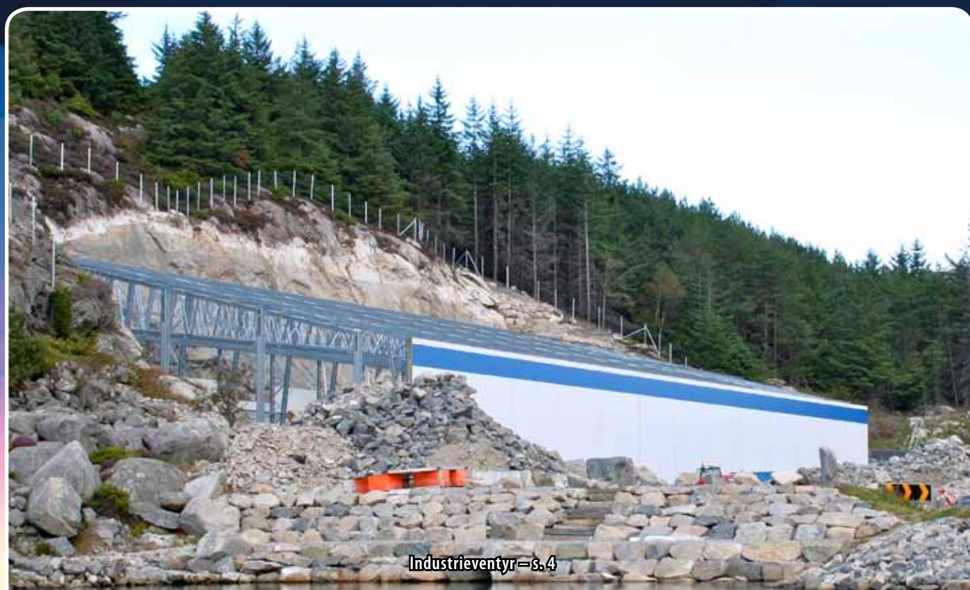
Industrieventyr – s. 4