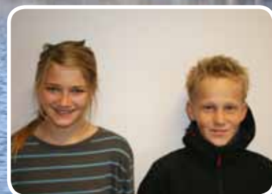
Flinke syklistar – s. 19