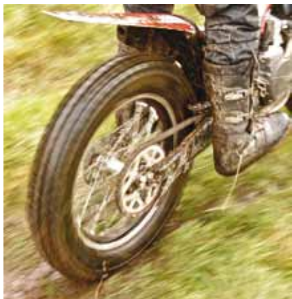
Så søla fyk.

klagar på desse frå kjørarar og foreldre. Likevel hende det at det sprakk for nokon ein kvar. Ein løpar var noko irritert på ein dommar og dommaren repliserte med