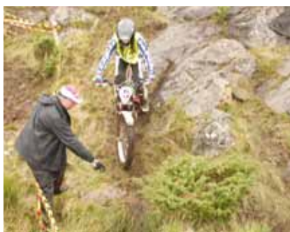
Jenter deltek på lik linje med gutta og hevda seg svært godt.

rekruttane så ut til å trivast på Torland.