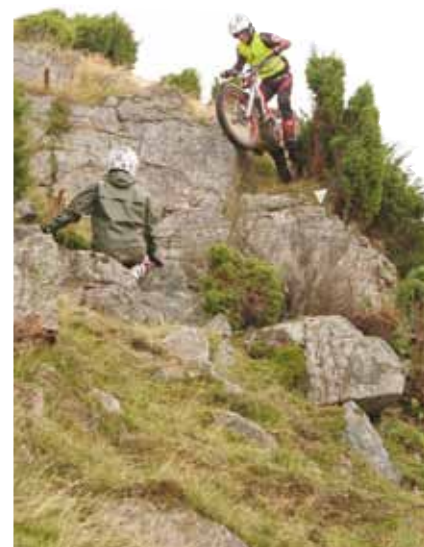
Eg SKAL ned.

Det vart heldigvis ikkje så mykje å gjere for han, det er nesten utrolig kor god kontroll på sykkel og kropp trialkjørarane har. Ein legg og ein ukjent nakkeskade var det som er verd å nemne på skadelista.