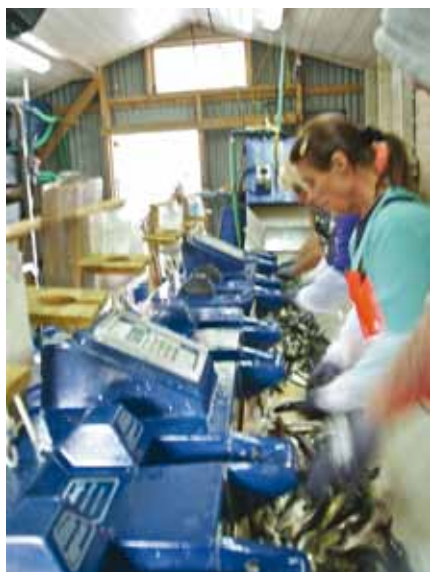
Vaksinerings av smolt.

- Dette skal ikkje bare verta eit stort løft for Grieg produksjonsmessig, men og verta eit av dei finaste anlegget for