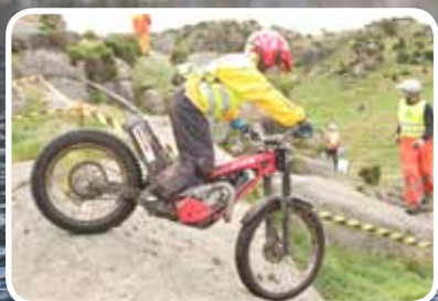
Trialhelg – s. 8