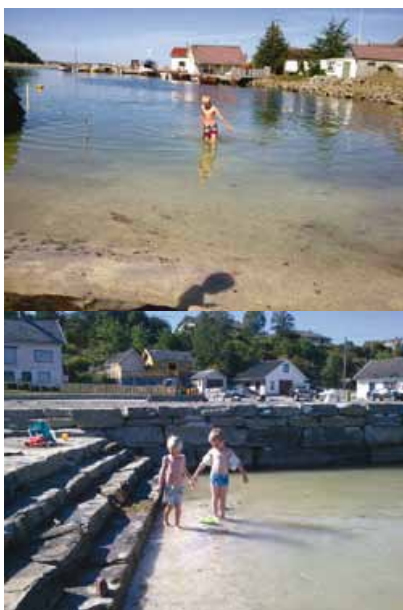
Bokn Bygdablad kjem tilbake til prosjektet.