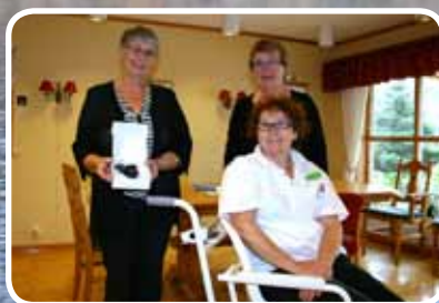
Slo til igjen – s. 15