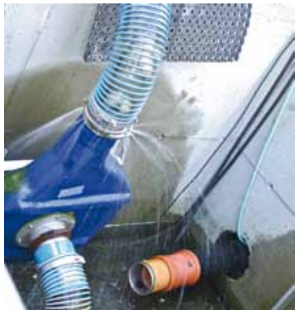
Smolten blir pumpa ut av kara og opp til vaksineringsbordet.

Det har vore utbyggingsplanar lenge, men på grunn av finanskrisa vart det ikkje fortgang i planane før i 2008/2009. Då vart ei tomt på ca. 5 mål skote ut og planert.