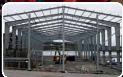
Bokn Maritime Senter – s. 4