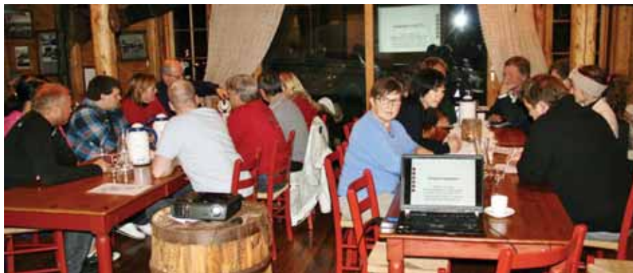
Ivrigte deltakarar: Representasjon frå heile 7 frivillige lag.

Deltakarane (som representerte 7 lag og organisasjonar i Bokn) ser alle eit behov for å samlast for å diskutere lagsarbeid med jamne mellomrom. Folkehelsekoordinatoren vert, på vegne av kommunen, ein naturleg medspelar her. Det er eit ynskje at folkehelsekoordinator set opp forslag til møteplan samt kallar inn til desse møta. I tillegg ser alle eit behov når det gjeld å marknadsføra lagsarbeidet og aktivitetane som finst i dei ulike