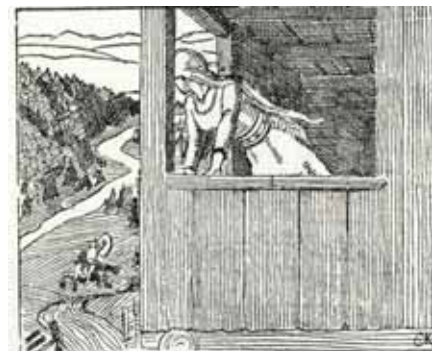
Nerabømannen kjem heim til kona med gullspenna.

Det gjekk eit gisp nedover benkane då unge kong Harald heldt opp gåva, ei