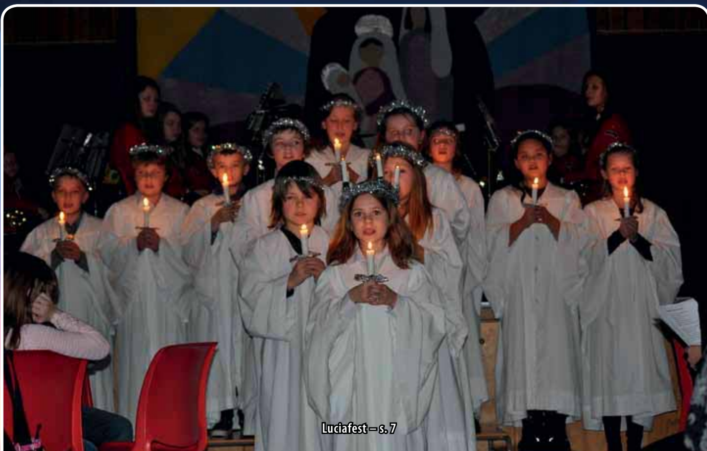
Luciafest – s. 7