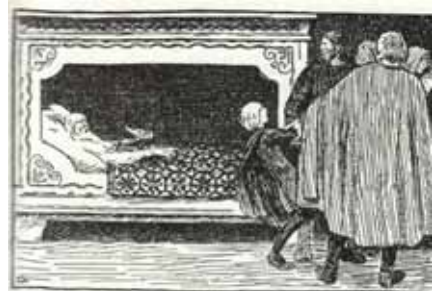
Då sonen var ganske liten, let ætta han trulova med jenta frå Sørbo.

Ho var laga i borrestil, den vanlege norske stilarten i vikingtida. Motivet var ordna i to store og ein liten kross. Elles var motiva fire hovud med glasperleauge og fire dyrekroppar med ryggen opp. Rundt ytterkanten av spenna batt eit kringlemønster hovuda saman.