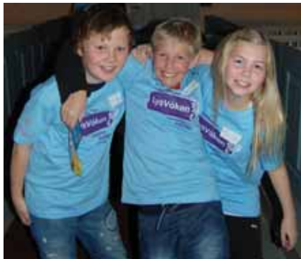
11-åringar klare for Lys vaken!

Etter at alle hadde fått kvar si lyseblå t-skjorte og lova at dei skulle vere greie med kvarandre, kunne kvelden byrje.