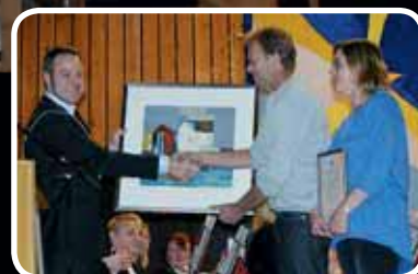
Kulturprisen 2011 – s. 10