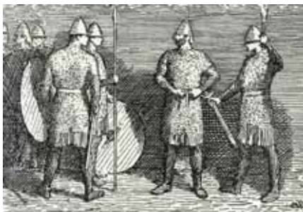
Boknarane bur seg til strid.

Tett før jul i 872 hadde Harald Luva – eller Harald Hårfagre som han blei kalla nokre hundreår seinare – tilhald på Avaldsnes. Det var varmt og behageleg i kongsstova med god eld i åren. Han fekk dette tilnamnet fordi han tretten år tidlegare kom til vera med morkaka på hovudet. Sengekoneane tok dette som eit godt teikn, han var født med ei sigersluve som det blei kalla. Den som blei født med sigersluva på hovudet ville sidan ha