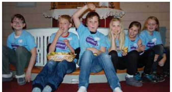
Fruktpause rundt alterringen.