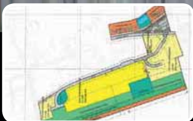
Nytt bustadfelt – s. 4