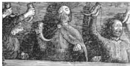
Sidan heldt dei juleblot.

I Hafrsfjord møttest dei to hærane, nordmennene til Harald og jærbruar og austmenn – egder under leining av hovdingane Haklang og Kjøtve.