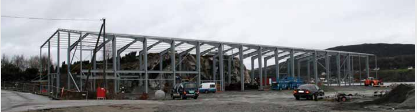
PR. 12.12: Hallen er 2.400 m 2 og ruvar godt i landskapet.

Staveland nemner også fleire interesserte aktørar, og ein ny hall på 2000-4000 m 2 med båtgarasjar er aktuelt. Han synest også det er flott at dei har blitt så godt mottatt av både Bokn kommune og boknarar elles, og dei