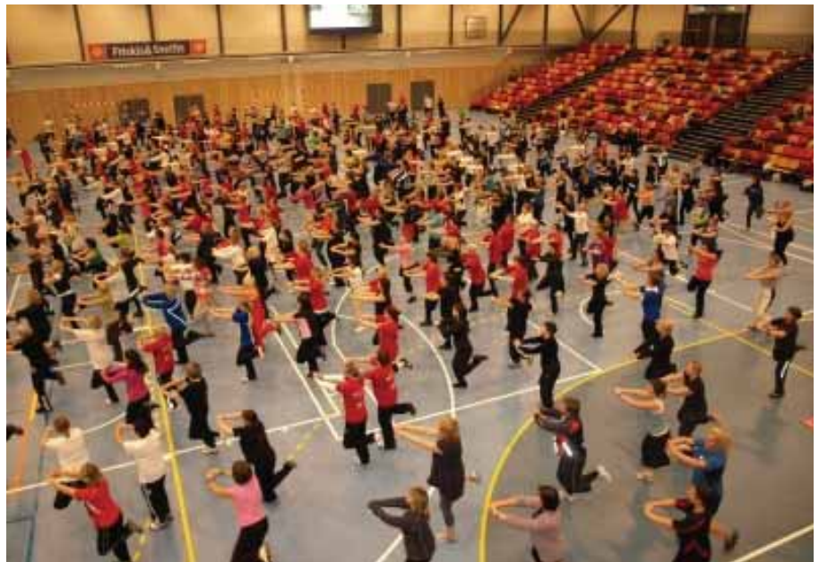
Vi har det gøy og får trening med på kjøpet!

Spør vi de samme om de med hånda på hjertet tror det ville være bra å redusere bruken av sukker og hvitt hvetemel tror jeg de ville svart rett. Men hva hvis vi spør om de tror det er