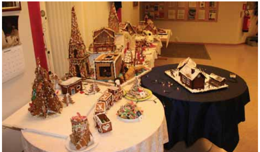
20 bidrag kom inn, i alle klassar: Enkeltpersonar, par, familiar og grupper.