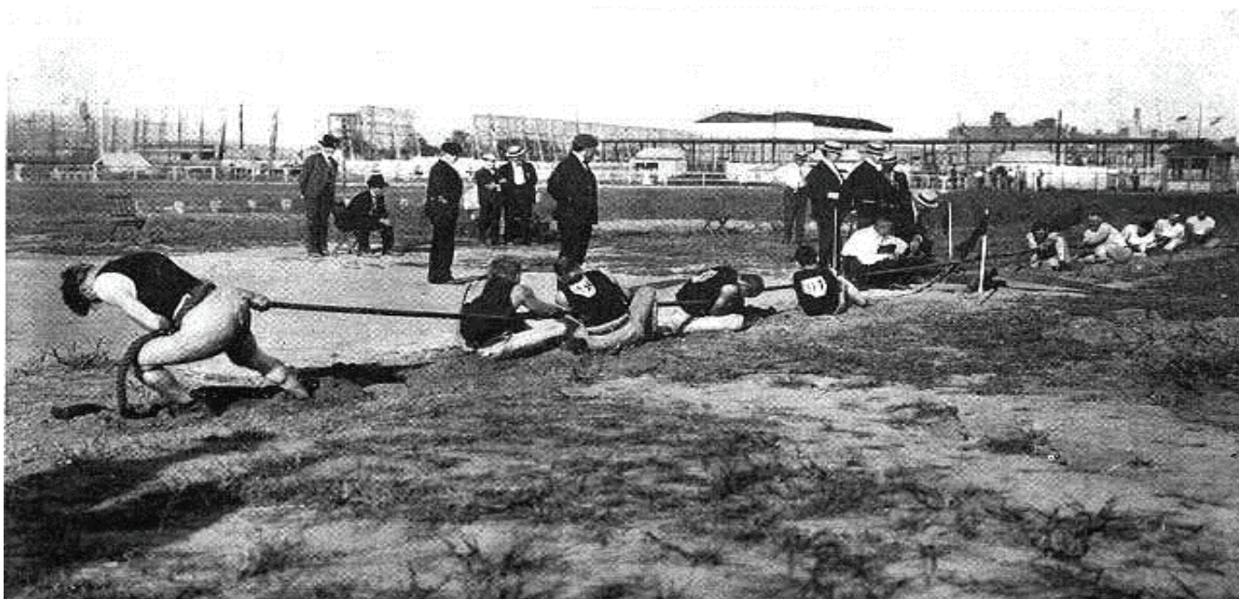
Foto frå Søre Våga i 1904. For hundre år sidan var det ein populær sport mellom vinnene "å gå him å trekkja", såkalla "himtrekkjng". Her trekkjer laget frå Nora Våga (til venstre) "him" og har såleis eit visst overtak. Dommaren med kvit stokk og stråhatt, er frå Ådnaneset. Bør "himtrekkjng" bli ei ny idrettsgrein i Bokn idrettslag?