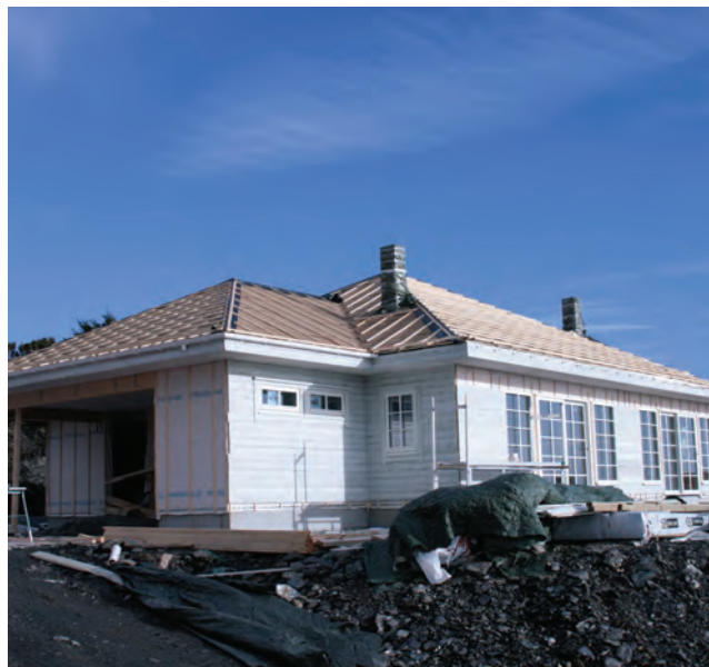
Bokn Senterungdom rettar søkelyset på totemangelen i kommunen. Her er eitt av dei siste husa som er bygd i Bokn. (red. ann.)

Det kan virke som om den politiske leiinga manglar forståing for korleis situasjonen er for unge boknarar og andre som ønskjer å etablere seg i kommunen. Unge boknarar som bur heime og vil forlate redet og etablere seg på Bokn vert naudsynt til å flytte til nabokommunane. Det er nemleg svært vanskeleg å komme inn på ein bustadmarknad kor prisane berre blir høgare i takt med at marknaden vert meir og meir eksklusiv. Desse marknadskreftane vert i tillegg forsterka av mangel på tomter, samstundes som at det tek lang tid for avklaring på dei allereie planlagde bustadfelt, som på Fyren