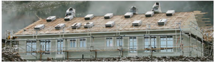
Eitt av dei siste husa som er bygde i Bokn.

Det har den siste tida pågått ein debatt når det gjeld bustadsituasjonen i Noreg. I kommunesektoren ser ein at den nye plan- og bygningslova er veldig komplisert, noko som forlenger planprosessane unødig og som førar til