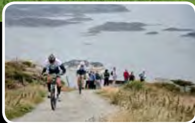
BoknOpp – s. 4