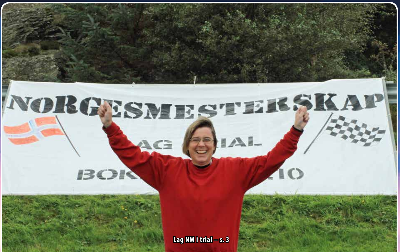
Lag NM i trial – s. 3