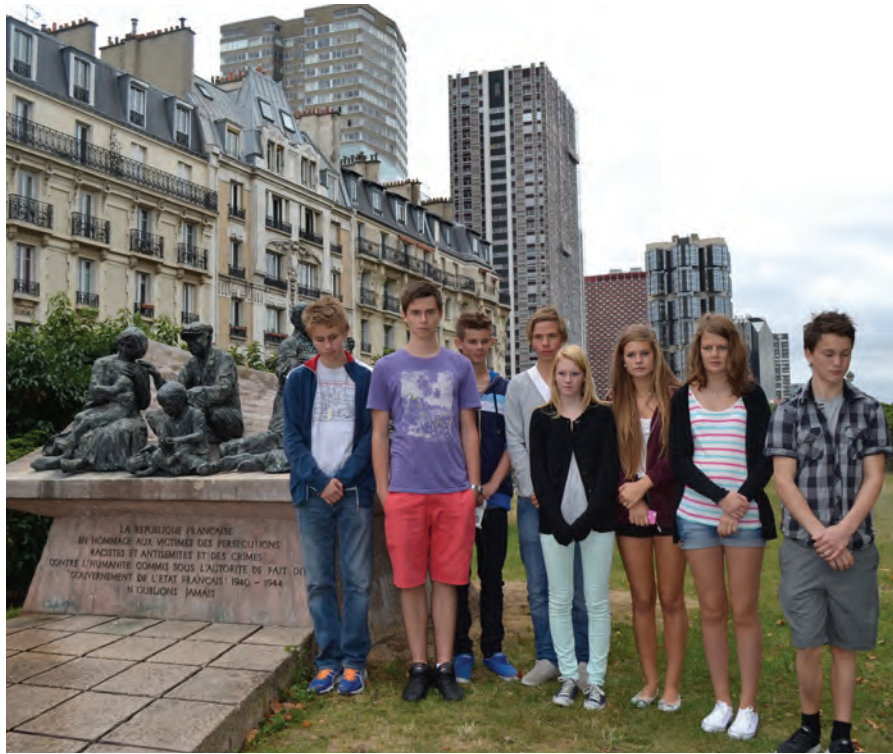
Ved minnesmerket etter Velodrome d' hiver.