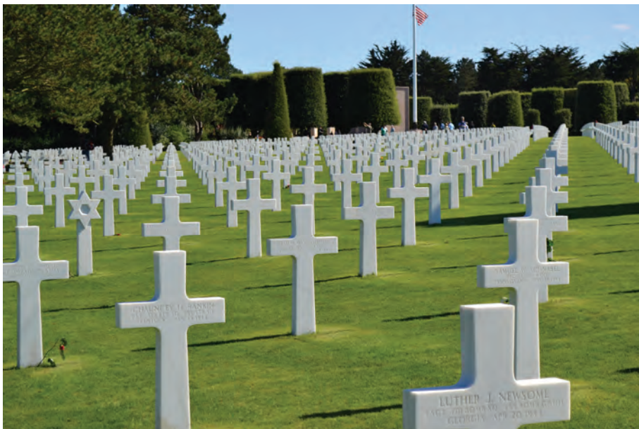
Den amerikanske gravplassen.

Me gjekk vidare til sjølve gravplassen der 9387 amerikanske soldatar er gravlagde. Det er mange tusen marmorokors som står på rette, parallelle