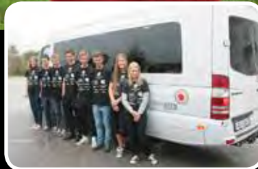
Studietur til Frankrike – s. 6