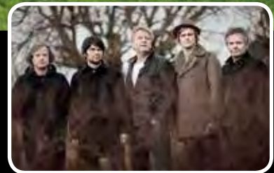
Billettsalet i gong – s. 11