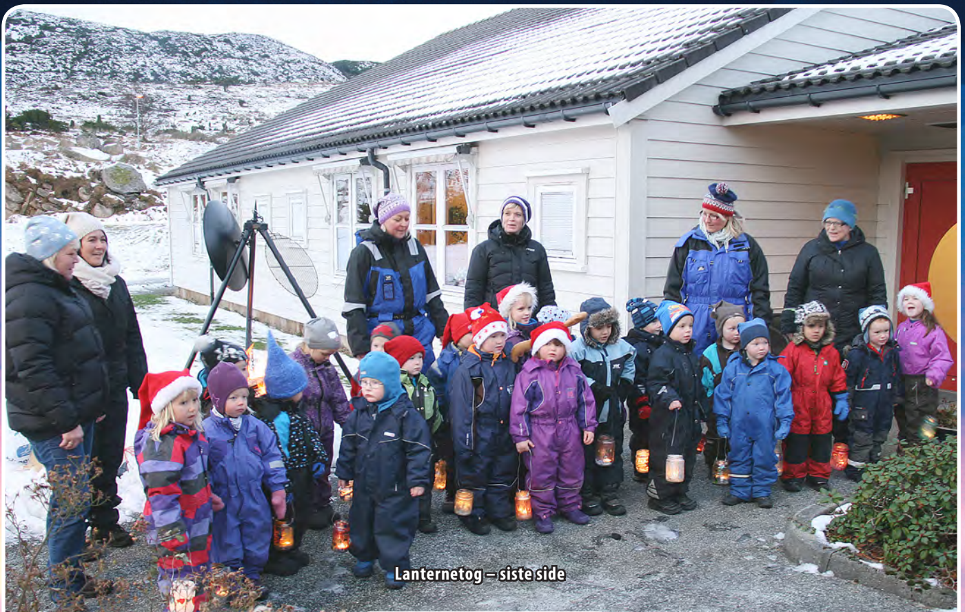
Lanternetog – siste side