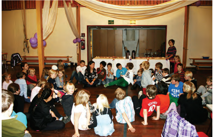
- Så...korleis kan den enkelte av oss eigentleg bidra til at alle skal ha det kjekt?