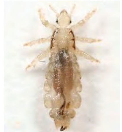
hvordan dette skal foregå.

Skolen og barnehagen vil da sammen med helsesøster komme frem til