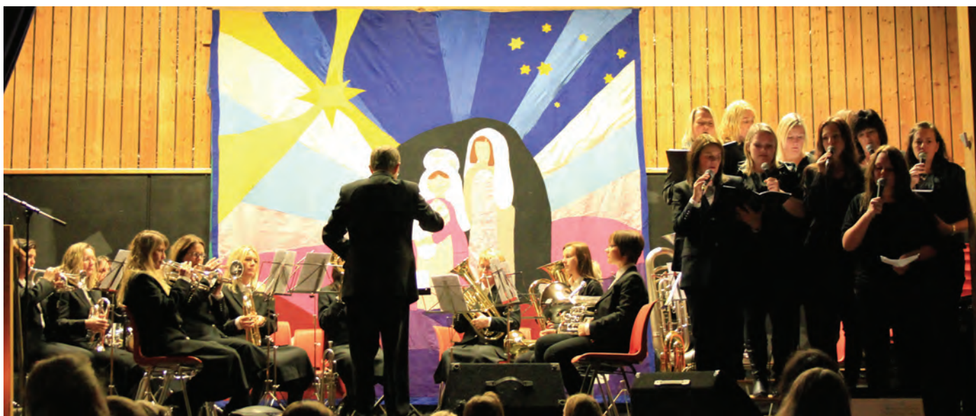
Bokn Brass og Boknakoret framfører " Et Lys Imot Mørketida ".

Samtlege aktørar gjorde ein kjempeinnsats på scenen, og bidro til ein koseleg Luciafest.