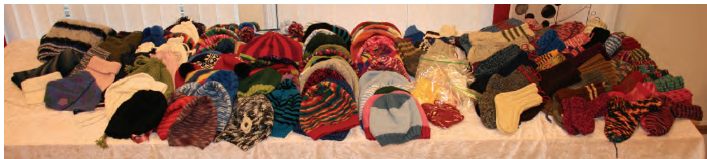
28. NOVEMBER: Ein del av dei strikka produkta klare til sending.

Me ynskjer å takke alle som bidrar med sekker med klede, som bakar til