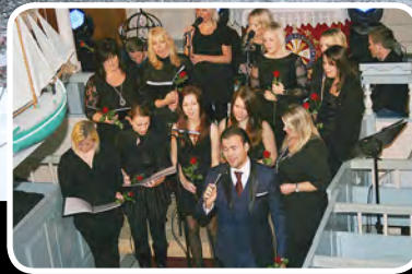
Julekonsert – s. 8