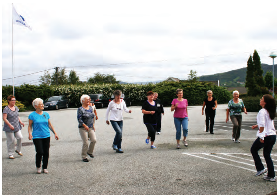
Utetrening 23. juni 2011