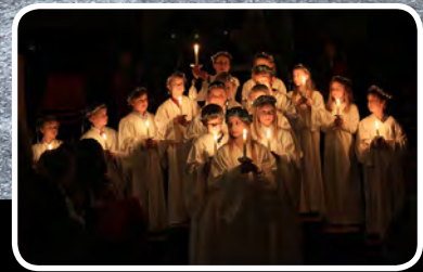
Luciafest – s. 11