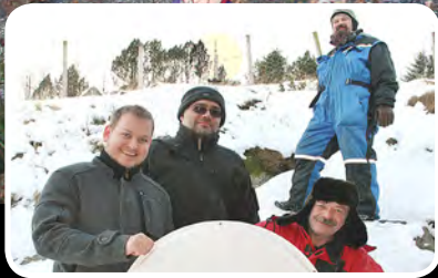
Tilbyr 10 Mbit – s. 3